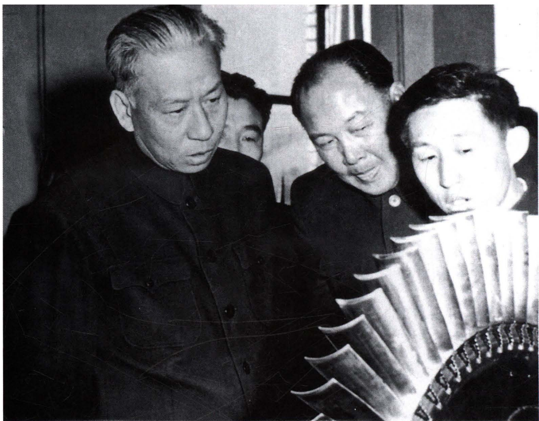
1955年11月13日,刘少奇视察410厂