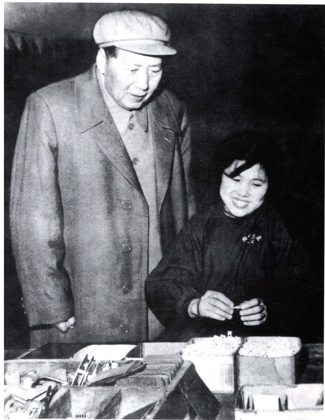
1958年2月13日，毛泽东视察沈阳市 小型开关厂（今沈阳213机床电器厂）