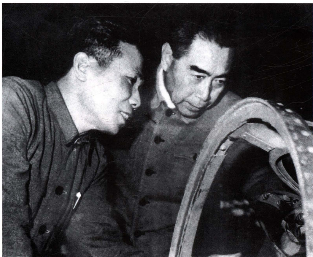
1962年6月12日,周恩来视察112厂