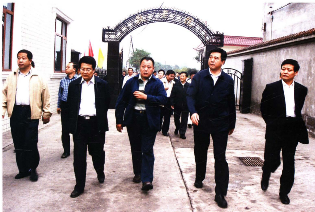
原山西省常委、太原市委书记申维辰，太原市市长张兵生 莅临一一焦化厂调研