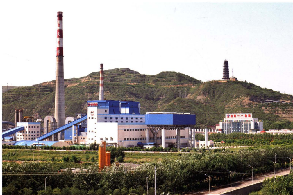
一一集团日月热电厂