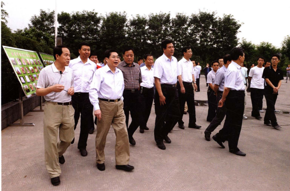
2010年8月30日，山西省委书记袁纯清莅临一一焦化厂调研