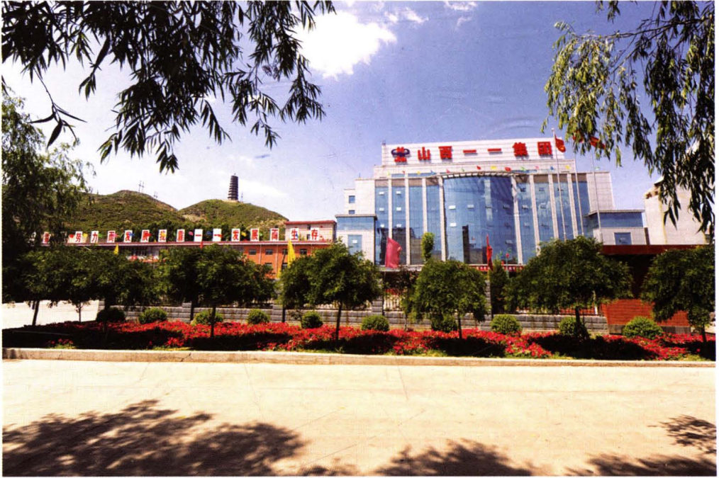
一一集团办公大楼