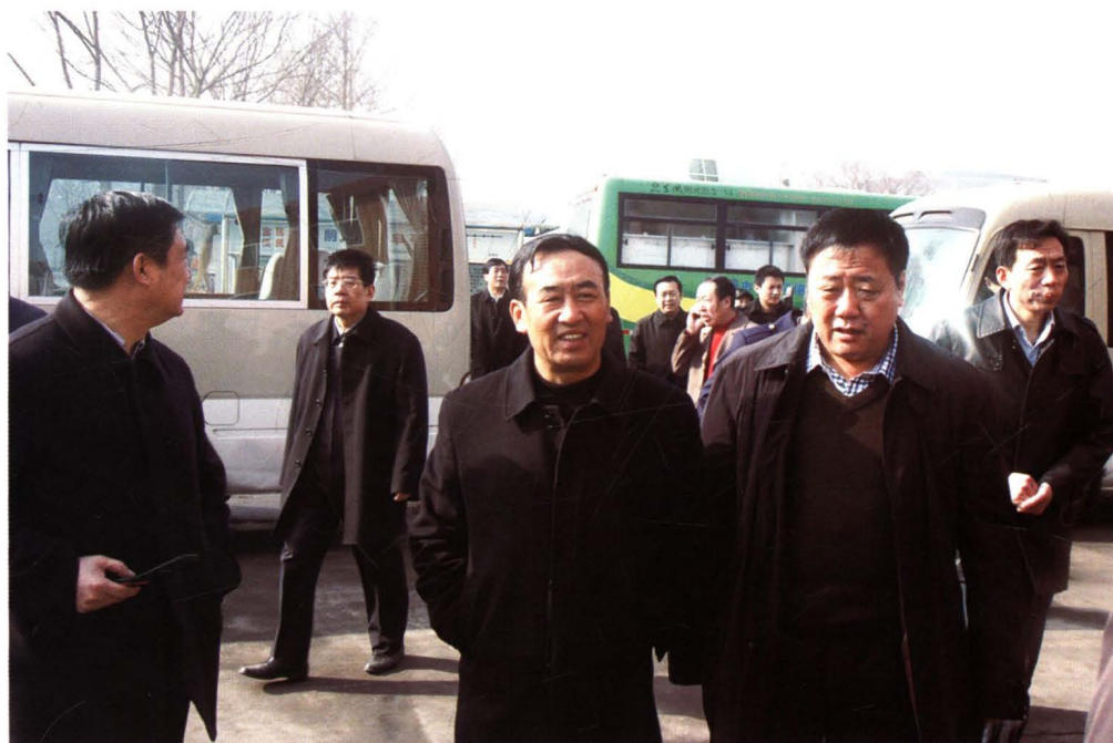
太原市副市长王建生莅临一一焦化厂调研