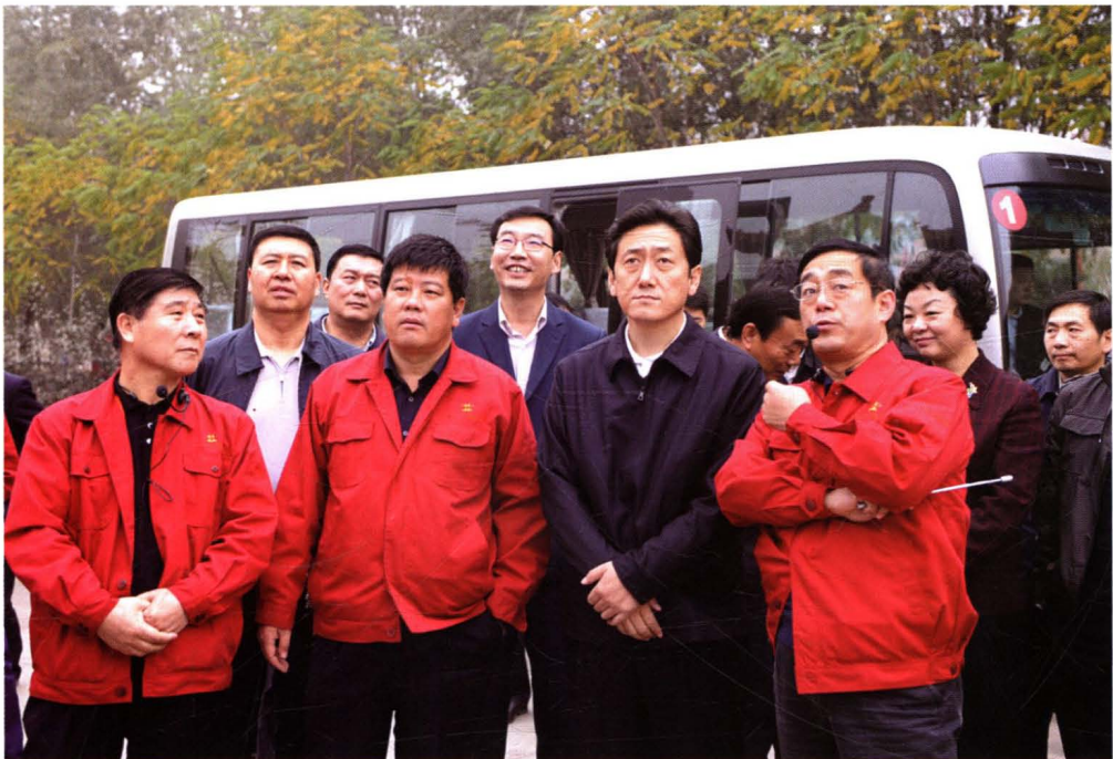
山西省委常委、太原市委书记陈川平莅临一一焦化厂调研