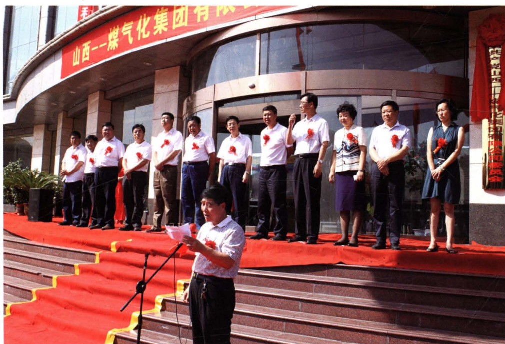
一一集团日月热电厂竣工典礼