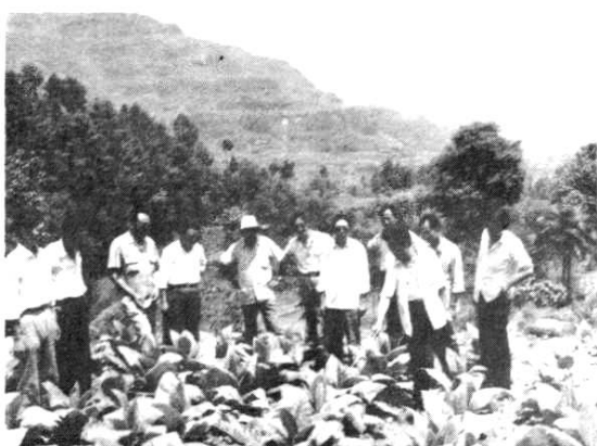
县级有关领导和各产烟区区长深入 白肋烟示范片参观指导