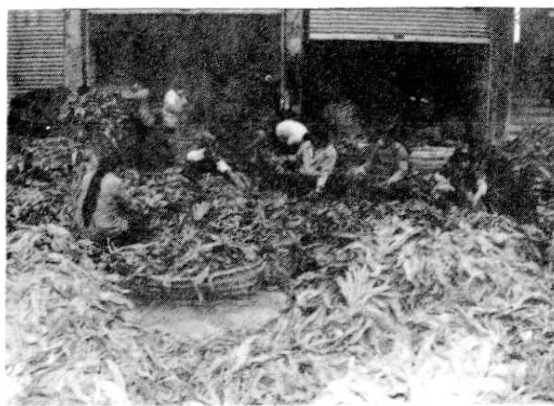
诺江镇选烟场一角