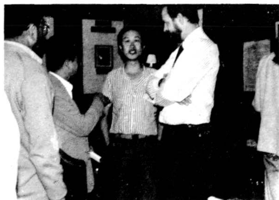
外商在国际展览会期中和达县地区 通江县烟草公司代表洽谈白肋烟业务