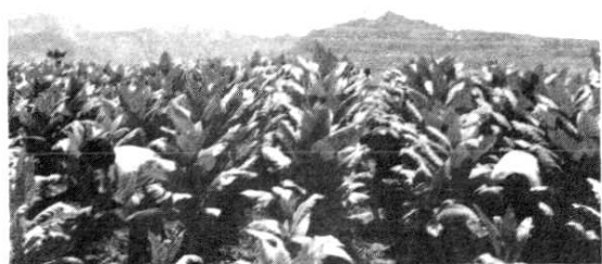
烟农正在采收成熟白肋烟