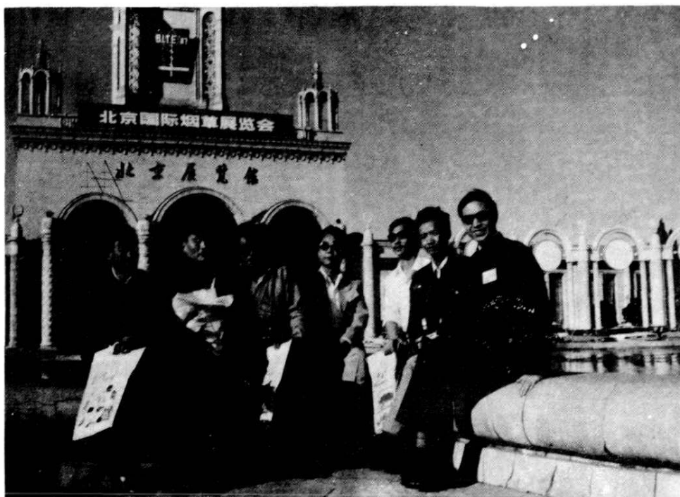
通江县代表参加国际烟叶展览会