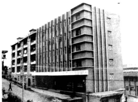
通江烟草公司办公楼