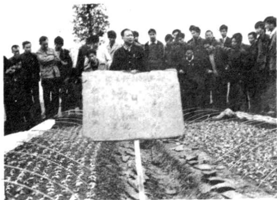
白肋烟营养钵假植现场会