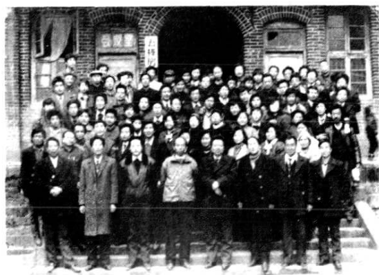
县级有关领导与烟草公司职工留影