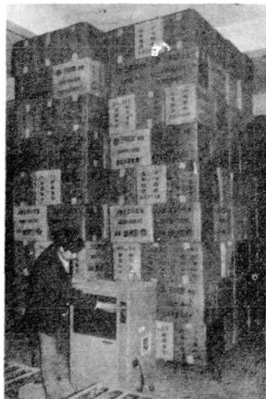
县卷烟集中库职工正在开机吸潮