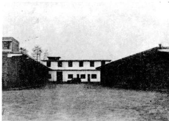
麻石区烟草经营站