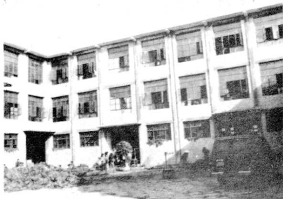
至诚区选烟场一角