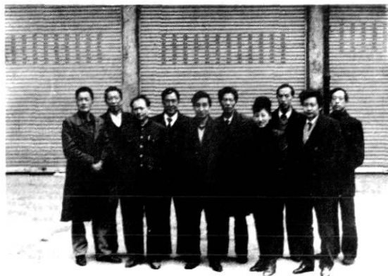
通江烟草志编纂领导小组成员