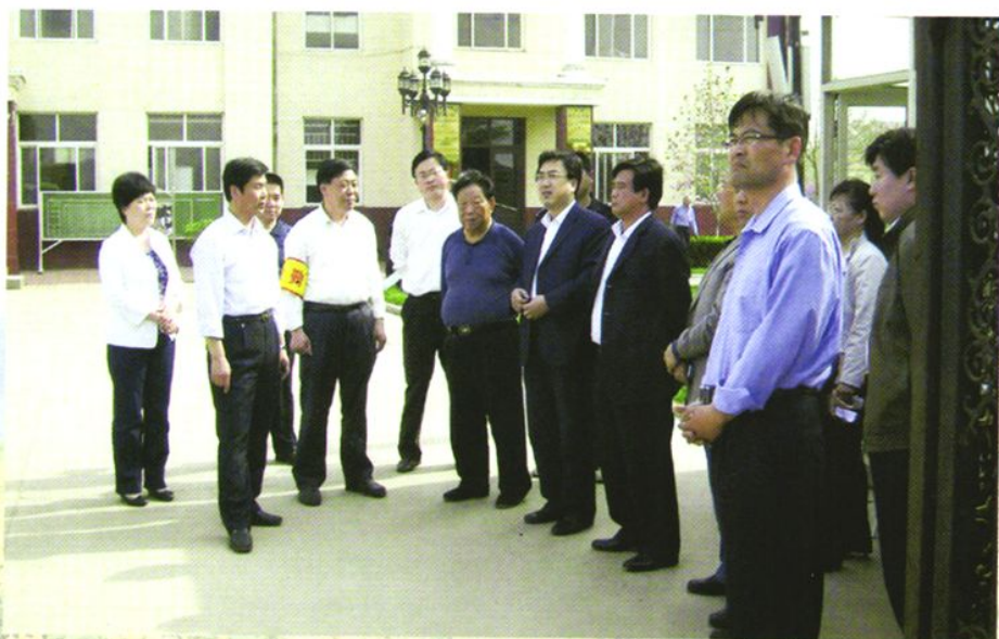
2010年5月，高密市委副书记、市长范福生（左七）来校视察