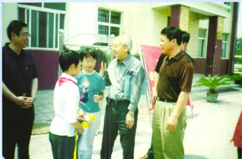
2004年6月9日， 美国旧金山学者在市委市 政府领导陪同下来校考察