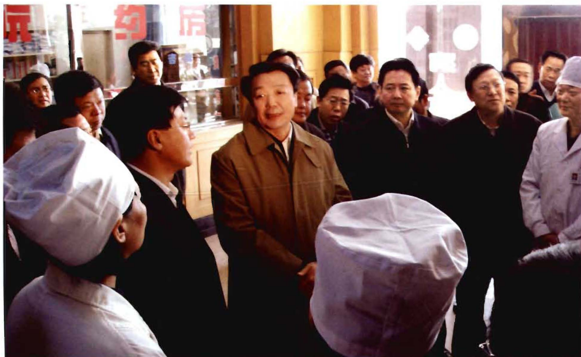
省委副书记、省长王君（中）、常务副省长李小鹏（右三）在高平市人民医院视察工作