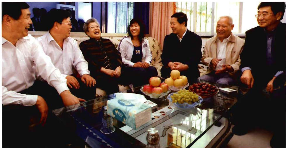
原国务院副总理吴仪（左三）在原省委书记张宝顺（右三）、原省长孟学农（右一）陪同下在东四义村民家中座谈。