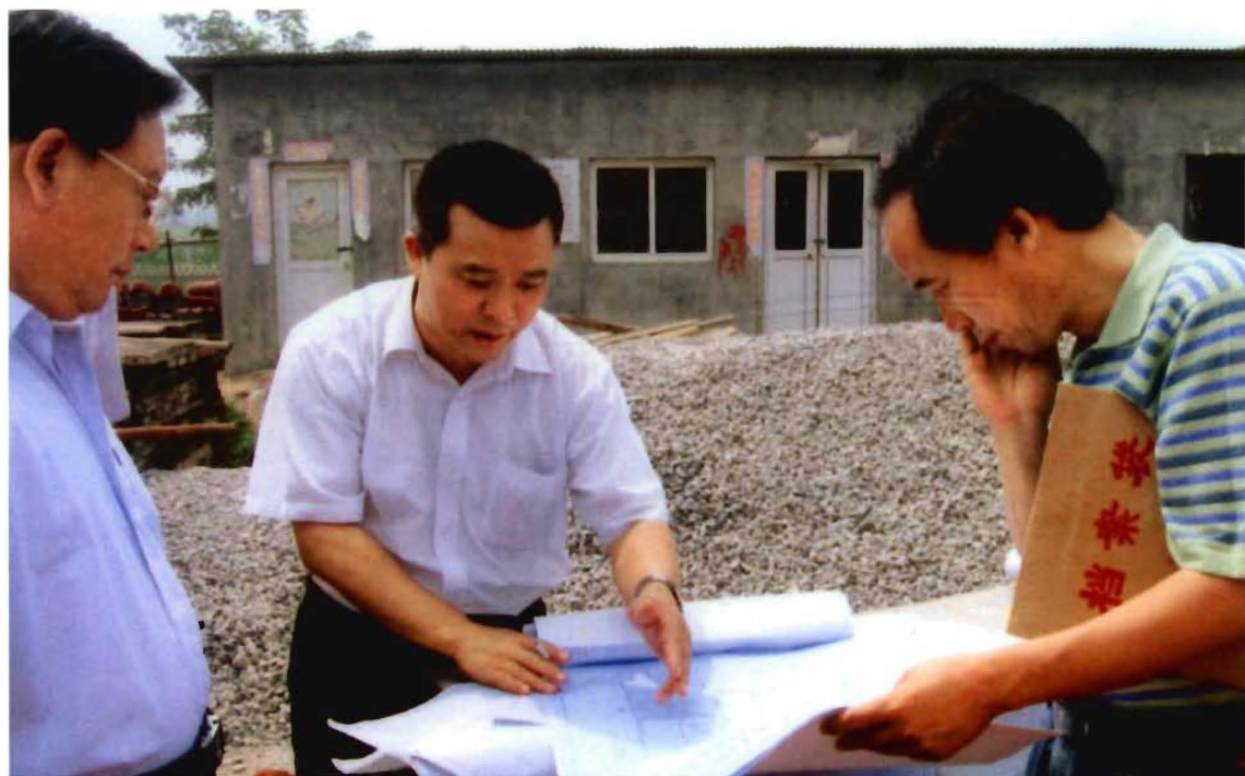
副市长李章宏（右一）在基层调研