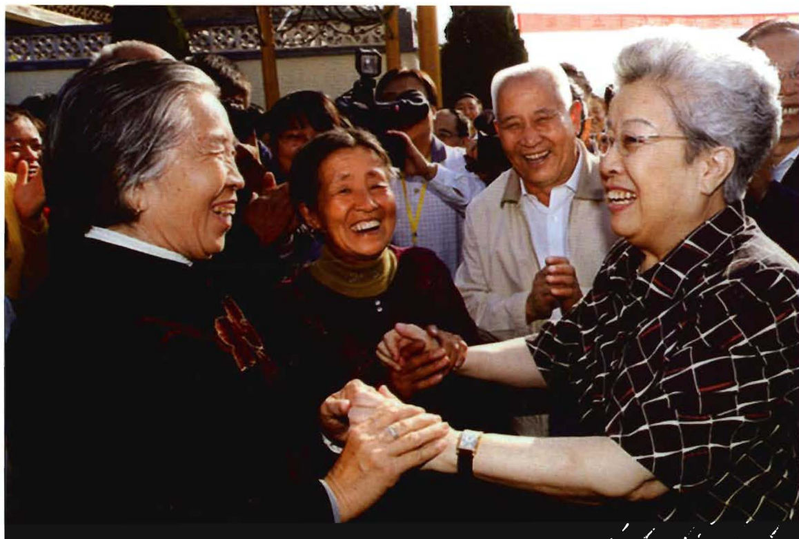
原国务院副总理、全国爱卫会主任吴仪在东四义村视察农村爱国卫生工作时与村民亲切交谈