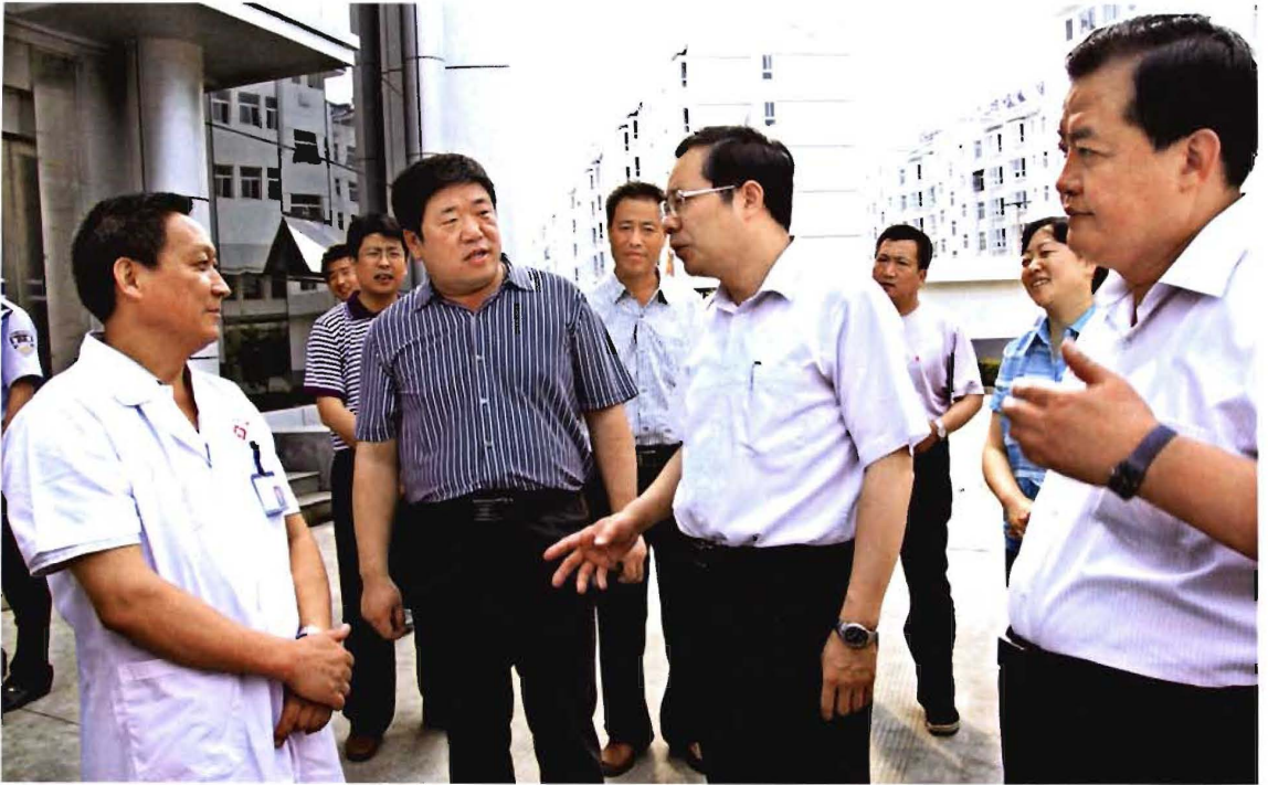
省委组织部长汤涛（右二）在晋城调研农村卫生工作