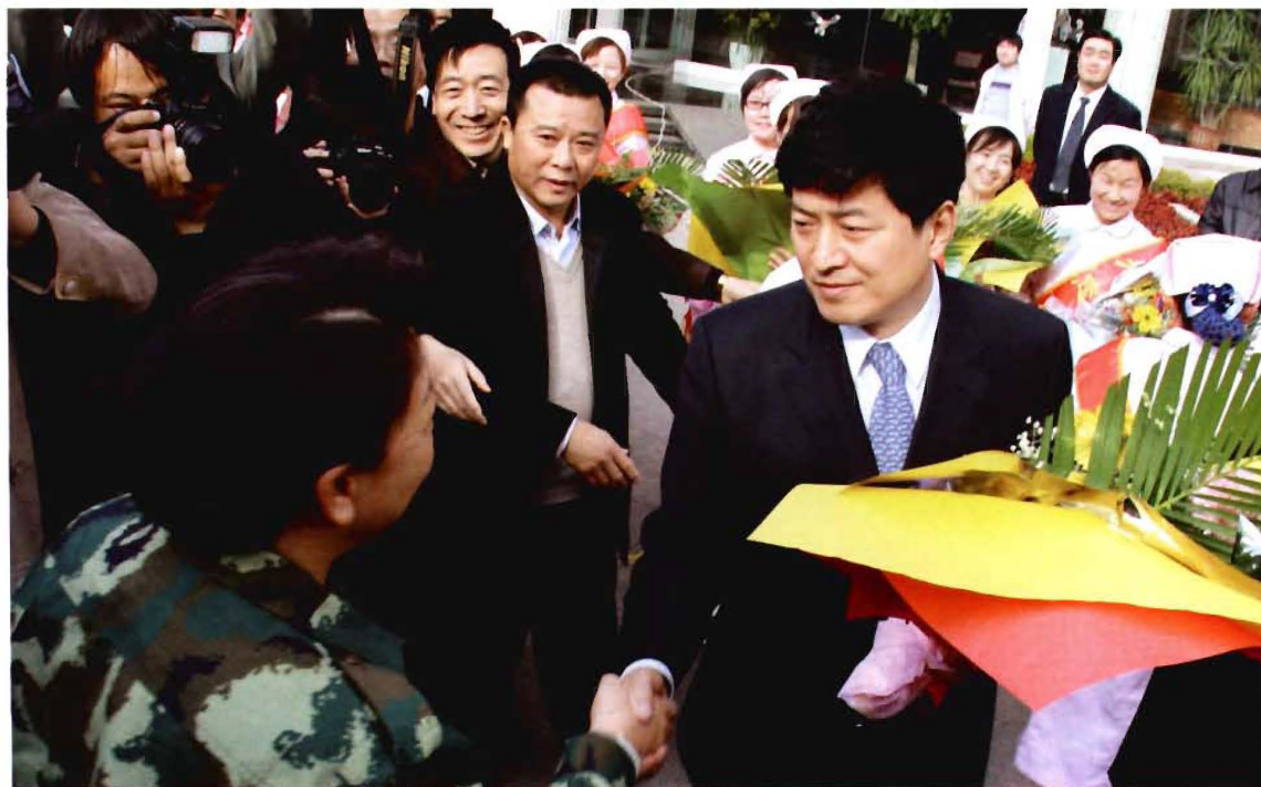
原市长王茂设亲切接见赴青海玉树抗震救灾队员凯旋