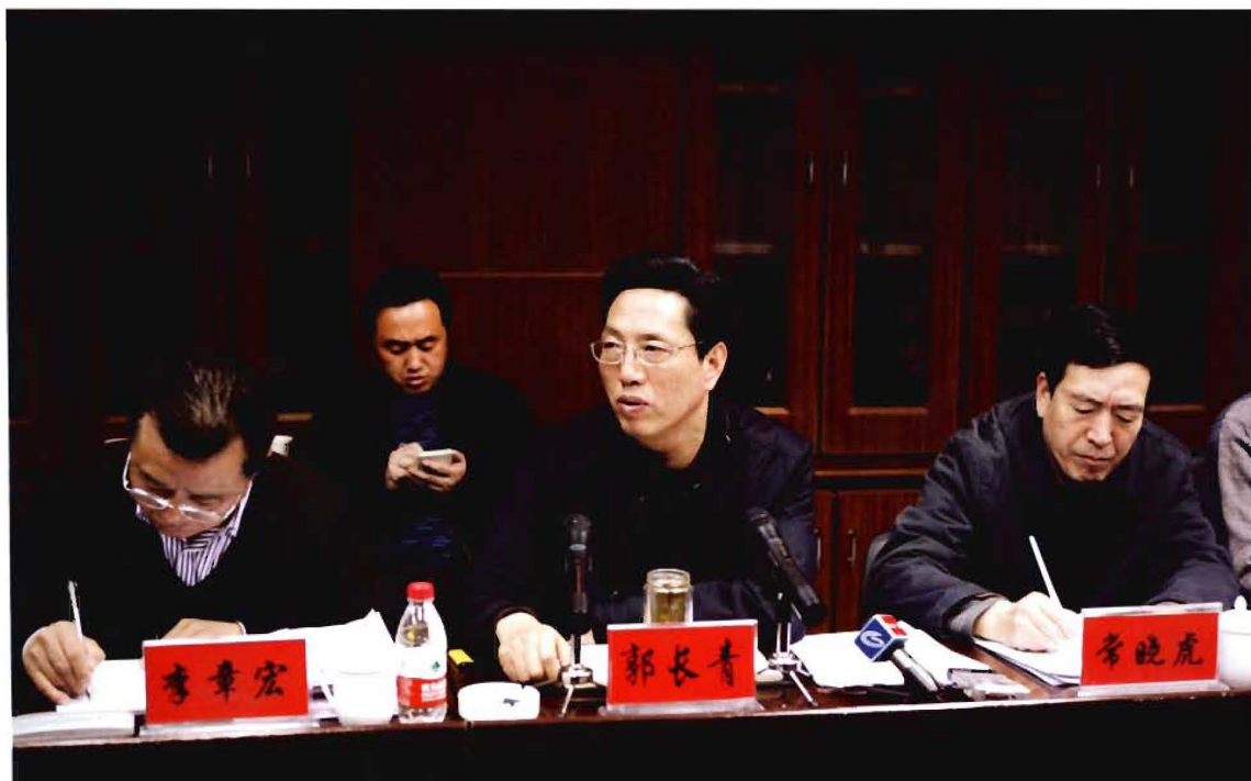
原常务副市长郭长青参加医改工作座谈会