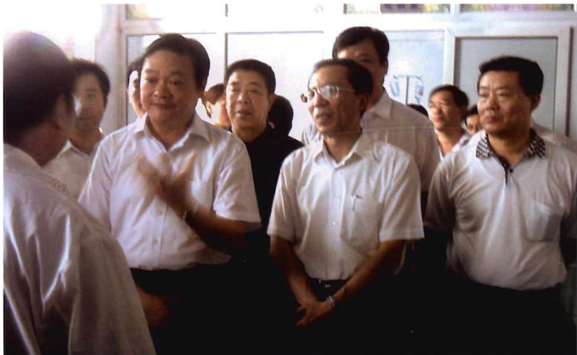
原省委副书记、省长于幼军（左一）在晋城视察卫生工作