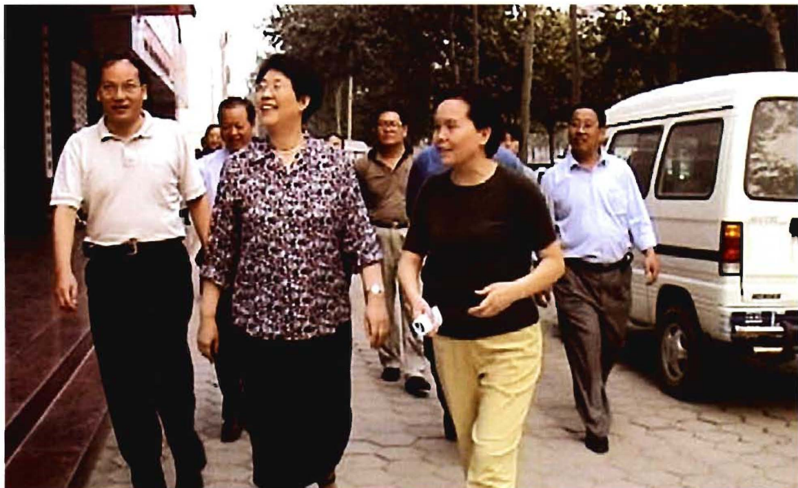
原副省长王昕（中）在晋城调研工作