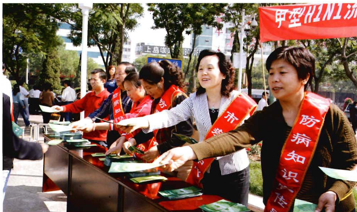
疾控中心人员在街头宣传防病知识