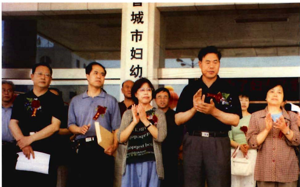
原市委副书记、纪委书记石正民（右二）参加市儿童医院揭牌仪式