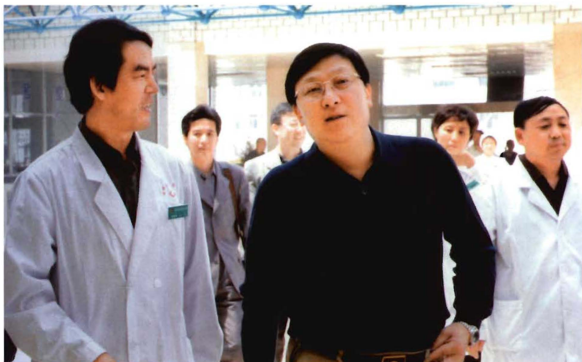
卫生厅副厅长王峻（左二）在晋煤集团总医院调研