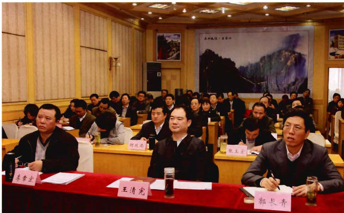
市长王清宪（中）参加全省医改工作视频会议