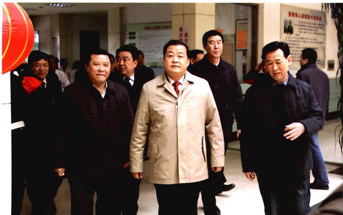
市委书记张茂才（中）春节看望一线医护人员