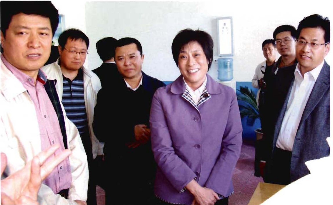
副省长张建欣（中）在晋城调研卫生工作