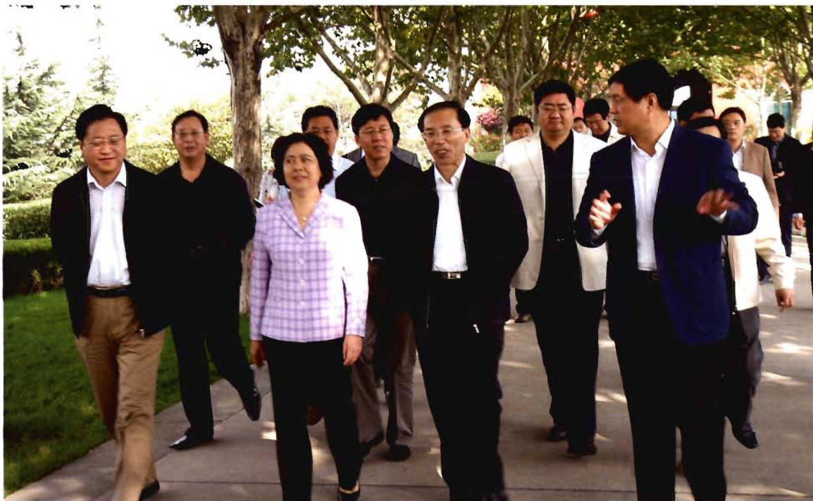
原副省长胡书平（左三）在东四义调研爱国卫生工作