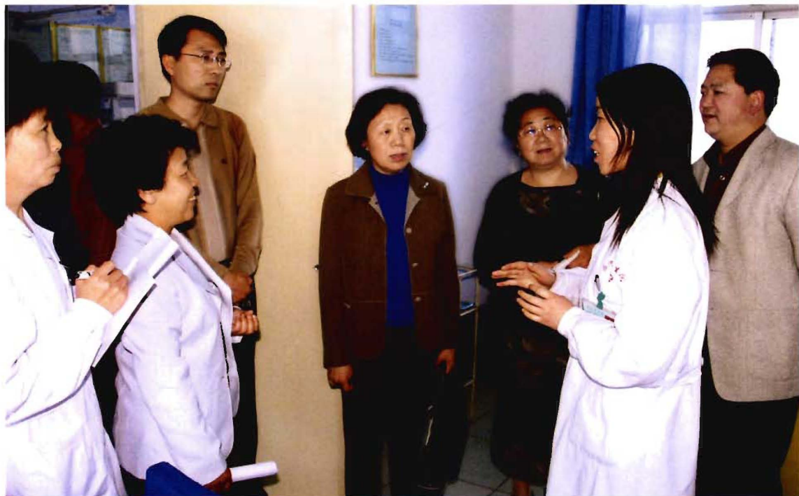
卫生部妇幼司张德英司长（中）在阳城指导妇幼保健工作