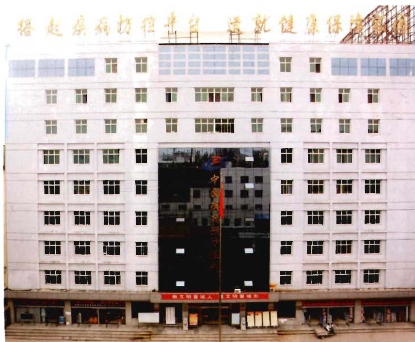
疾病预防控制中心大楼