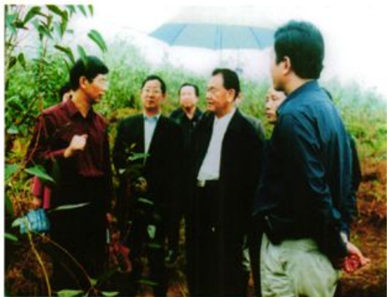
▲2002年10月，全国政协原副主席毛致用（右三）视察蓝山桉树基地。左一为县委书记刘事青，右一为县长张兆湘，右四为县政协主席黄楚政。