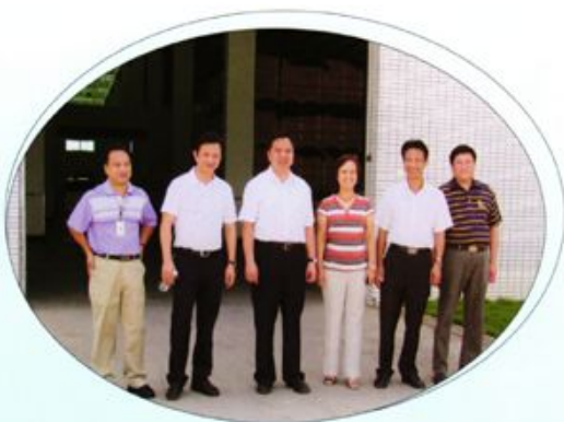
▲2009年7月23日，副省长陈肇雄（左三）在市委书记黄天锡（右二）陪同下到蓝山调研。左二为县委书记魏湘江，右一为县长严兴德。