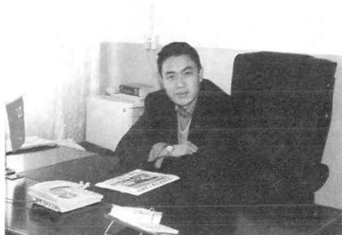
中共温泉县委员会书记 刘自重