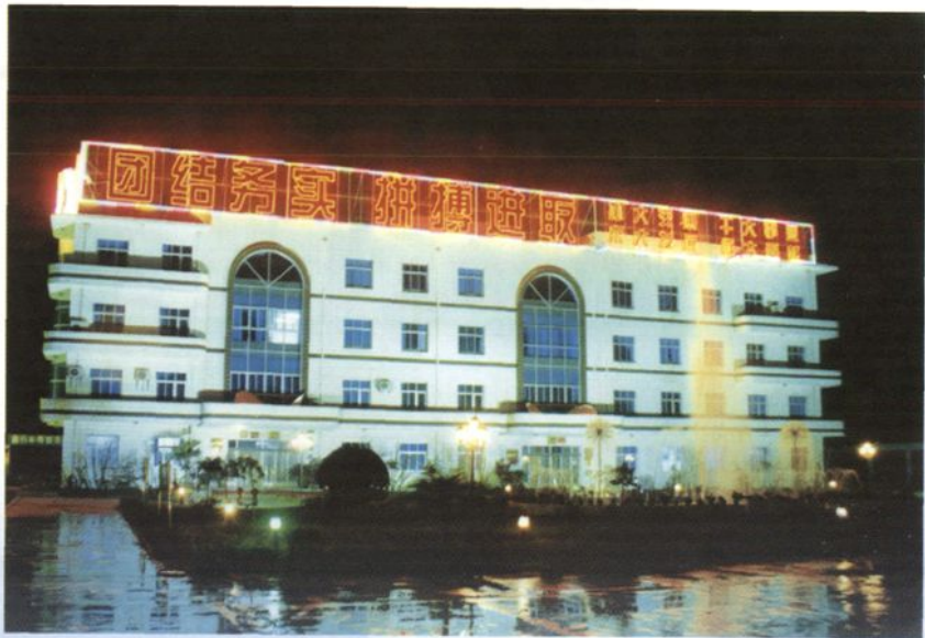
1998 年交通局、公 路站办公楼