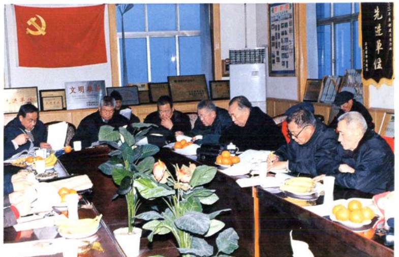
县交通局邀请老干部 召开座谈会,征求对交通 工作的意见和建议