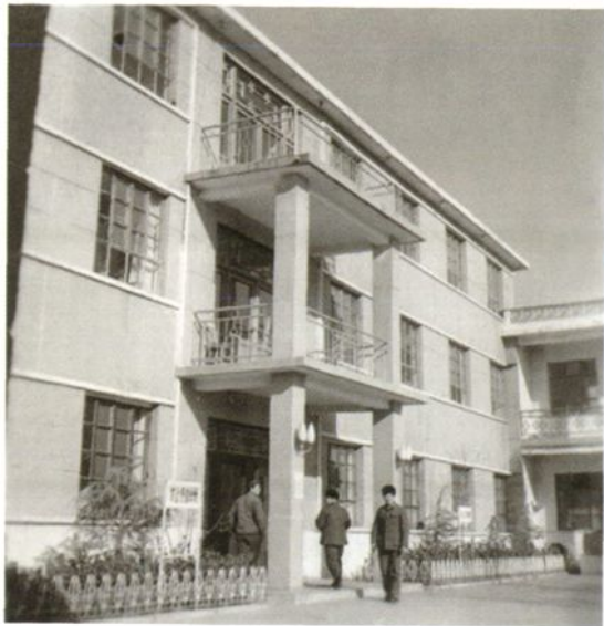
1996 年交通局 办公楼