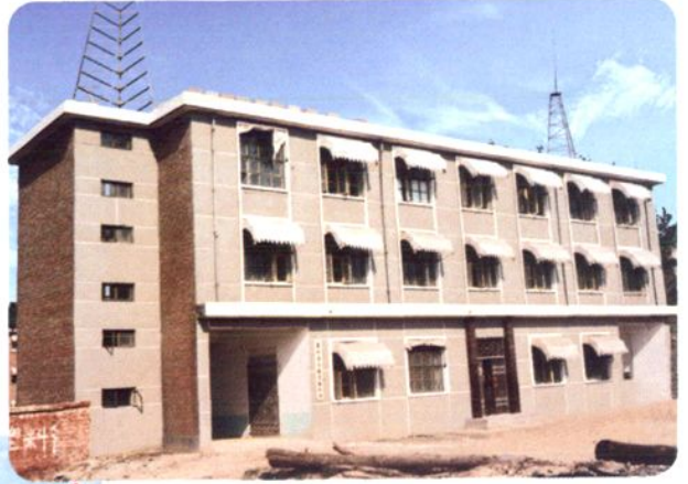
1996年前运输 管理站、养路费稽征 站办公楼