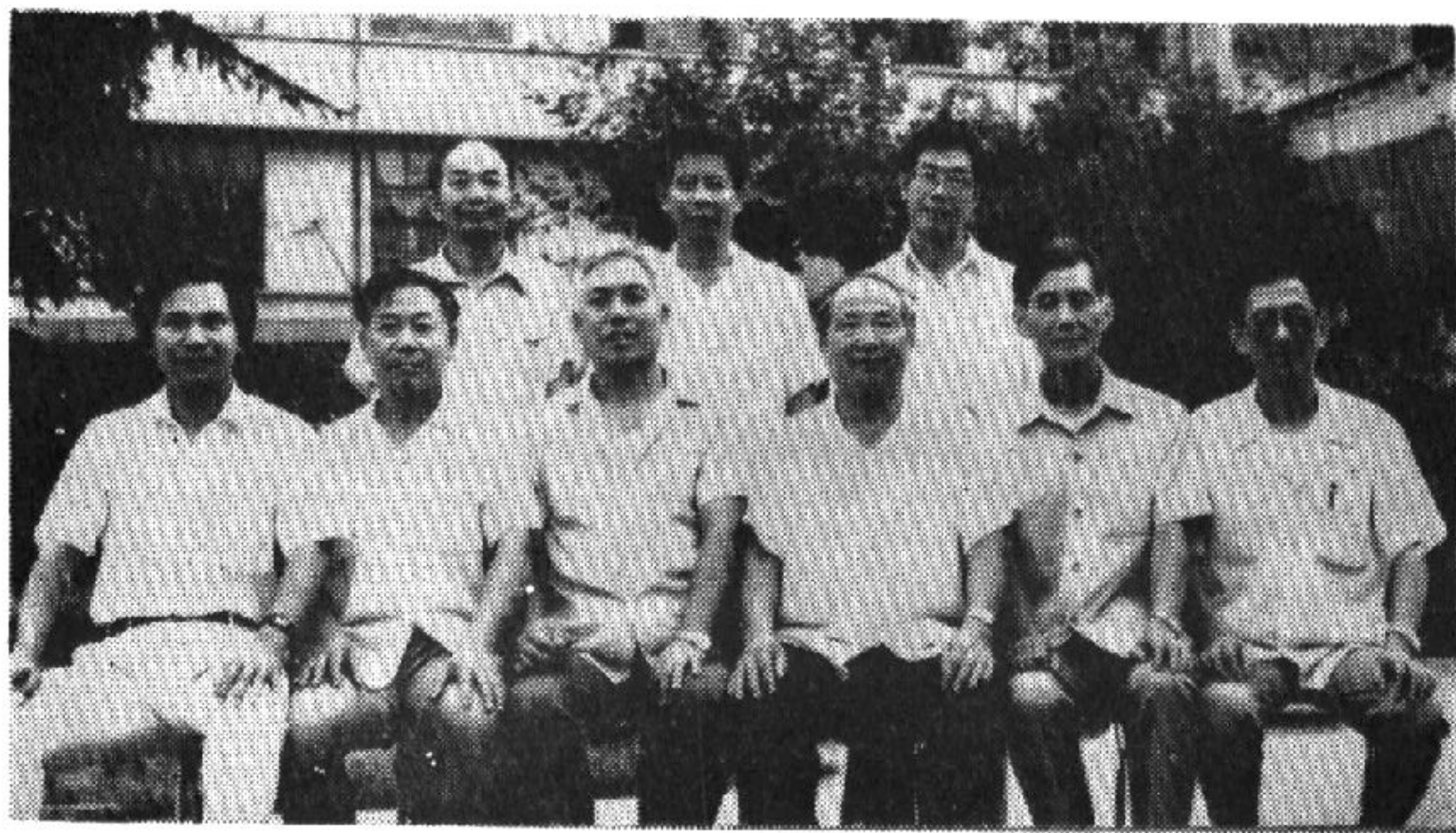
东阳市政协第七届委员会主席、秘书长合影（从左至右）