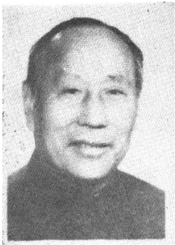
第一、二届政协主席 张利一