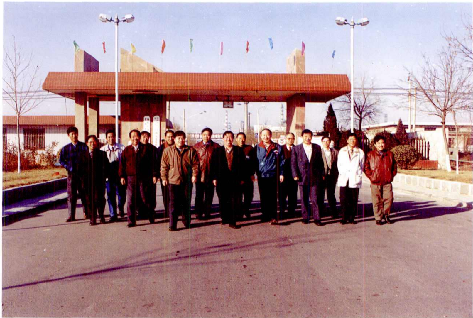
意气风发的总厂党政领导班子