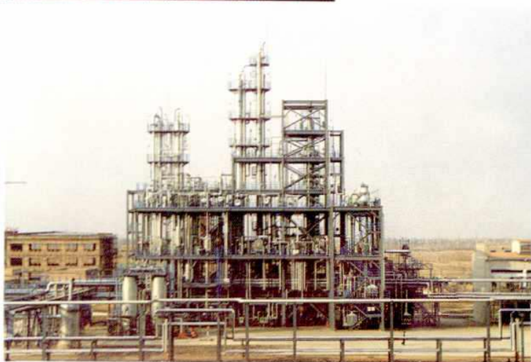
1, 4 - 丁二醇装置