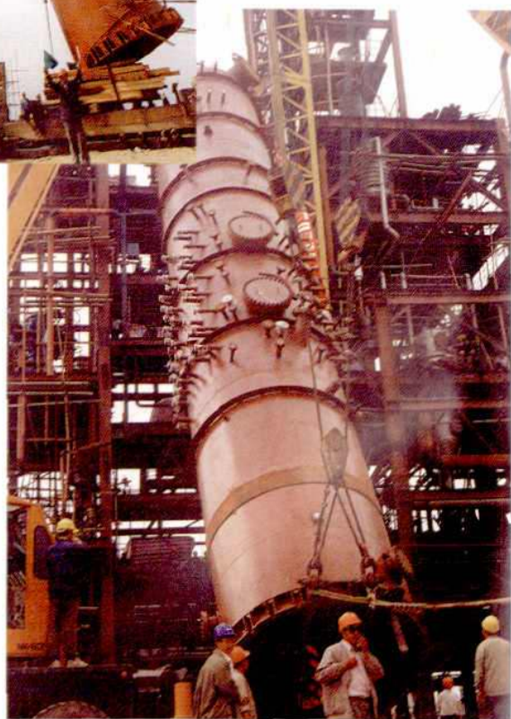
1995年6月，我国制造的第一台顺酐流化床反应器在顺酐车间吊装成功