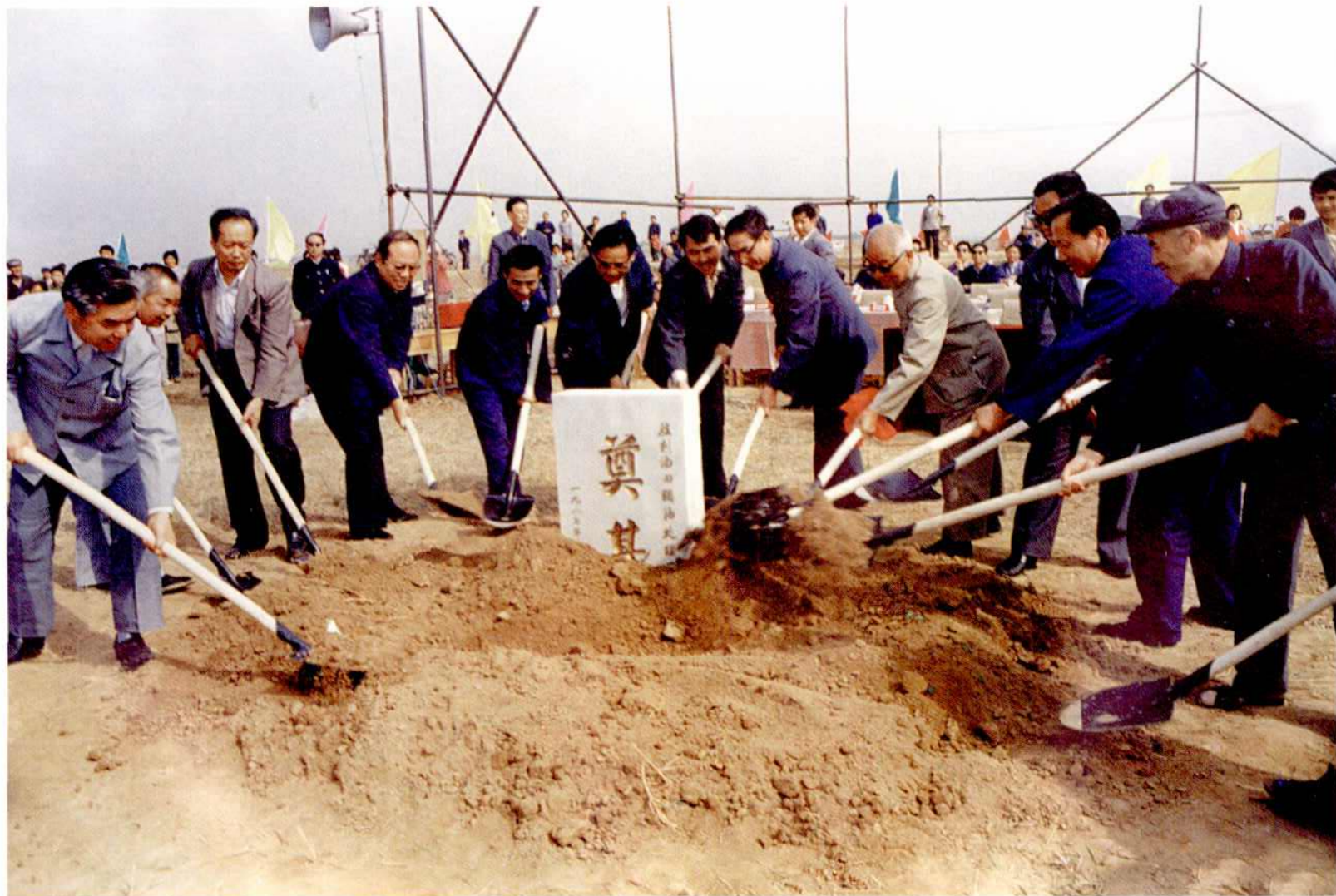
1987年5月20日，中纪委驻石油部纪检组组长黄凯（右4），石油部副部长、胜利油田指挥李敬（左2），山东省副省长、胜利油田党委书记李晔（左5）等领导为稠油处理厂开工奠基