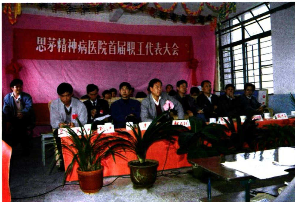
1994年12月6日我院召开首届职工代表大会