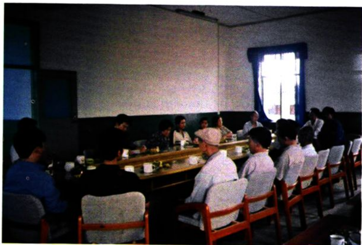
与离、退休老同志和复、退转同志座谈