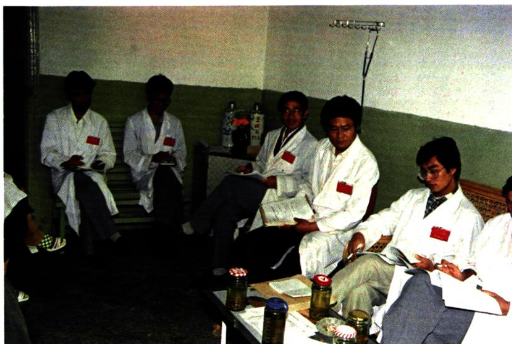
职代会代表分组讨论