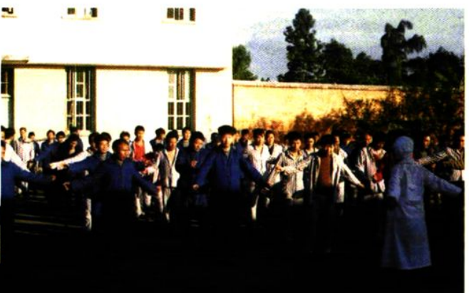
病人排队做健身操