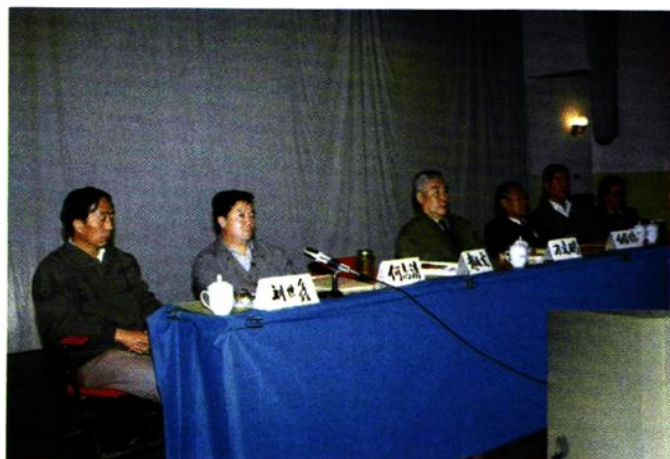
我院承办的云南省第二届心理卫生协会暨学术交流会主席台。