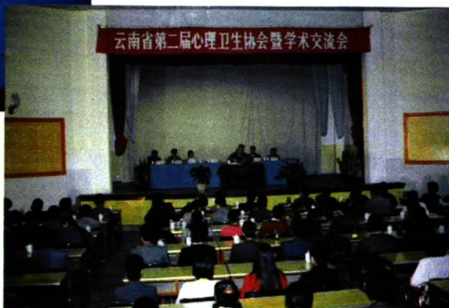
第二届心理卫生协会暨学术交流会在我院召开，图为大会会场。