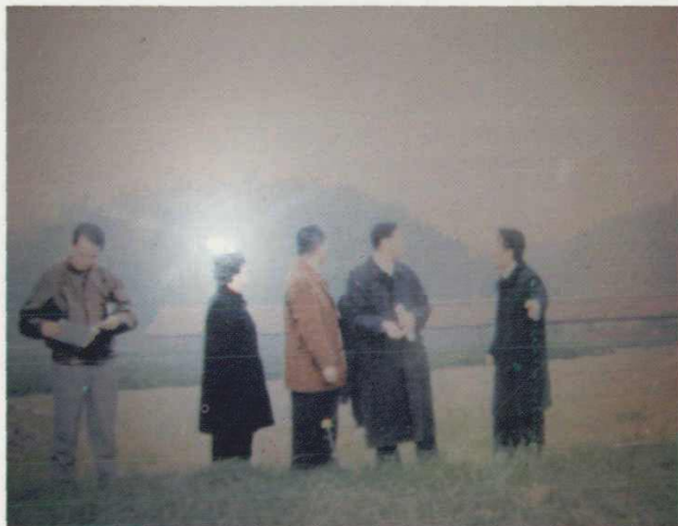
2001年12月中央农业部副部长韩长赋 到象山检查“三个代表”学教活动