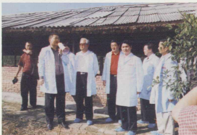
2004年5月26日中央科协党组书记张玉台到象山指导工作