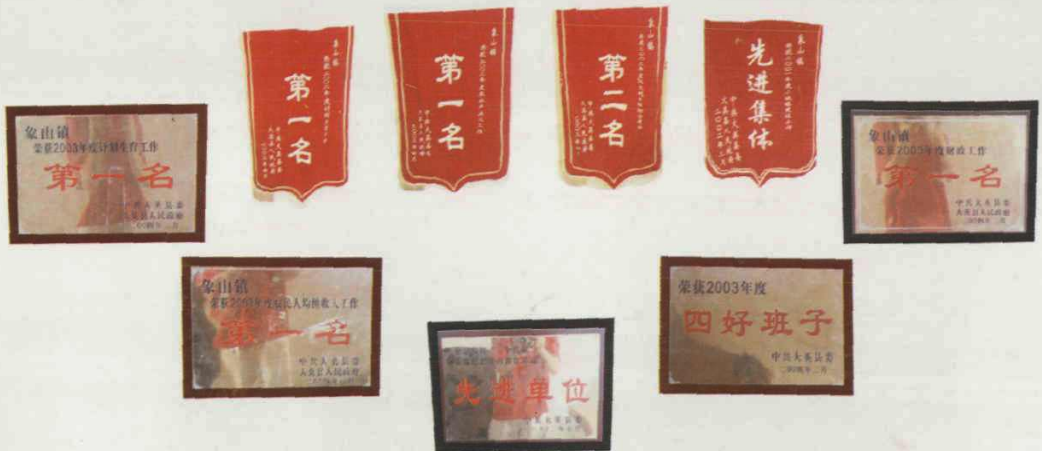
象山镇各级工作多次获上级奖励