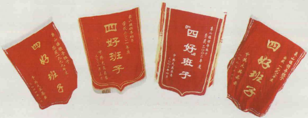
象山镇党政班子多次荣获 “四好班子”称号