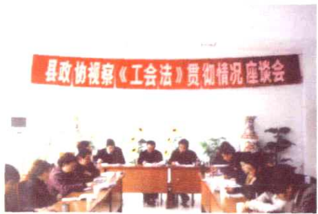
县政协视察《工会法》贯彻情况