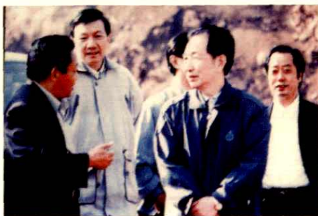
原省政协主席聂荣贵[右一]在市政协主席汤群祥[左二]、县委书记蒲昭雄、县委副书记、县政协主席李光前的陪同下视察县城新区建设