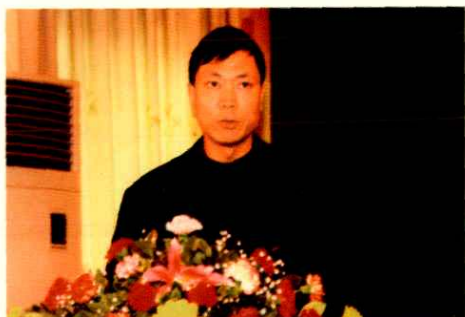
第四任中共大英县委书记郑和平在政协会上作重要讲话