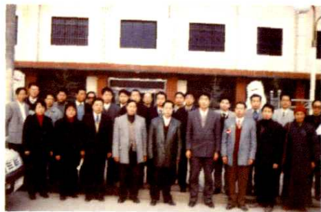
第一届县政协全体常委合影