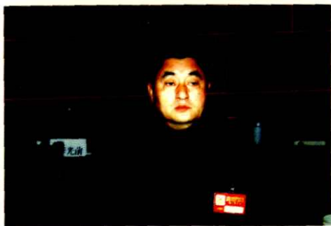
第三任中共大英县委书记刘苏民在政协会上作重要讲话