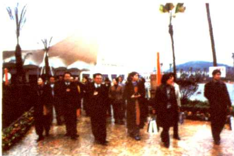
政协委员视察中国死海