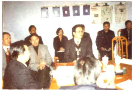
原县委书记侯晓春听取政协委员讨论