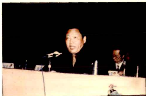
第一任中共大英县委书记蒲昭雄在一届一次会议上作重要讲话