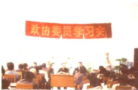
县城政协委员学习会