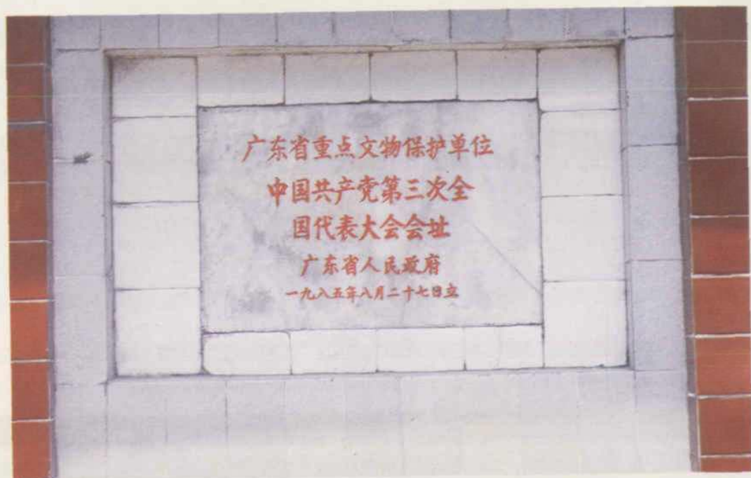
中国共产党第三次全国代表大会会址 (现为恤孤院路3号)