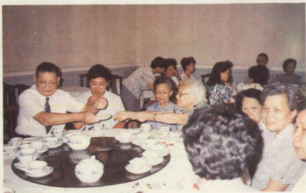
与归侨、侨眷共度佳节