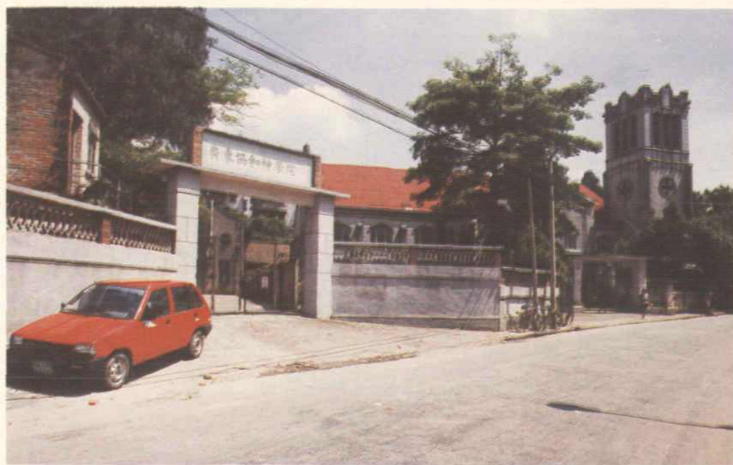
基督教东山堂右侧的广东协和神学院