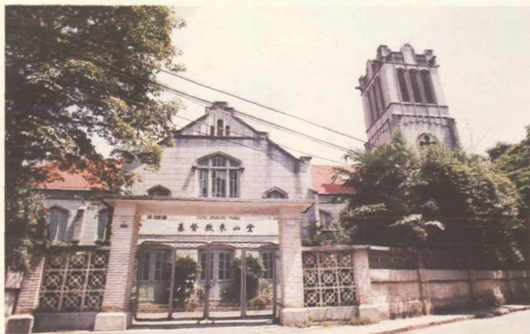
华南规模最大的基督教东山堂 ——寺贝通津9号