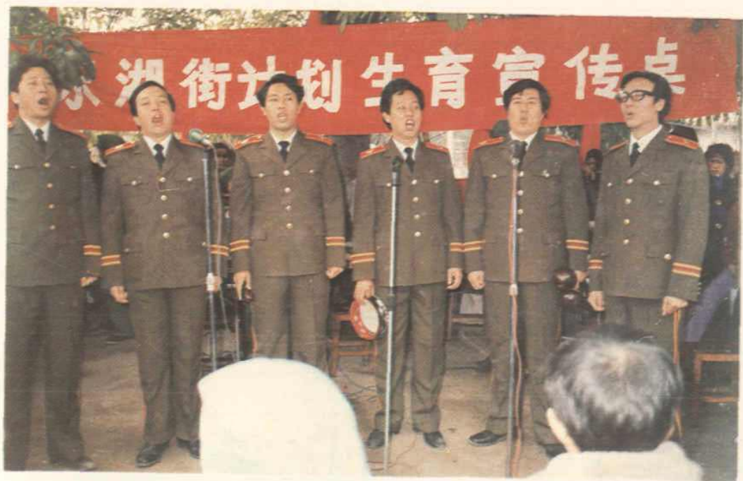
军民联手宣传计划生育