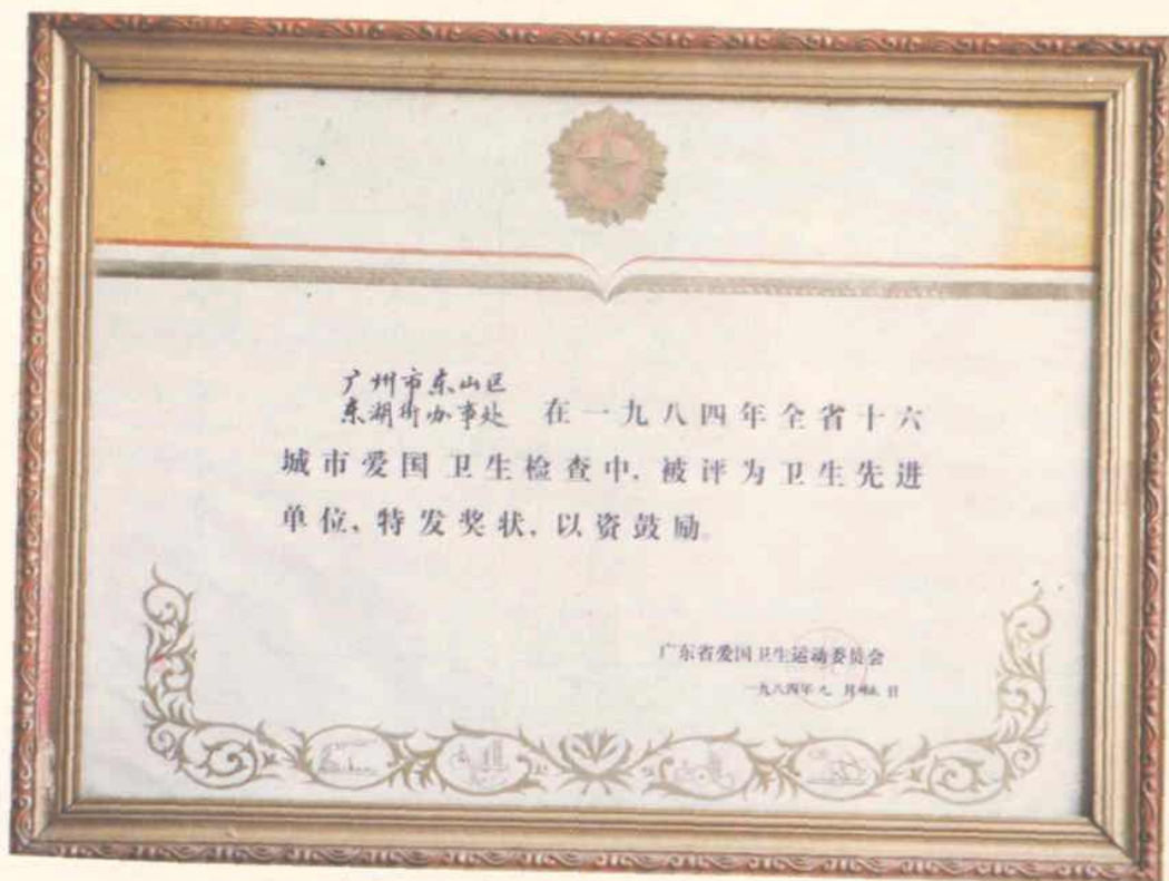
东湖街光荣历程中的点滴(之一)