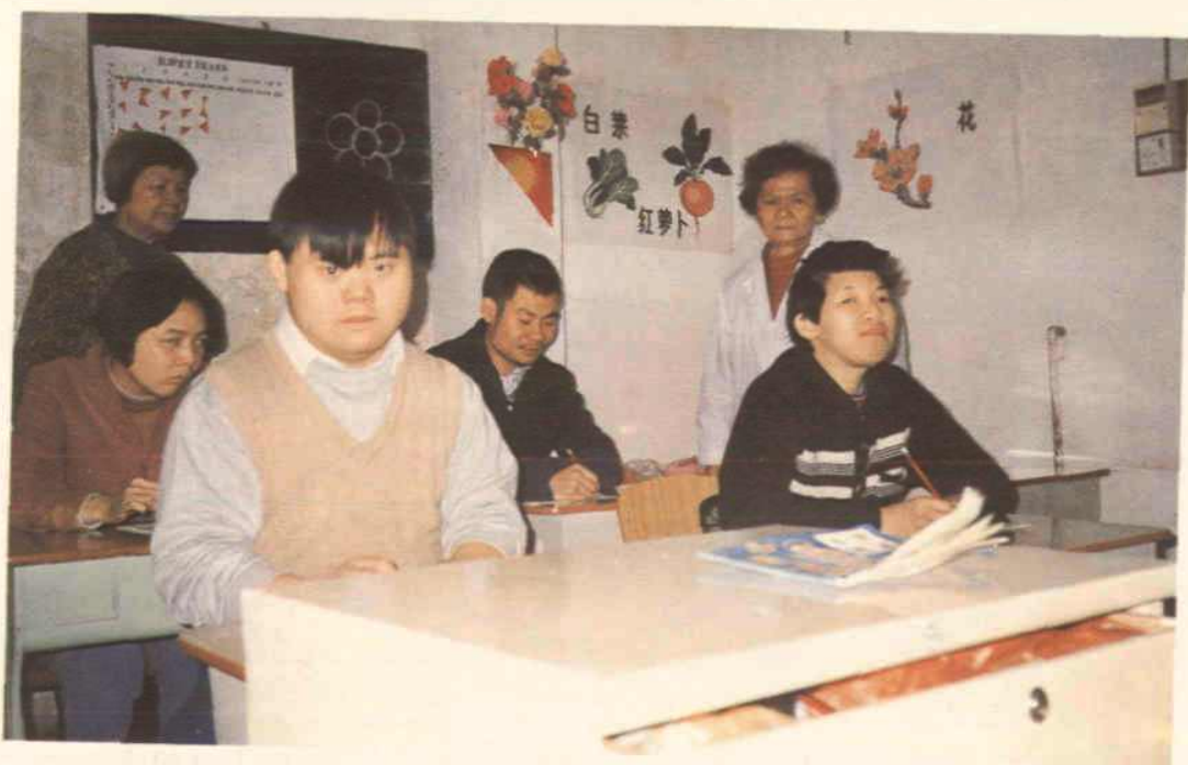
弱智青少年在街办工疗站学习