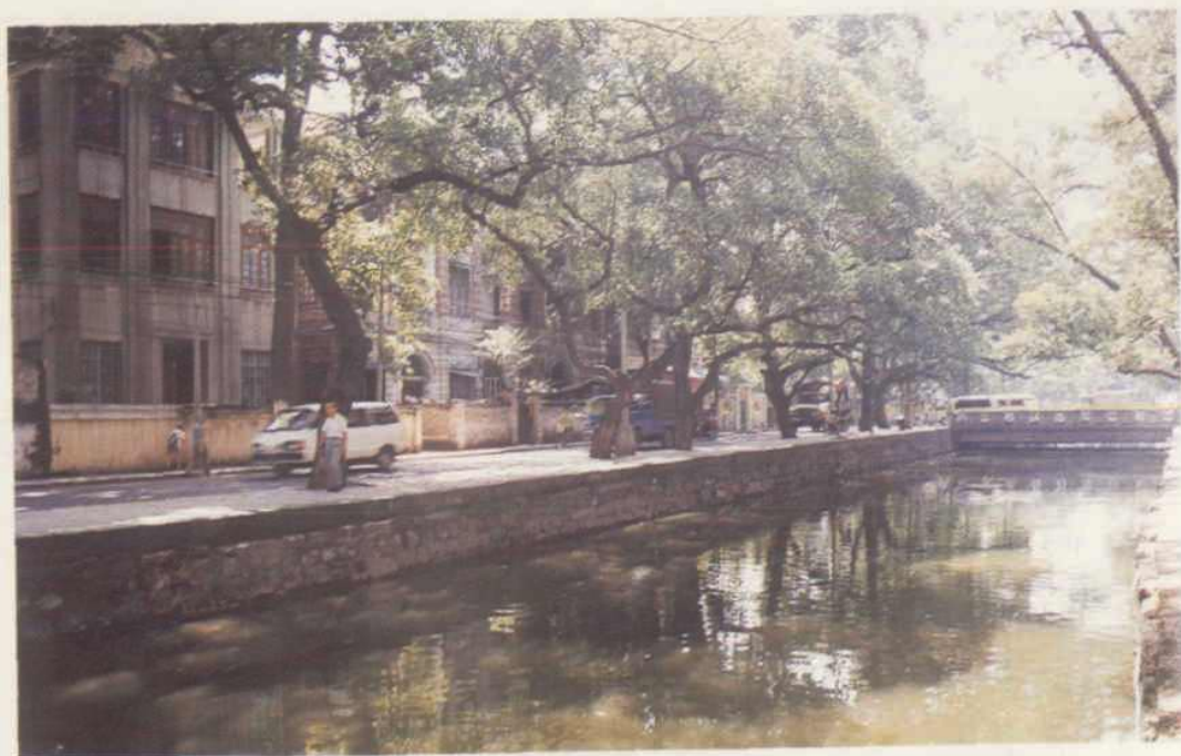
中国共产党第三次全国代表大会前后党代表 活动中心——新河浦春园