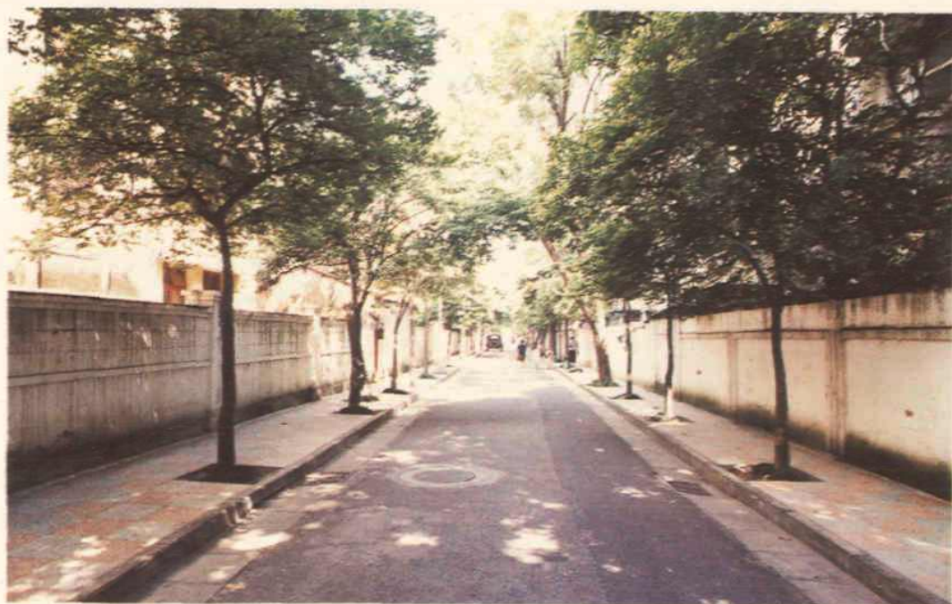
果树成荫的合群二马路