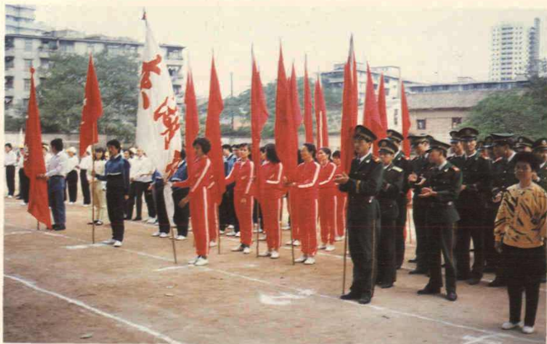
每年一次的东湖地区运动会