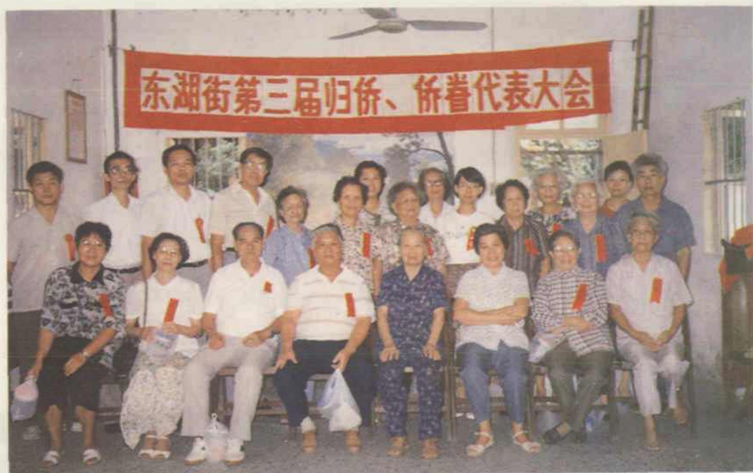
归侨、侨眷代表与区、街侨务工作人员合影