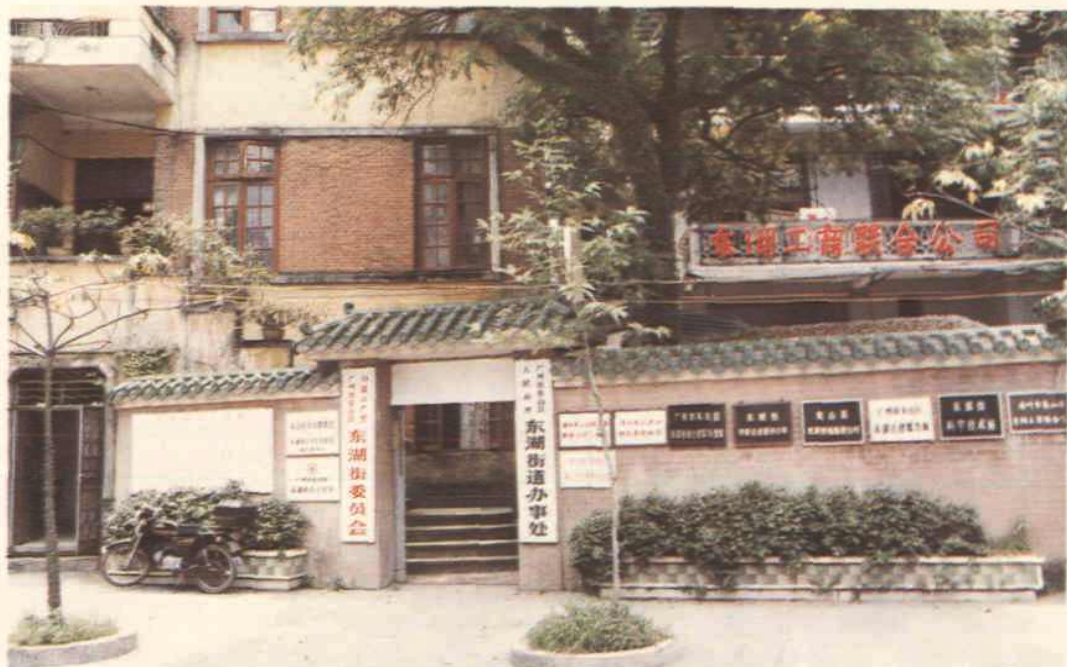
座落于恤孤院路 32 号的东湖街道办事处