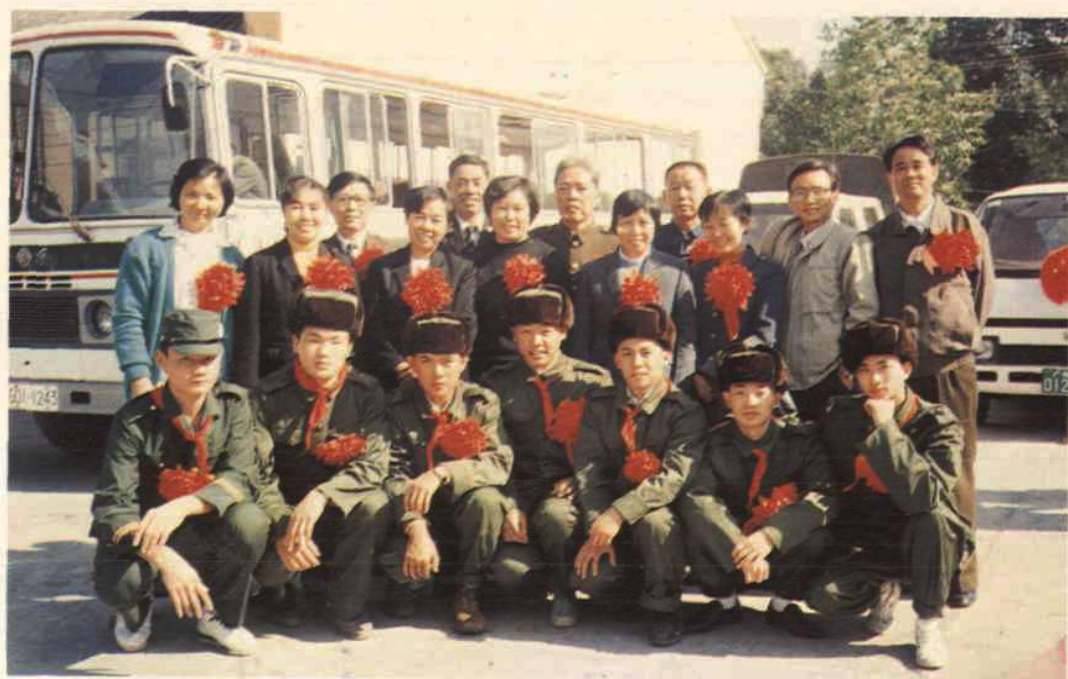
输送优秀子弟参军