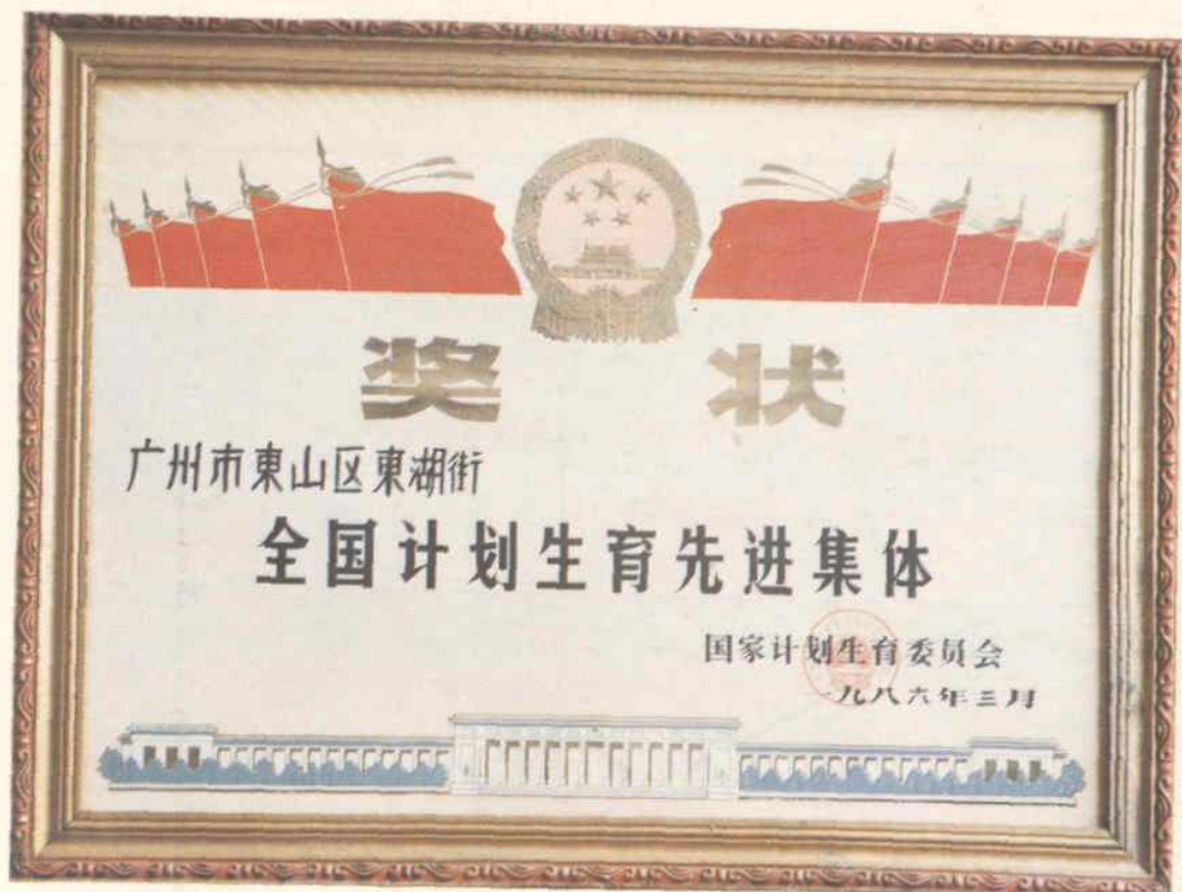
东湖街光荣历程中的点滴(之二)