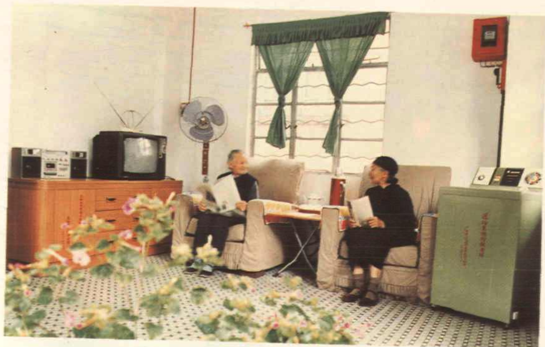
东湖街敬老楼一角