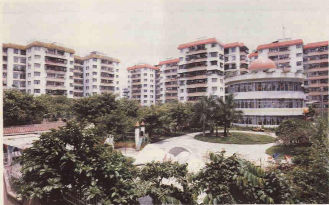
五羊邨居民住宅区一角