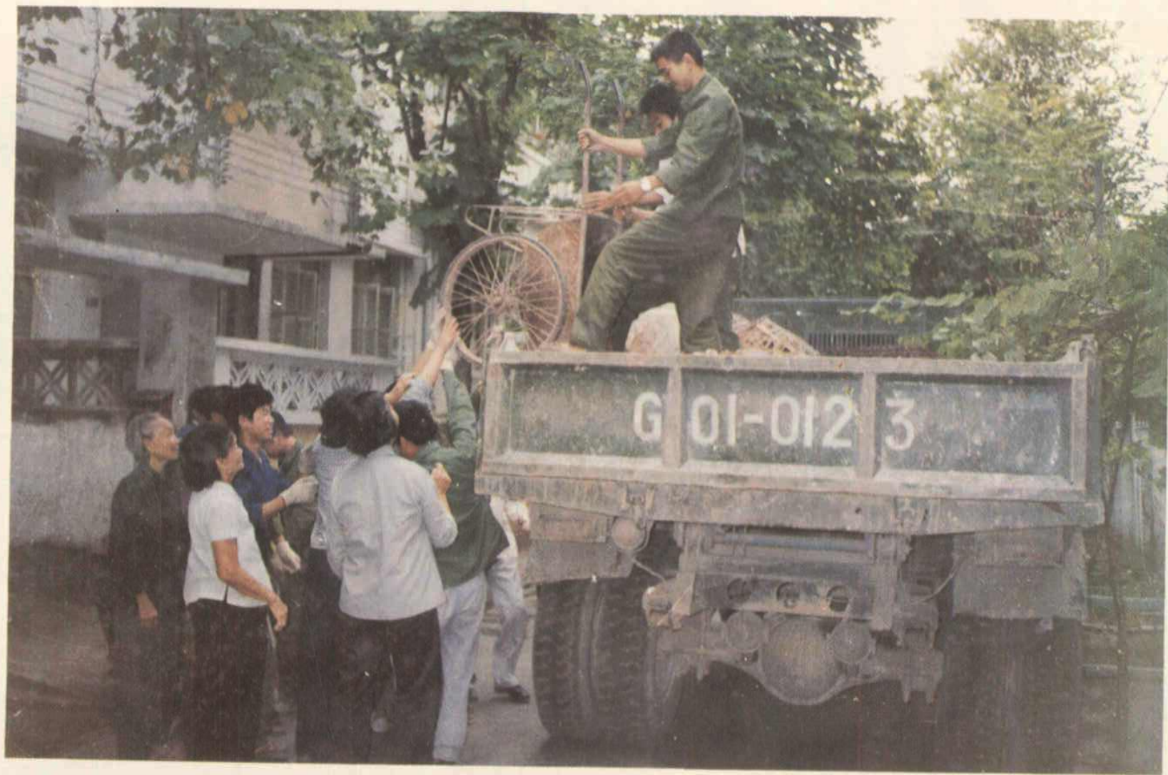
军民联手共建卫生环境