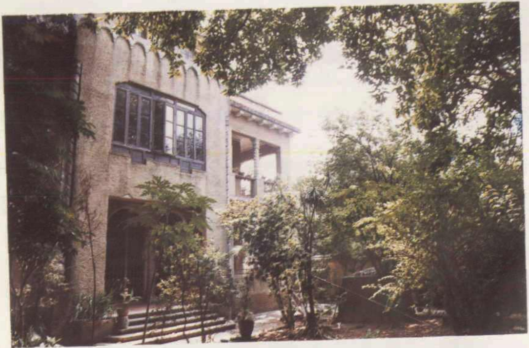
建于二十年代的培正路1号桥宅