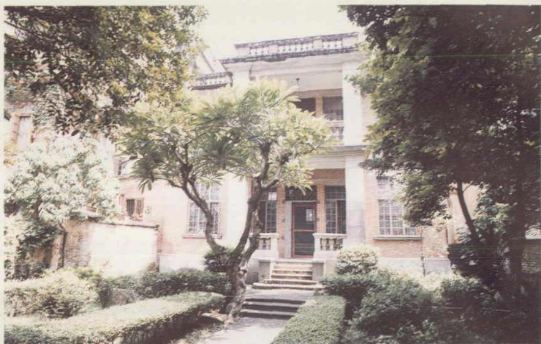
建于二十年代初的保安前街 32 号侨宅