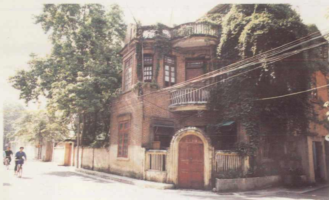
建于二十年代初的美华北 5 号侨宅