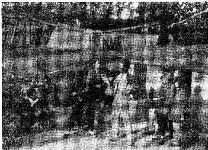
图六 山东解放区演出动员参军的话剧《过关》

扰破坏，斗争是激烈曲折的，但光辉的伟大的马克思列宁主义文献《讲话》始终象屹立的灯塔一样，指引着革命文艺工作者坚定不移地前进。革命文艺工作者努力实践毛主席的无产阶级革命文艺路线，在伟大的民族解放和人民解放事业中，在巩固无产阶级专政的斗争中建立了许多战功。当前，在全国正深入开展批修整风，“进行一次思想和政治路线方面的教育”的重要时刻，纪念《讲话》发表三十周年，重新学习这部光辉的著作，以《讲话》为武器彻底批判刘少奇一类骗子的反马克思列宁主义路线和政策，必将使广大的知识分子，特别是文艺工作者，大大增强识别真假马克思主义的能力，提高改造世界