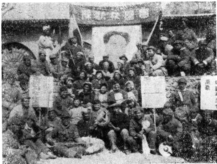
图三 延安枣园秧歌队