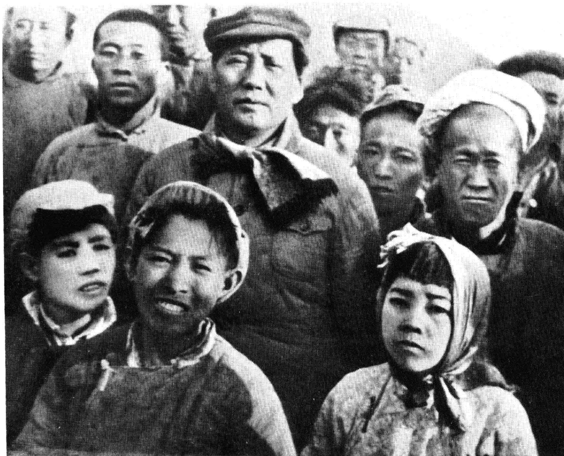
毛主席和秧歌队员在一起（1943年春节）