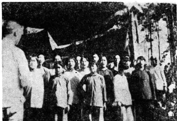
图五 解放区农村开展文艺宣传活动 ——妇女歌咏队

的心声，很快就在佳县附近流传开了。1944年初，音乐工作者深入农村后，听到群众唱这支歌，就把它记录下来，并增添第二、第三段歌词，于是《东方红》就唱遍了解放区，响彻了全中国。