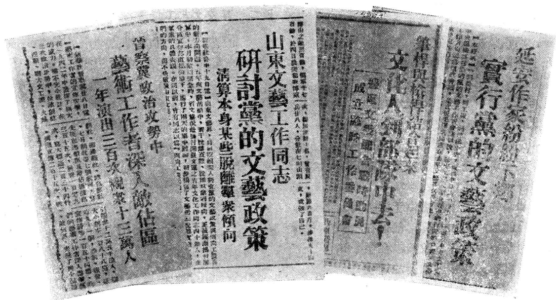
图一 《讲话》发表后，延安《解放日报》发表的革命文艺工作者深入工农兵的一部分报导

延安文艺座谈会以后，毛主席于1942年10月为延安平剧研究院成立写了“推陈出新”的题词。1944年1月9日，毛主席看了《逼上梁山》以后，给平剧院写信，对他们演出的成功给予极大的鼓励，在信中说：“历史是人民创造的，但在旧戏舞台上（在一切离开人民的旧文学旧艺术上）人民却成了渣滓，由老爷太太少爷小姐们统治着舞台，这种历史的颠倒，现在由你们再颠倒过来，恢复了历史的面目，从此旧剧开了新生面，所以值得庆贺。”“希望你们多编多演，蔚成风气，推向全国去！”1944年10月毛主席在陕甘宁边区文教工作者会议上又作了十分重要的指示。毛主席的革命文艺思想，照亮