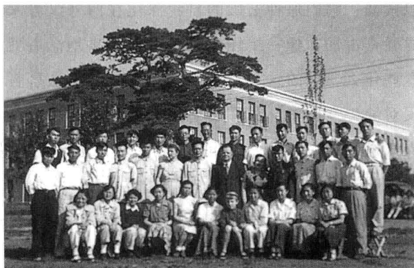
▲ 1956年人民大学哲学研究班合影，二排右四为作者。“两棵松树如盖，三层灰楼新建”，与现今校园无法相比。人民大学老人对原来两棵如盖松树仍怀思念。

果马克思主义哲学原理没有自己的历史，没有经历创立、发展、成熟的过程，也不可能有科学的马克思主义哲学原理的出现。其实，马克思主义哲学史就是马克思主义哲学原理，不过是以历史形态出现的原理，即处于形成过程中的原理；而马克思主义哲学的每一个范畴和原理，都不是一次完成的，都包含着自己的历史。在我自己对马克思主义哲学史的研究中，我深感熟知马克思主义哲学原理的重要性。如果不是在此之前，对马克思主义哲学原理和经典著作稍微用过一点儿力，连眼前这一点小小的成绩都很难达到。