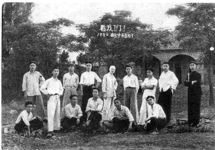
▲ 1950年中学毕业时摄于学校门口，后排右三为作者。“江南三月花似锦，小城夜半米酒甜”，中学时代的情景至老难忘。

直生活至今。杂花生树、群莺乱飞的江南三月风光，时常勾起思乡之情，但我已习惯了北方的风沙和严寒。