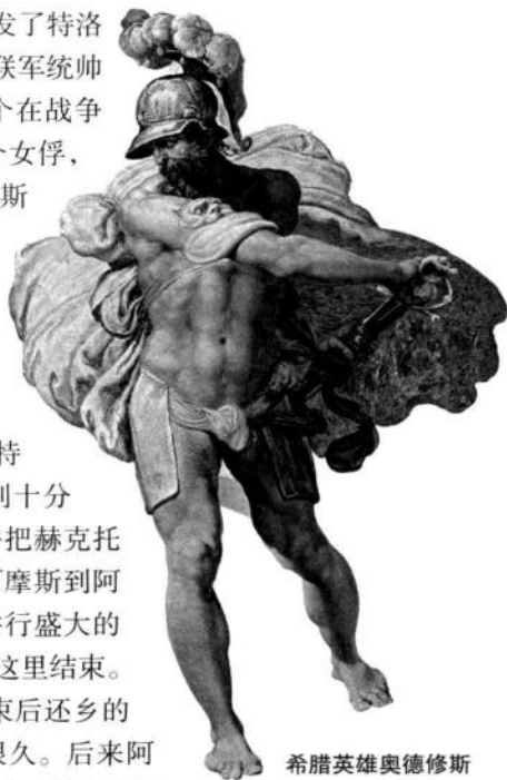
希腊英雄奥德修斯

斯巴达王墨涅拉俄斯的妻子——美丽的王后海伦，从而爆发了特洛伊与希腊之间长达10年之久的战争。到了第10年，希腊联军统帅阿伽门农和阿凯亚部族中最勇猛的首领阿喀琉斯争夺一个在战争中掳获的女子，由于阿伽门农从阿喀琉斯手里抢走了那个女俘，阿喀琉斯愤而退出战斗。《伊利亚特》的故事就以阿喀琉斯的愤怒为开端，集中描写那第10年里51天的事情。由于阿凯亚人失去最勇猛的将领，他们无法战胜特洛伊人，一直退到海岸边，抵挡不住伊利昂城主将赫克托尔的凌厉攻势。阿伽门农请求同阿喀琉斯和解，请他参加战斗，但遭到拒绝。阿喀琉斯的密友帕特罗克洛斯看到阿凯亚人将要全军覆灭，便借了阿喀琉斯的盔甲去战斗，打退了特洛伊人的进攻，但自己却被赫克托尔所杀。阿喀琉斯感到十分悲痛，决心出战，为亡友复仇。他终于杀死赫克托尔，并把赫克托尔的尸首带走。伊利昂的老王（赫克托尔的父亲）普里阿摩斯到阿喀琉斯的营帐去赎回赫克托尔的尸首，暂时休战，为他举行盛大的葬礼。《伊利亚特》这部围绕伊利昂城的战斗的史诗，便在这里结束。