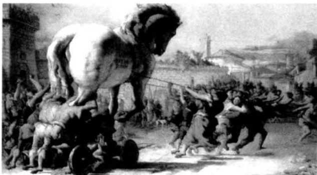
表现特洛伊战争的想象图

《伊利亚特》题名的原意是“伊利昂的故事”,写的是希腊人围攻特洛伊城的故事,当时的希腊人称特洛伊为“伊利昂”。关于这次战争的起因,在神话故事“不和的金苹果”里有详细的说明。