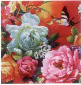
图 3-3 我国传统的印染图案