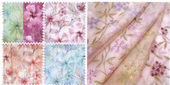
图 3-57 换色