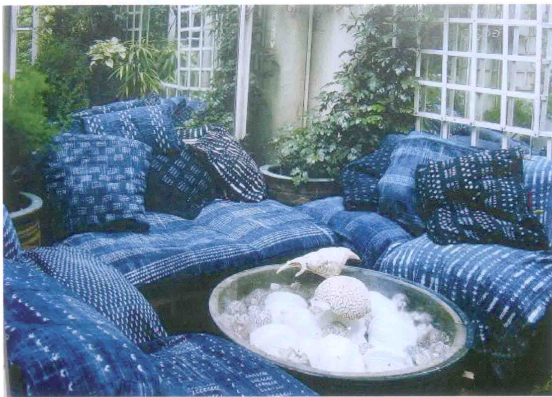
图 6-57 家纺产品的色彩搭配要符合居室空间的要求