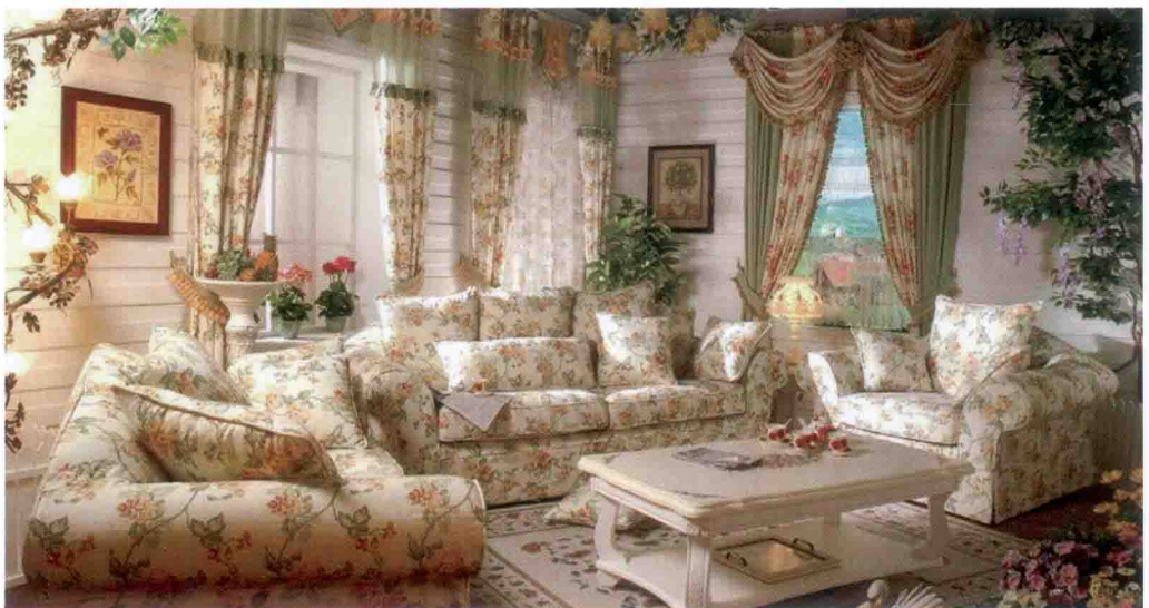
图 5-22 图案纹样