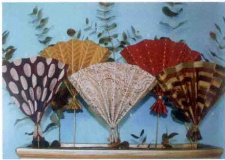
图 4-52 图案配色来源参考（三）