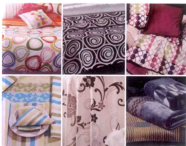
图 3-59 流行色