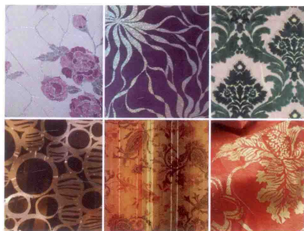
图 3-65 不同印花工艺产生的不同产品效果