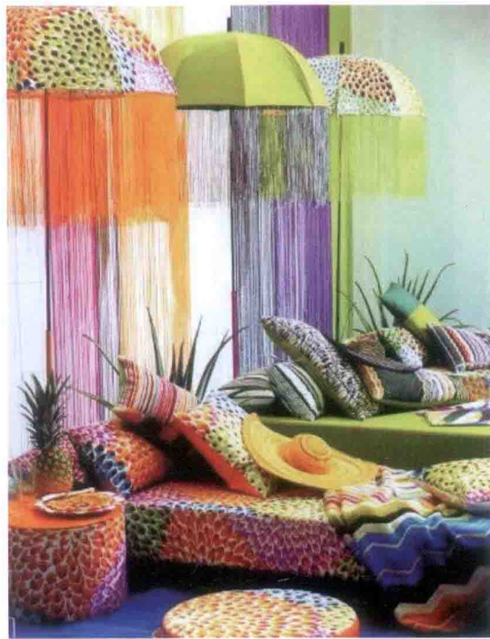
图 6-54 色调配色