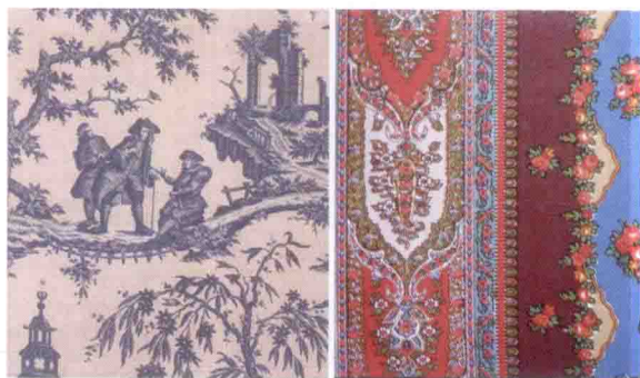
图 3-58 常用色