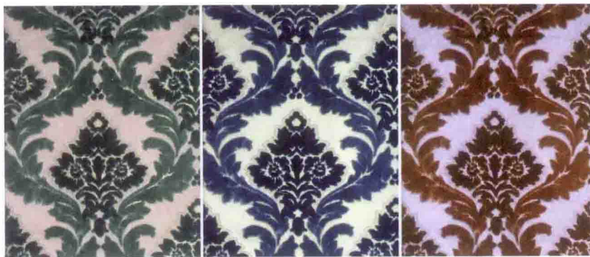
图 3-53 色彩的色相变换