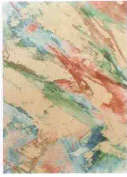
图 3-12 肌理图案