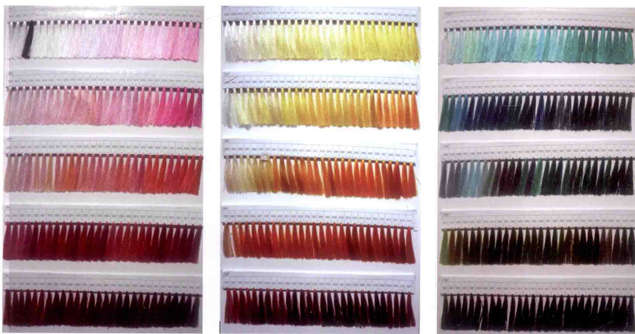
图 4-46 绣花丝线不同色相的色卡