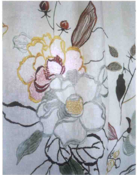
图 4-49 图案配色实例（三）