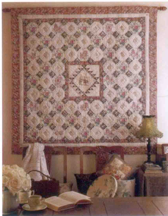
图 6-7 纤维装饰类产品造型