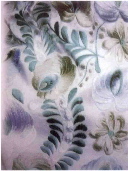
图 4-47 图案配色实例（一）