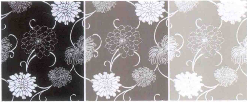
图 3-51 色彩的明度变换