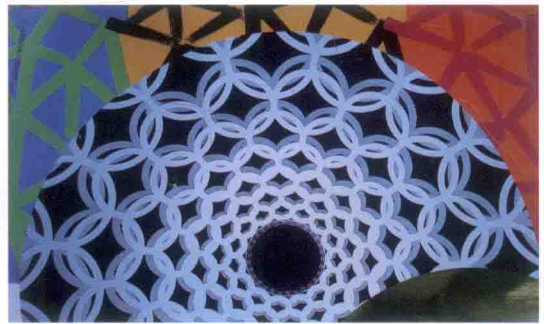
图 4-53 图案配色来源参考（四）