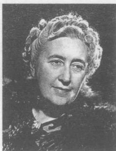
阿加莎·克里斯蒂 Agatha Christie (1890—1976)