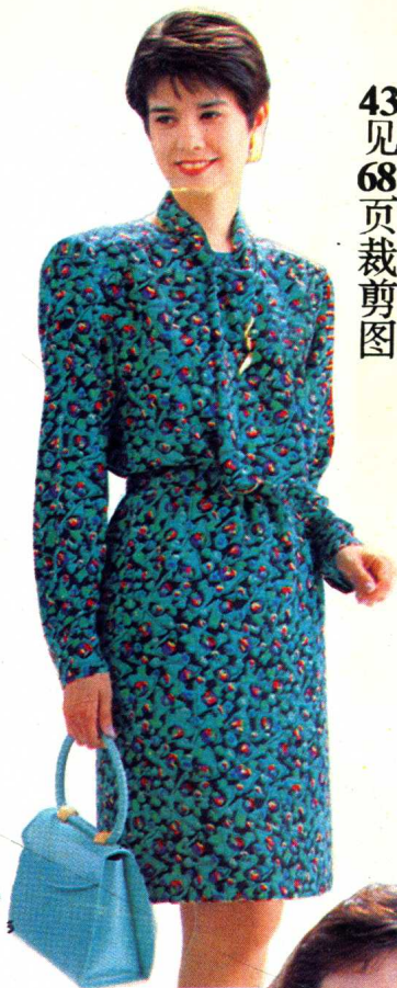
43 见 68 页裁剪图