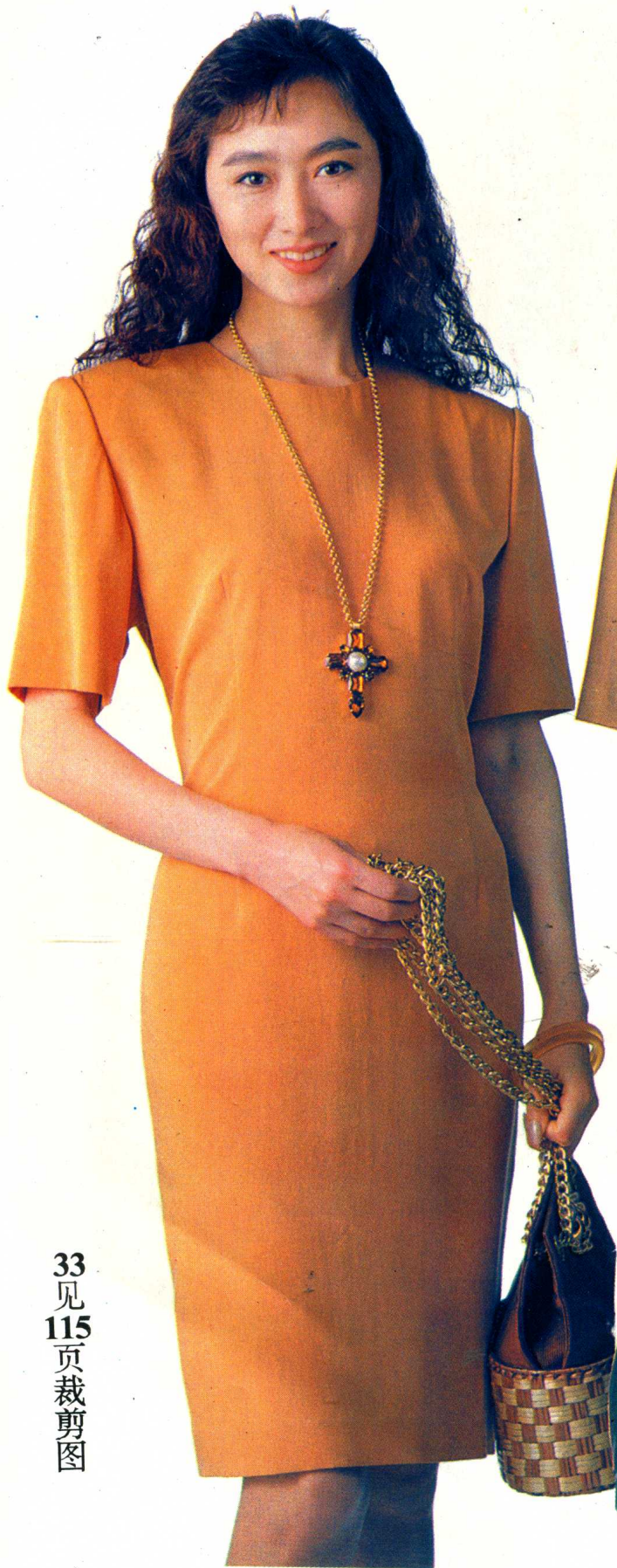
33 见 115 页裁剪图