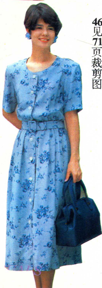
46 见 71 页裁剪图