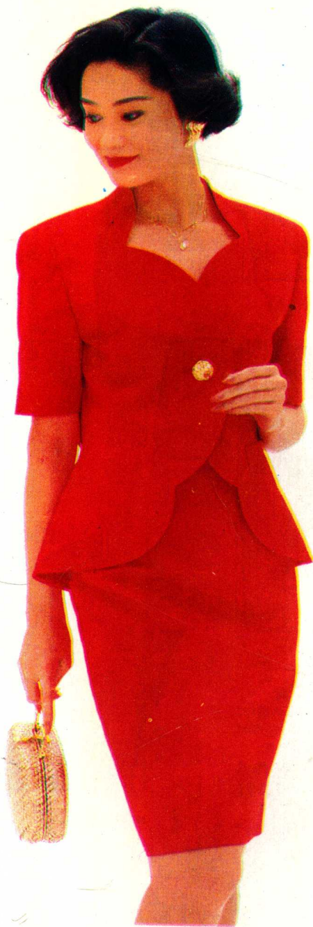
39 见 64 页 裁剪图