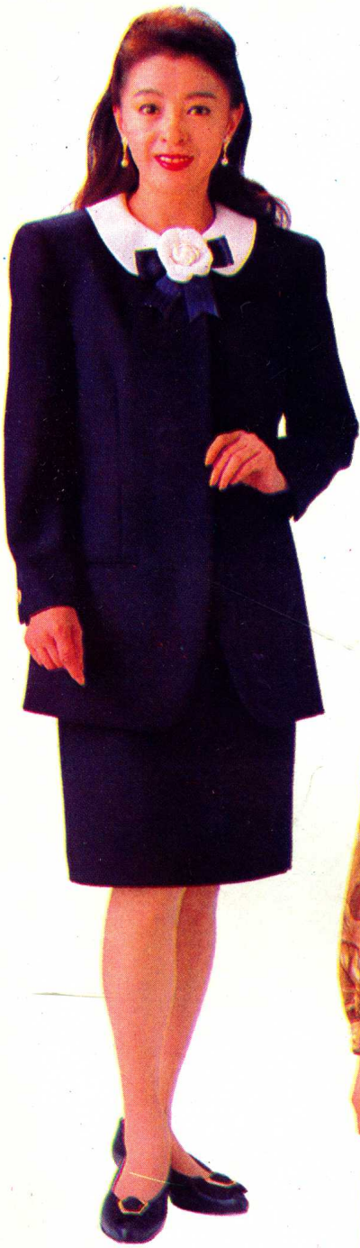
24 见 53 页 裁剪图