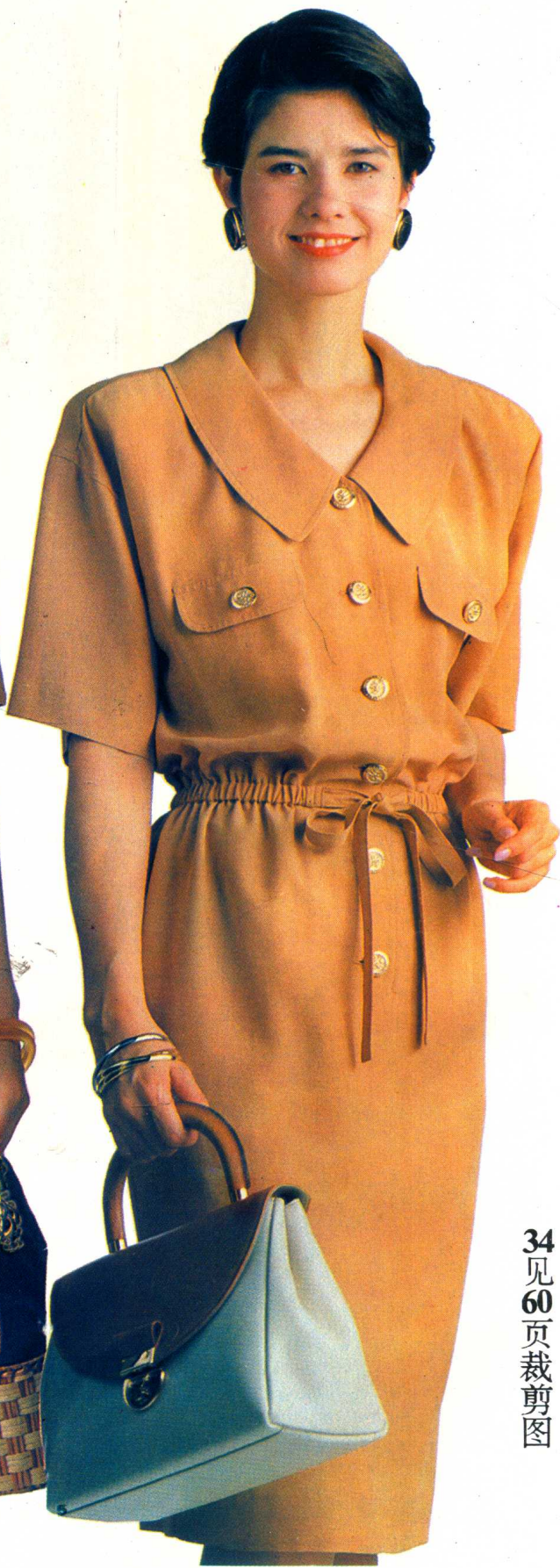
34 见 60 页裁剪图