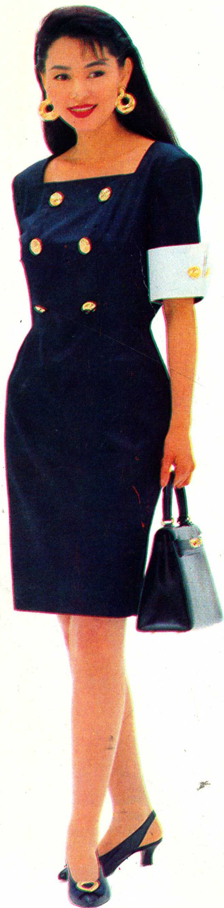
38 见 63 页 裁剪图