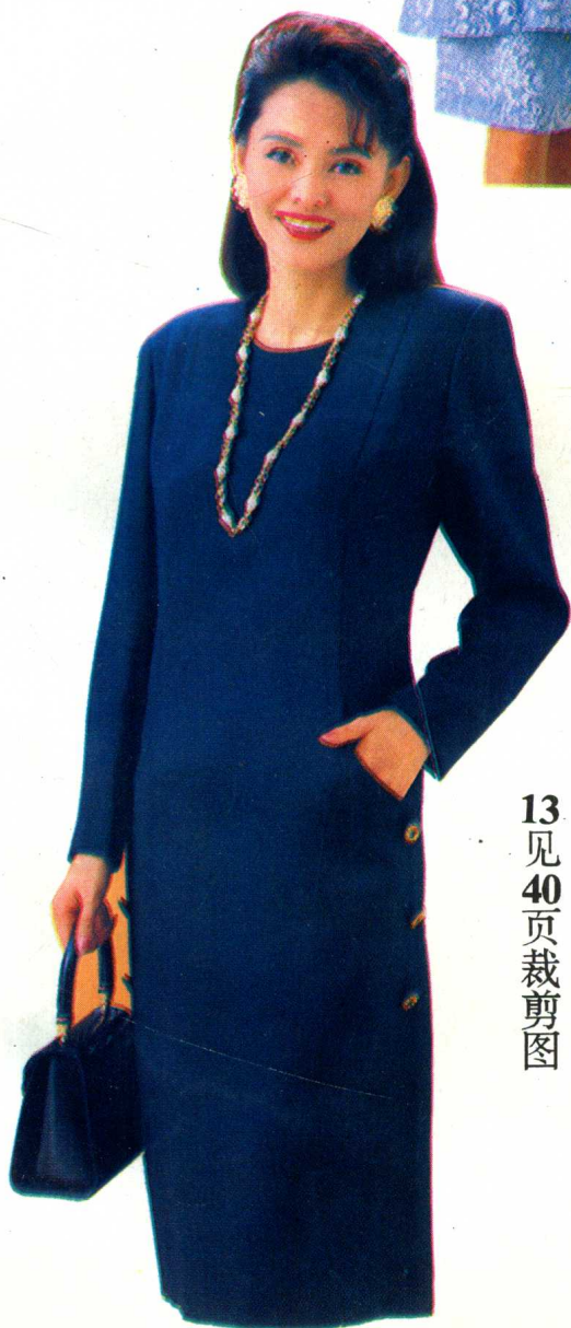
13 见 40 页裁剪图