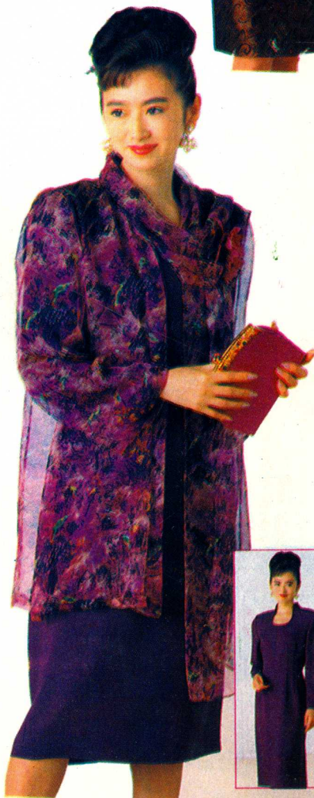
14 见 41 页裁剪图