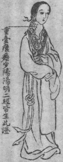
重臺瘰癧少陽陽明二經皆生此證