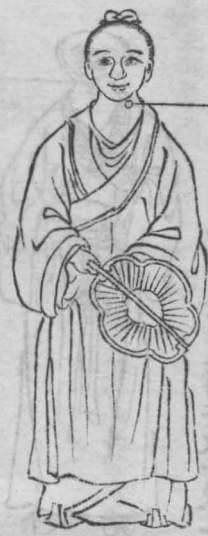
夾喉癱生結喉之兩傍