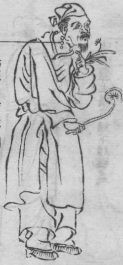
少陽經癩瘡左右同