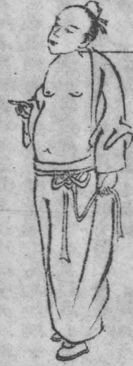
之加長冷名馬刀瘰癧

右耳根名惠袋瘰癧形小多瘰者名風癧領紅腫痛者名燕窩癧延及胸腋者名瓜藤癧生乳旁兩胯軟肉等處者名為疔瘍癧生於偏身漫腫而軟囊內含硬核者名流注癧獨生一個在顛門者名單窠癧一包生十數個者名蓮子癧堅硬如磚者名門門癧形如荔枝者名石癧如鼠形者名鼠癧又名鼠瘡以上諸癧推之移動為無根屬陽外治宜因證用鍼灸敷貼蝕腐等法推之不移動者為有根且深皆不治之證也切忌鍼砭及追蝕等藥如妄用之則難收斂瘰癧形名各異受病雖不外疲濕風熱氣毒結聚而成然未有不兼恚怒鬱幽滯謀慮不遂而成者也有外受風邪內停痰濕搏於經絡其患身體先寒後熱瘡勢宣腫微熱皮色如常易消易潰易斂此為風毒也如防風羌活湯海菜丸揀擇用之有感冒四時殺厲之氣而成其患耳項胸腋驟成腫塊宣發暴腫色紅皮熱令人寒熱頭眩強項作痛此為氣毒也如李梴連翹散堅