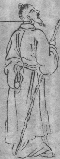
上石疽生頸項傍堅硬如石左右同

實者宜服舒肝潰堅湯氣虛者宜服香貝養榮湯外用葱白蜂蜜搗泥敷貼日久不消者以陽燧錠每日灸之以 或消或軟或將潰為度既潰法同瘰癧