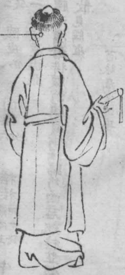
太陽經濕癩瘡生髮際下與偏腦疽異