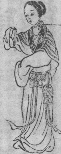
陽明經瘰癧其形大小不一連接數枚