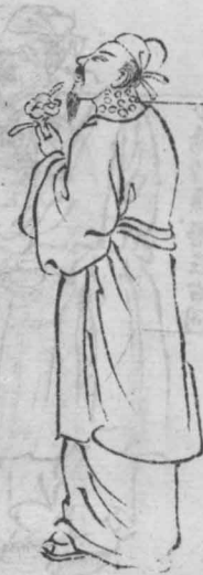
結喉癰生項前頰下結喉處