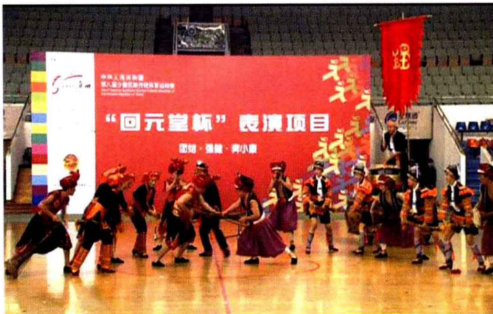
参加第八届全国少数民族传统体育运动会(2007)