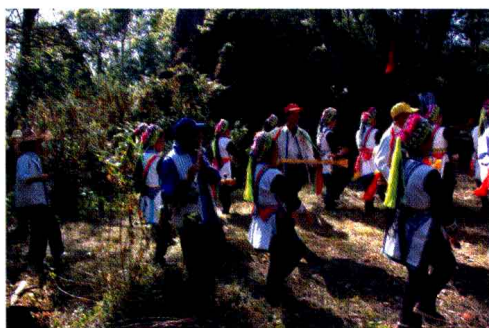
老年人的阿细跳月