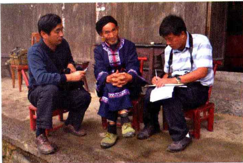
采访摆手舞传承人