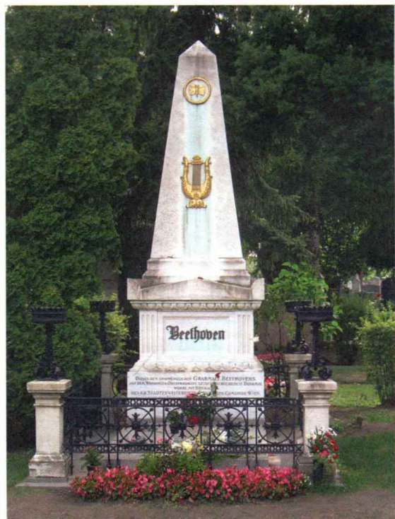
贝多芬之墓（维也纳）