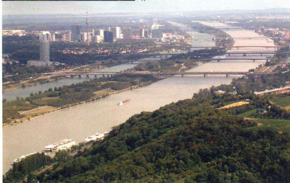
多瑙河风光 (维也纳)