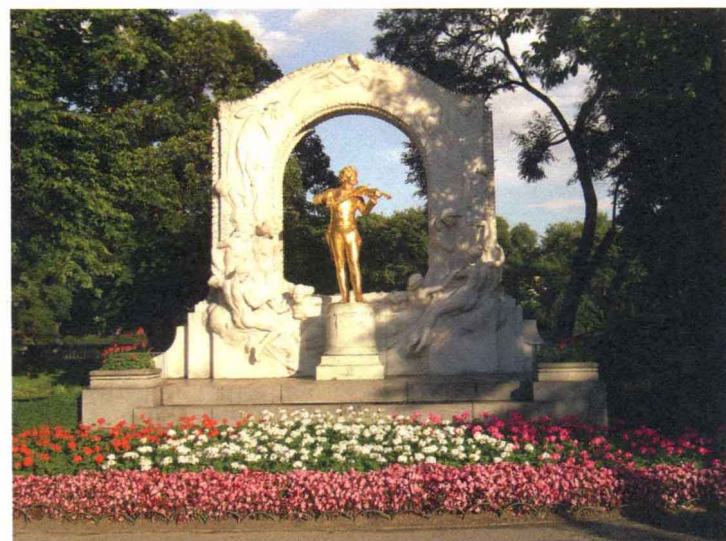
维也纳城市公园小施特劳斯雕像