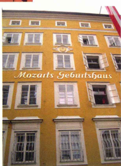
莫扎特故居（萨尔茨堡）