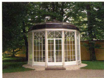
电影《音乐之声》旧址：将军家大女儿与她的邮递员男友约会的凉亭（萨尔茨堡）