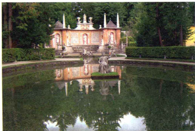
海尔布伦戏水宫（萨尔茨堡）