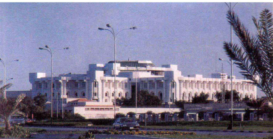
卡塔尔埃米尔王宫