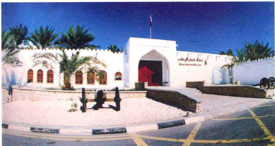
卡塔尔国家博物馆