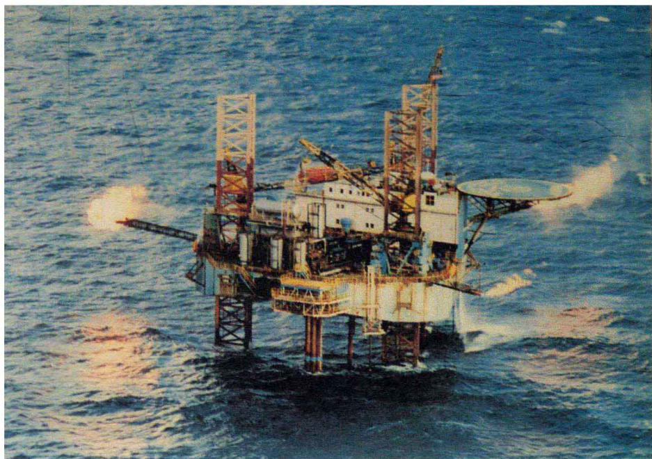
海上石油钻井平台