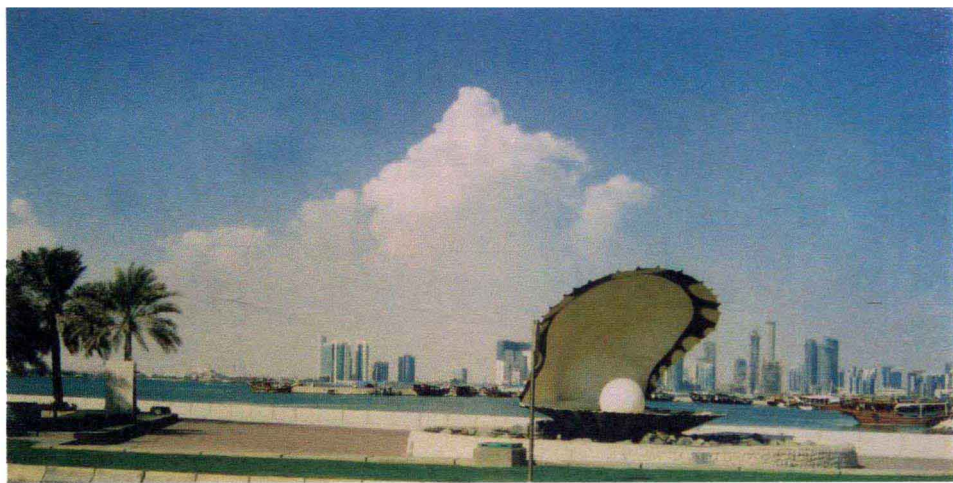
多哈贝达公园海蚌含珠雕塑