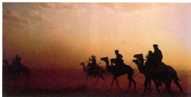
激烈的骑骆驼比赛