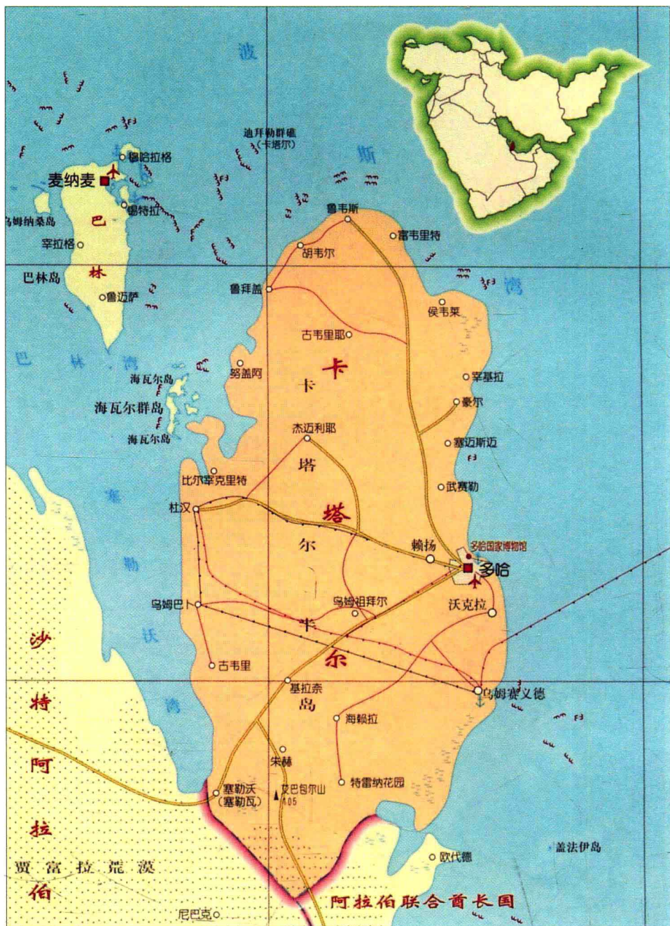
卡塔尔行政区划图