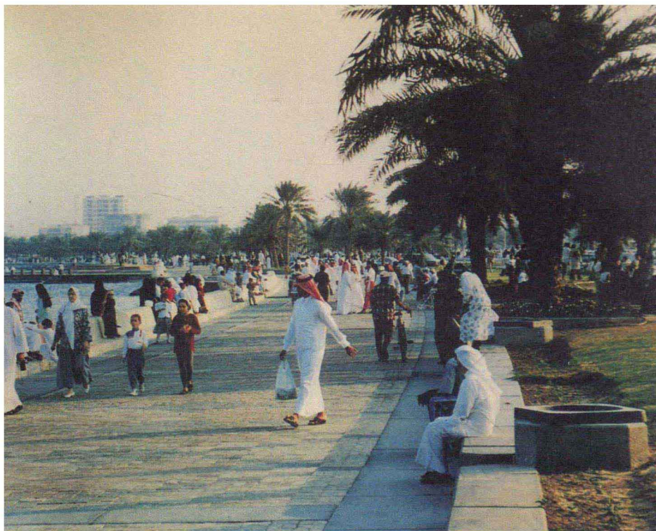
多哈海滨公园一角