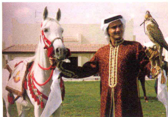
卡塔尔人的两项富贵嗜好——纯种阿拉伯马与猎鹰