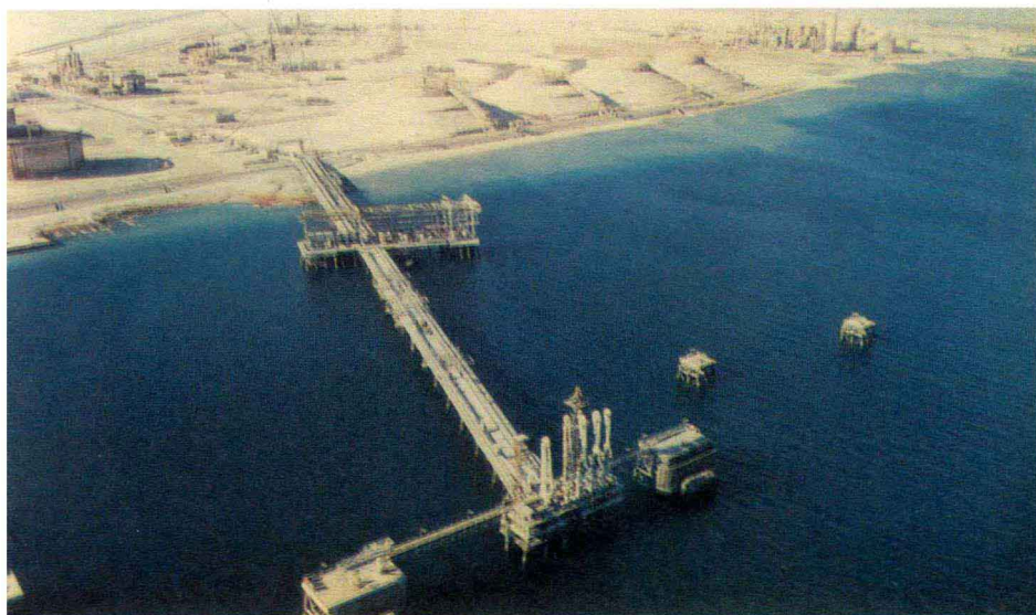
液化天然气工厂一角