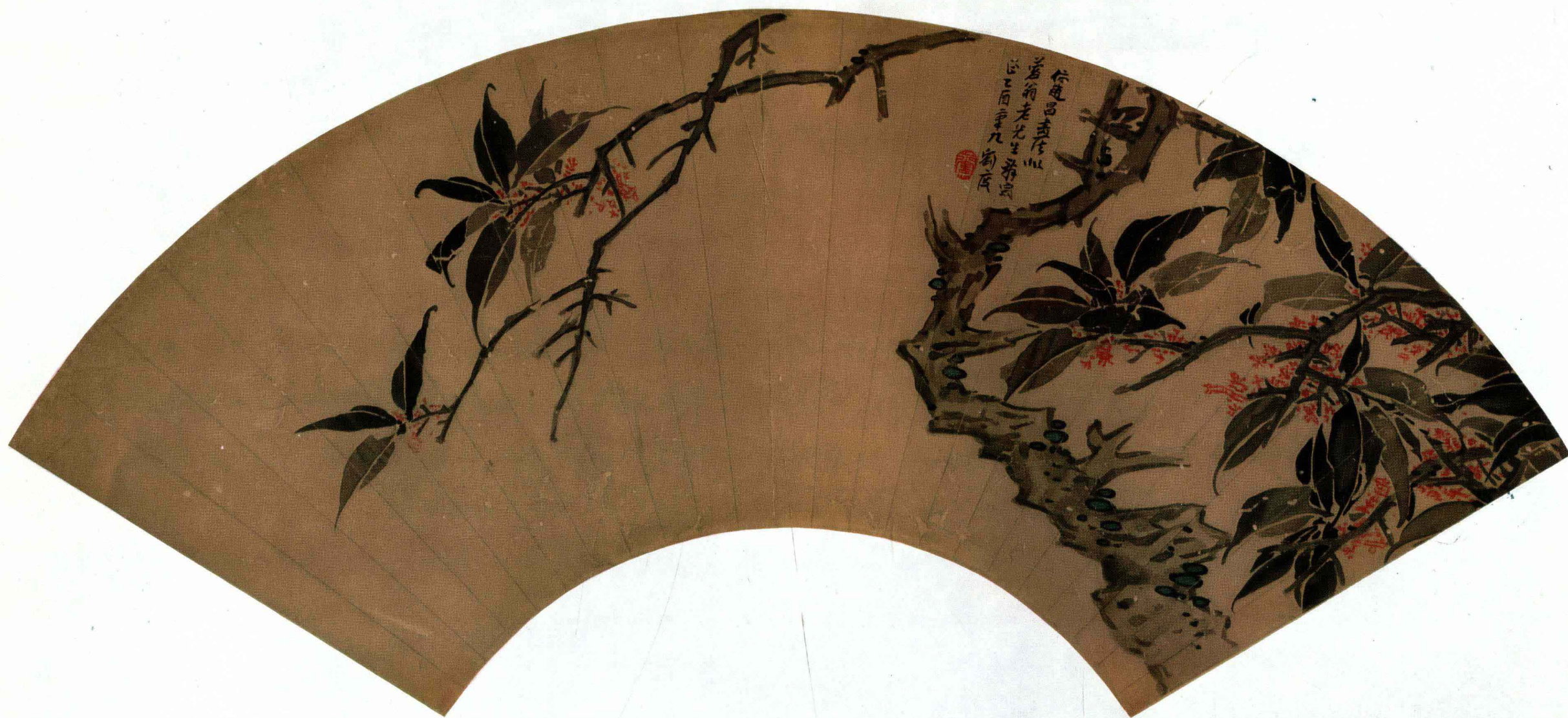
五 明 刘 度 桂 树 图