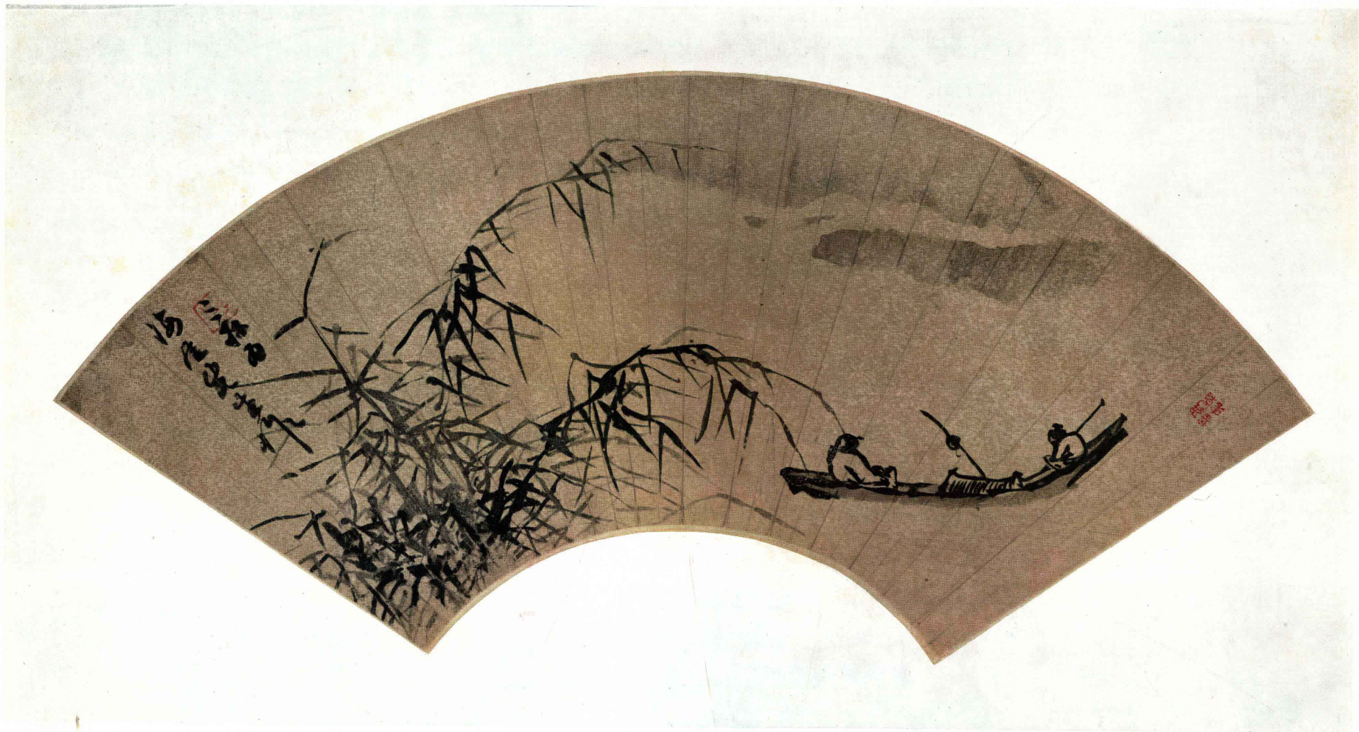
一 明 蒋 嵩 芦浦渔舟图