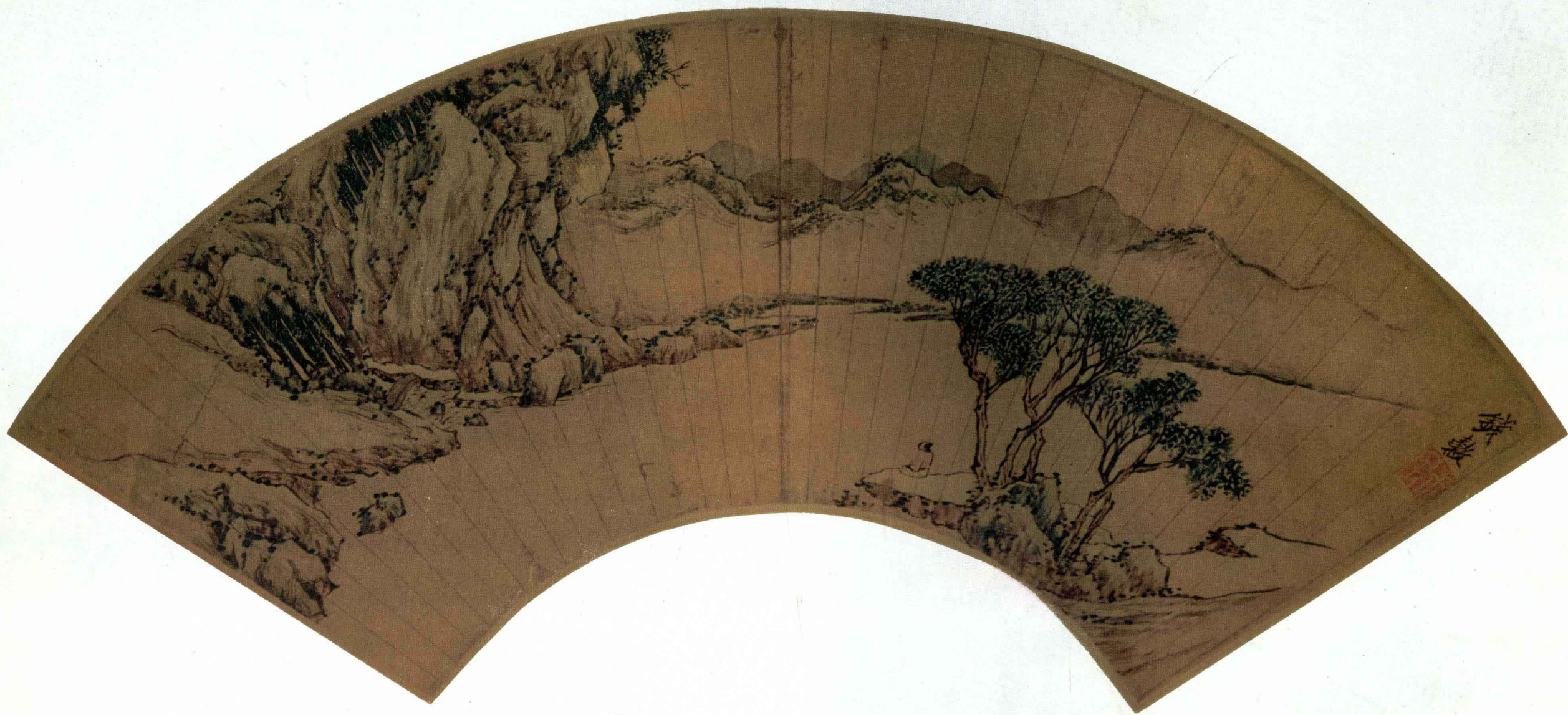
三 明 钱 谷 临江远眺图