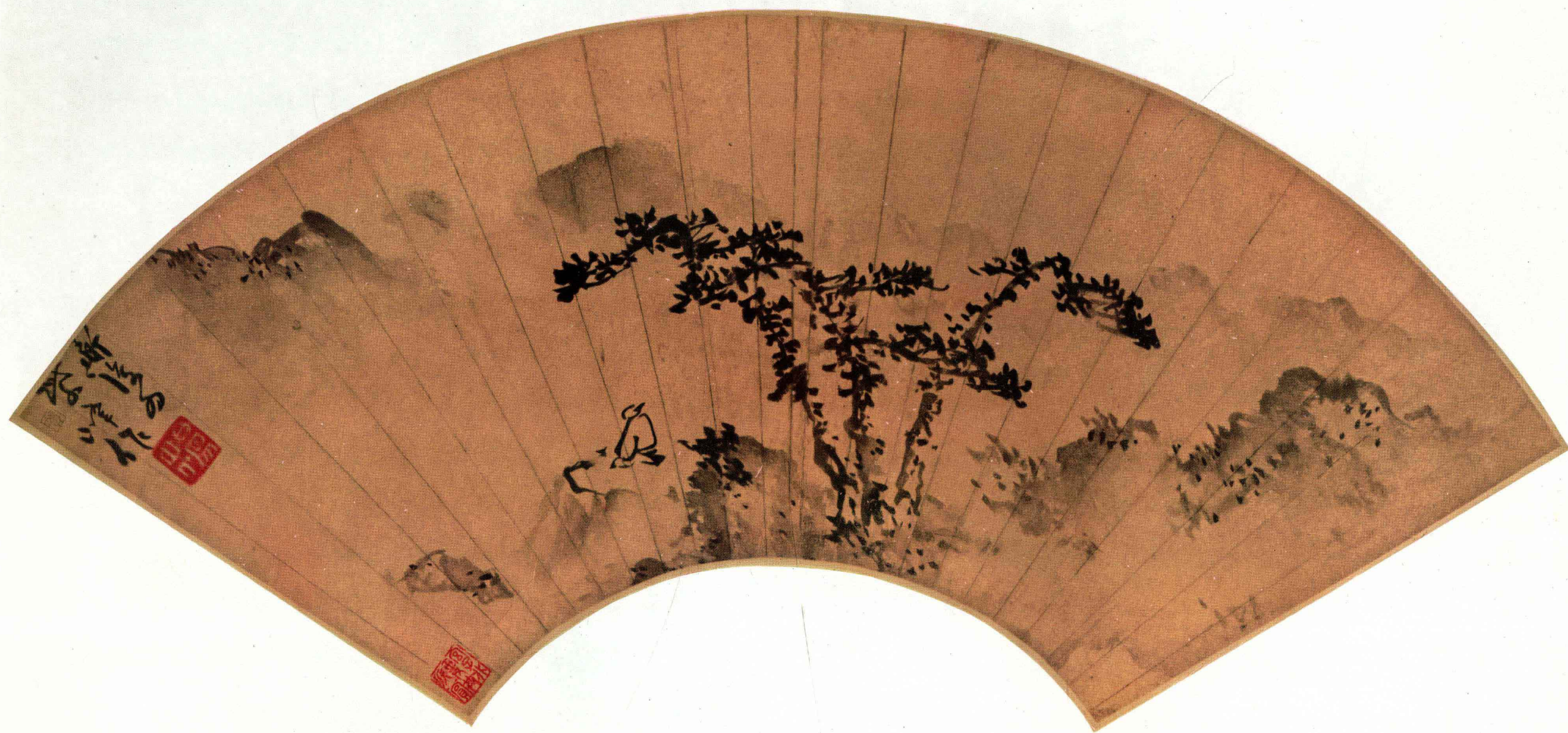
二 明 陈道复