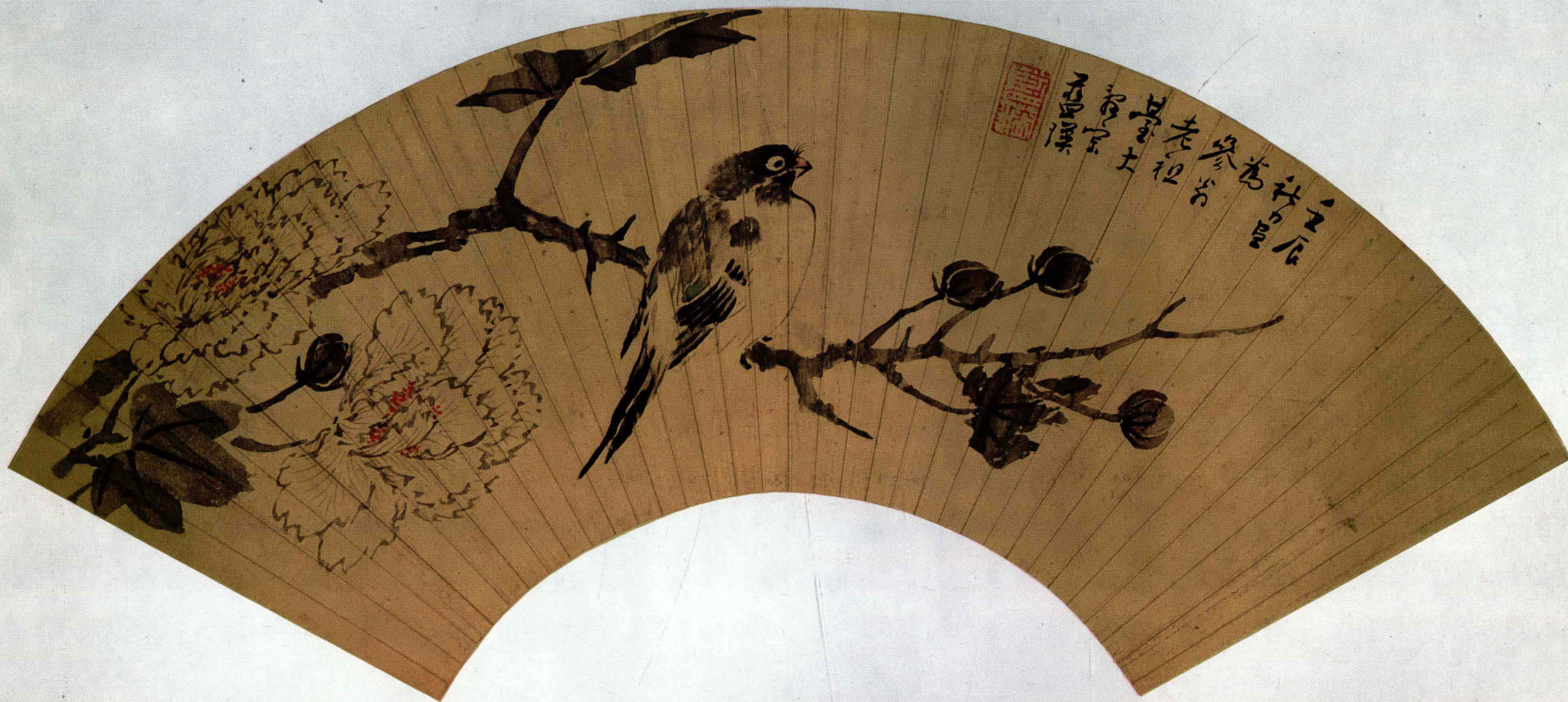
六 明 蓝 瑛 花 鸟 图