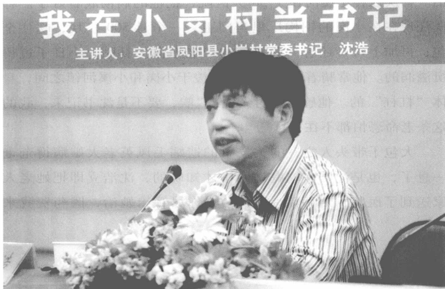
2009年5月给江苏大学师生作报告