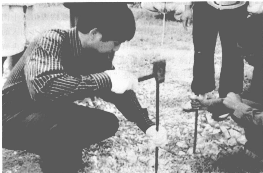
在小岗村修路

知不觉斜阳西下，霞光映照着小岗村，少数农户已升起了炊烟，站在村东向西望，小岗村像一条长龙卧地。张秀华说了一句发自内心的话：“这回有你来了，小岗有希望了。”