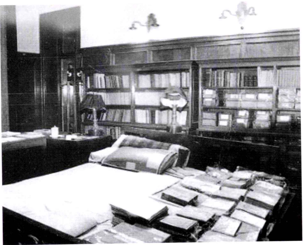
毛泽东在中南海的卧室。