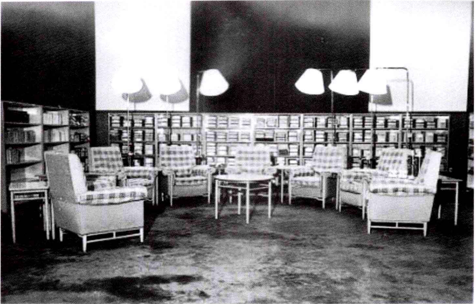
毛泽东在中南海的书房及会客厅。