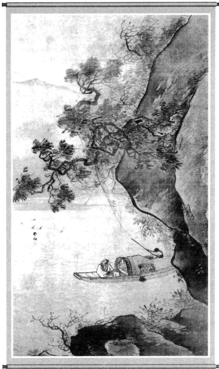
《溪山泛艇图》，（明）张路，绢本，设色，纵 165.8 厘米，横 97.5 厘米