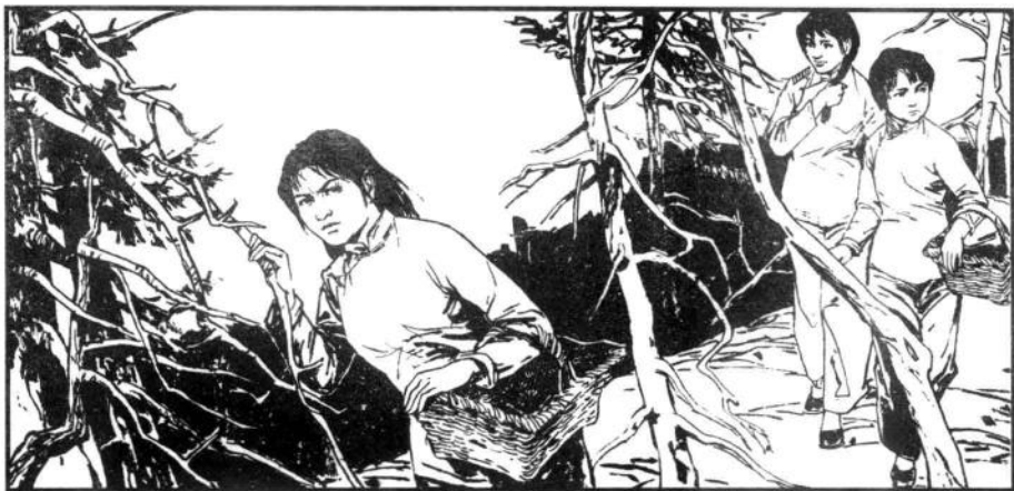
11 她们化装成农妇，把手枪掖在腰里，一前两后走下山去。