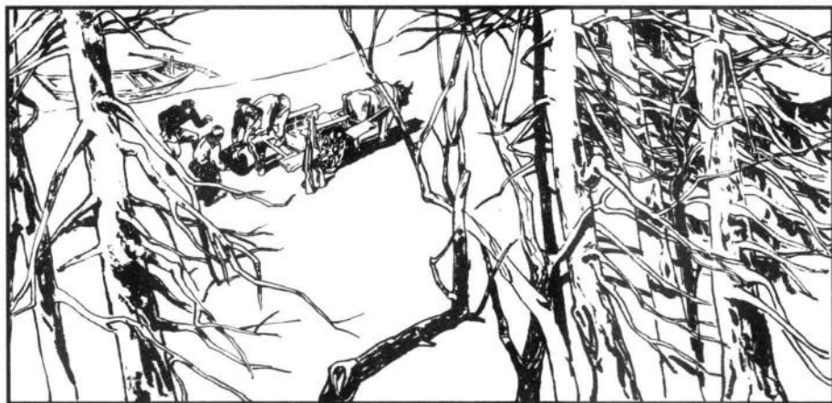
12 她们来到渡口附近，看见江边上有一只木船，还有一辆牛车停在岸边的沙滩上。两个伪警察和两个农民正把一口绑着的肥猪从车上抬下来，准备放到船上。