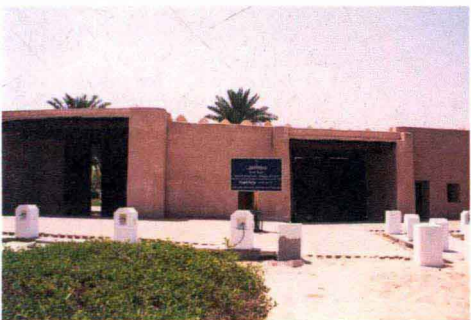
科威特城古城门遗址