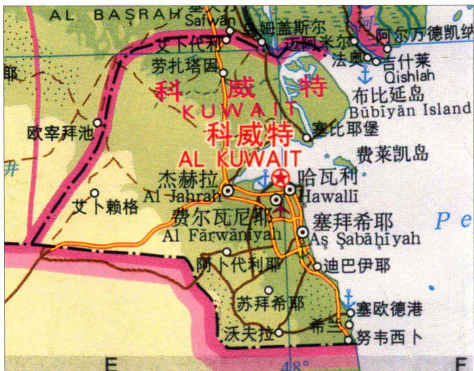
科威特行政区划图