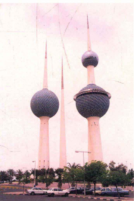
科威特旅游胜地——科威特塔