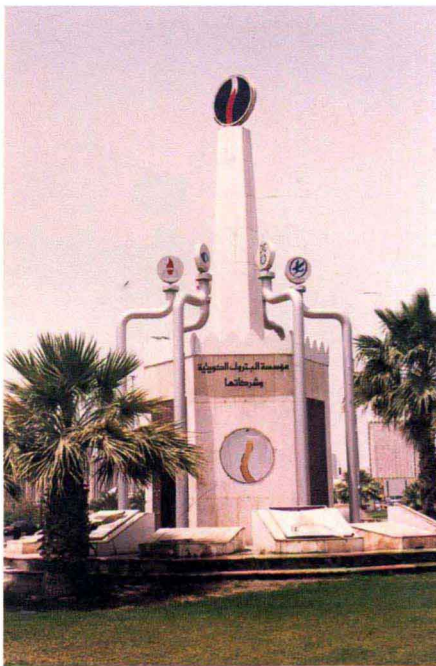
科威特石油总公司的标志性建筑