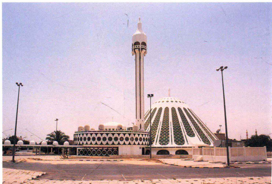
设计新颖的清真寺