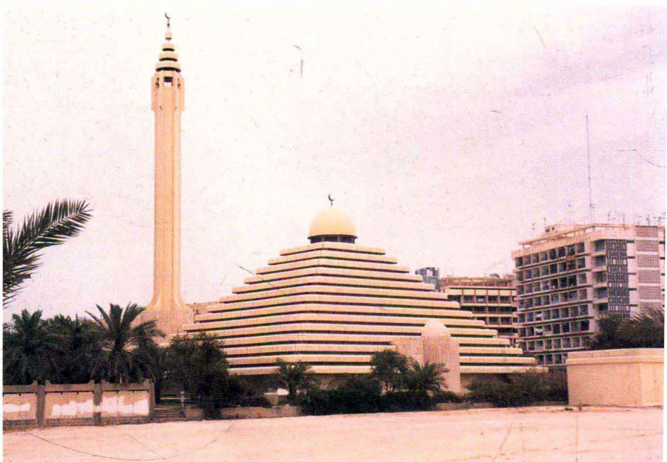
造型别致的清真寺