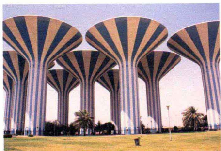
造型别致的民用水塔