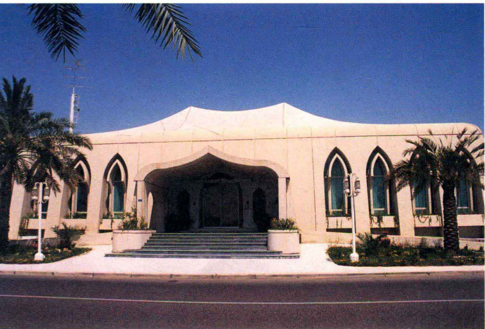
现代化的迪瓦尼亚——沙龙