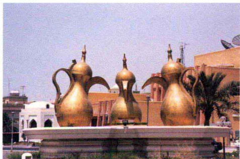
科威特的社区雕塑