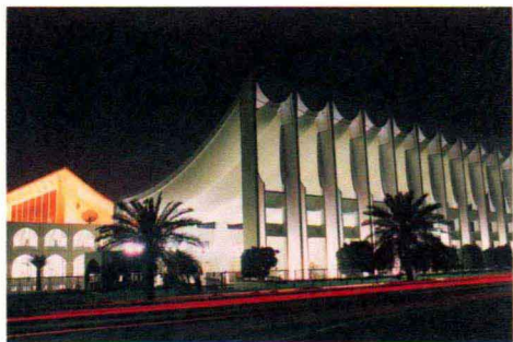
科威特国民议会大厦夜景