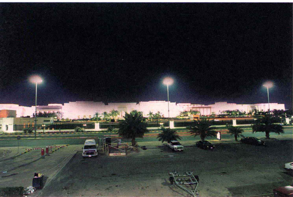
埃米尔王宫——塞夫宫夜景