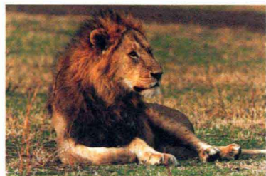
野生动物园里的狮子