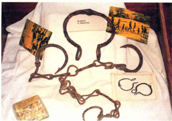
巴加莫约博物馆展出的抓捕奴隶的锁链