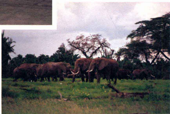
野生动物园里的大象群