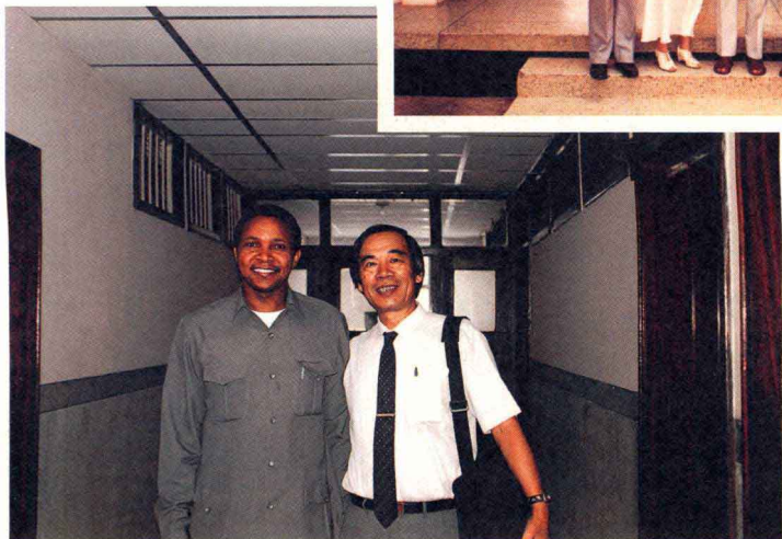
1996年笔者同前 外交和国际合作 部长、现任总统 基奎特合影