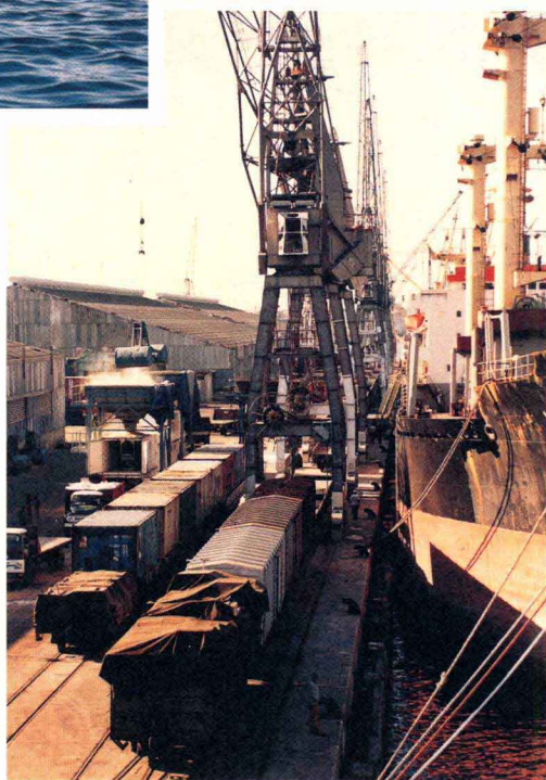
繁忙的达累斯萨拉姆港