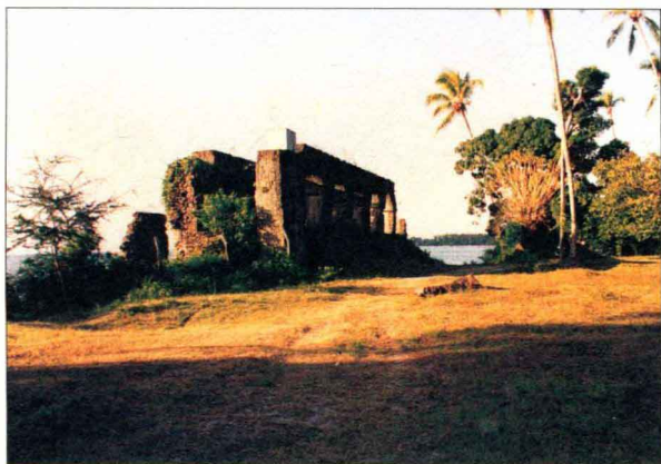
桑给巴尔市郊的一处奴隶转运站遗址