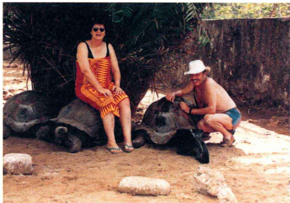
桑给巴尔“龟岛”上的 大旱龟与游客和谐共处