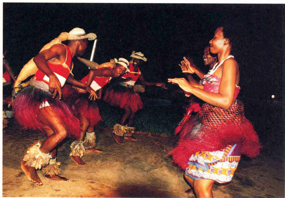
坦桑尼亚的民族舞蹈