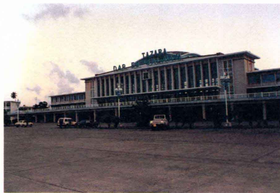
坦赞铁路达累斯萨拉姆站