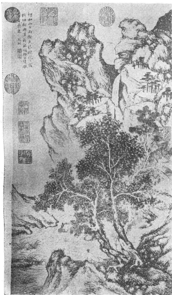
二、文徵明繪《好雨聽泉圖》