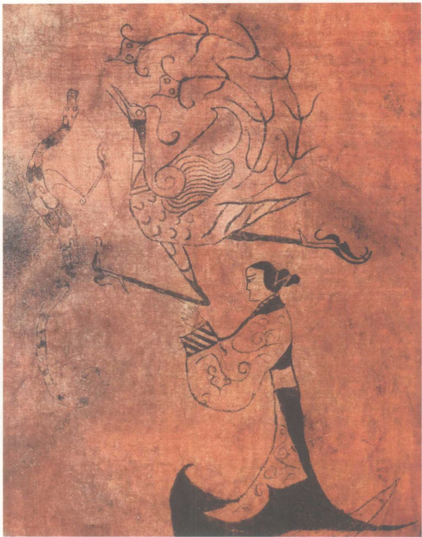
战国帛画《龙凤仕女图》

该帛画是研究战国时期楚文化的珍贵资料，也是现存最早的帛画作品之一。画上人物是墓主肖像，画中随伴墓主的尚有吉祥图腾之物。