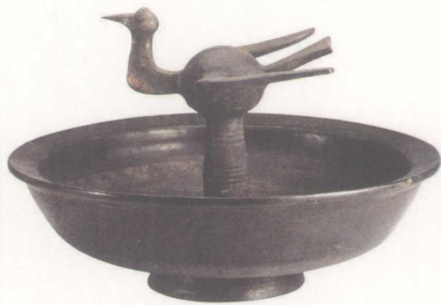
战国黑陶磨光压划纹鸟柱盘