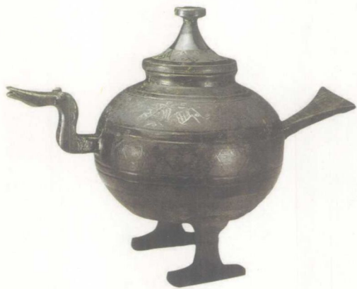
战国黑陶磨光压划纹鸭尊