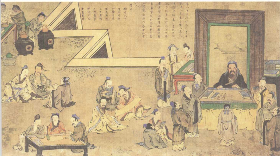
明佚名《孔子圣迹图》之“杏坛礼乐图”

春秋时期，王官之学衰微，孔子首开私人讲学之风，设杏坛讲学授徒，整理并以《诗》、《书》、《礼》、《易》、《乐》、《春秋》六经为教材，以礼、乐、射、御、书、数六艺为教育内容。因此，杏坛成为孔子万世立教的第一圣地。