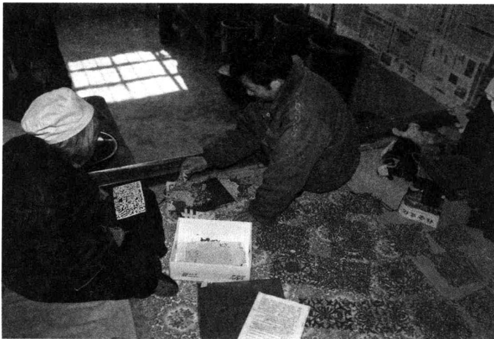
陕西安塞县文化馆美术干部在农村普查民间剪纸。

我们坚信，传承千百年的陕西民间剪纸艺术不仅不会在我们手中失传，而且一定会传之久远，更加瑰丽多姿，光彩照人。