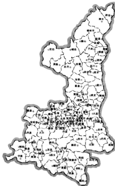
陕西省行政区划图

3. 陕西民间剪纸与当地民俗生活相依相伴，民俗文化的丰富性导致了剪纸品类与样式的多样性和文化内涵的丰富性。如婚俗剪纸、丧俗剪纸、年节剪纸、巫术剪纸、神话剪纸、民间故事剪纸等，其美的形式里蕴含着当地古老的婚俗、丧俗、年俗、礼俗、巫术、神话、传说等丰富的民俗学文化内容。产生于陕北相对比较封闭的文化环境中的“抓髻娃娃”、“人首鱼身”之类古典的形象，更多地保存了远古文化信息。关中地区的戏曲人物剪纸格外丰富多彩，比民歌文化更为进步的戏曲文化几乎成为关中民俗文化的纽带，而关中地区戏曲人物剪纸便是在这种深厚的戏曲文化的土壤中孕育、生发出来，并且日趋丰富、繁荣和成熟起来的。陕南在秦岭以南的长江流域，当地民居不像陕北、关中必须糊窗户纸抵御西北寒风，因而并不盛行窗花，在那里，刺绣“花样”却比较丰富，受巴蜀和荆楚文化传统的影响甚深。鉴于上述诸多原因，陕西民间剪纸向来被看做是中国民间剪纸的一种典范，这也是对古雅的陕西民间剪纸的一种确认与评价。