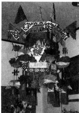
春节悬挂在庭院的彩灯，多是用剪纸手法装饰而成。