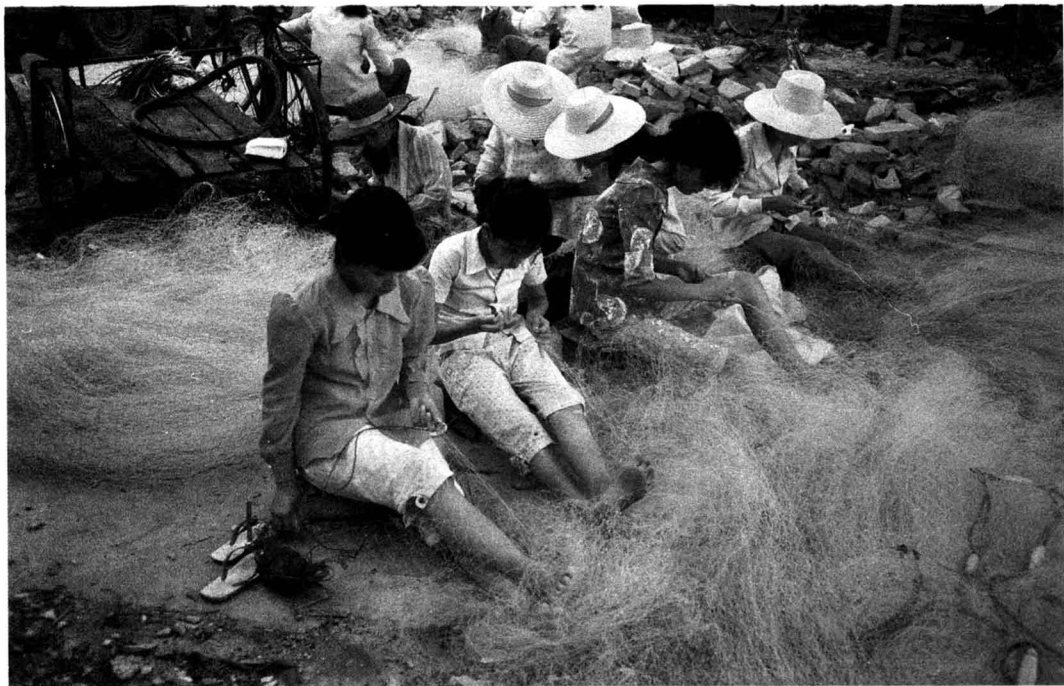
三亚河盐田一带是渔民居住的集中地之一，随着生活环境的改变，旧日的生活场面已经一去不复返了 1991年

在文学理论原则中，文学艺术是从实际生活出发，反映一定的生活本质，具有认识社会生活、启发人、教育人，推动社会历史发展的作用。纪实摄影在其创作发展进程中完全认同并承袭了这一理论原则。就是用一种平等的、同情的、理解的方式去看待被摄对象的，其目的就在于不是把摄影作为一种机械的翻拍手段，而是从客观的生活、主观的情感上接近被摄者，将镜头前的情景真实而典型地传达给读者或社会，以期完成引起人们的同情和关怀的结果。美国早期纪实摄影家刘易斯·维克·海因曾说：“我要用摄影来表现必