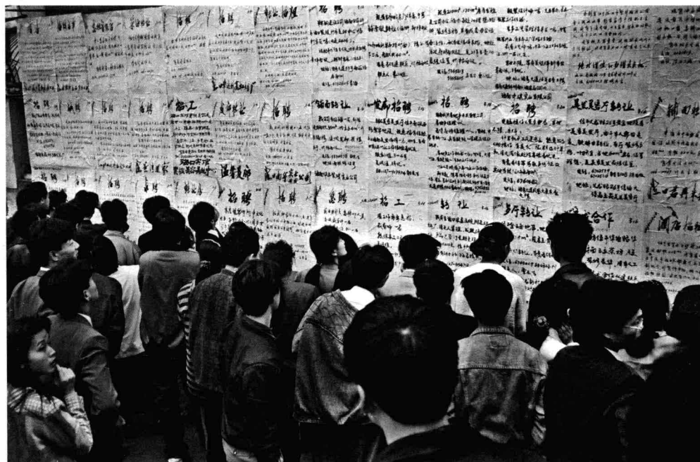
海口市东湖人才墙聚集的闽海者 1989年