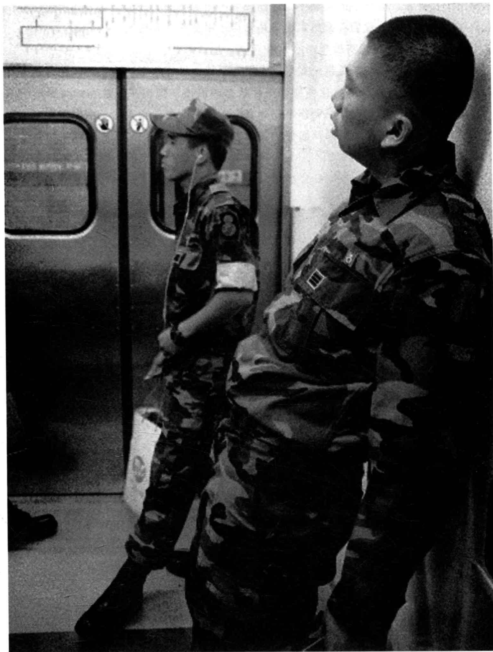
《在地下移动的队伍》之二 2010年首尔