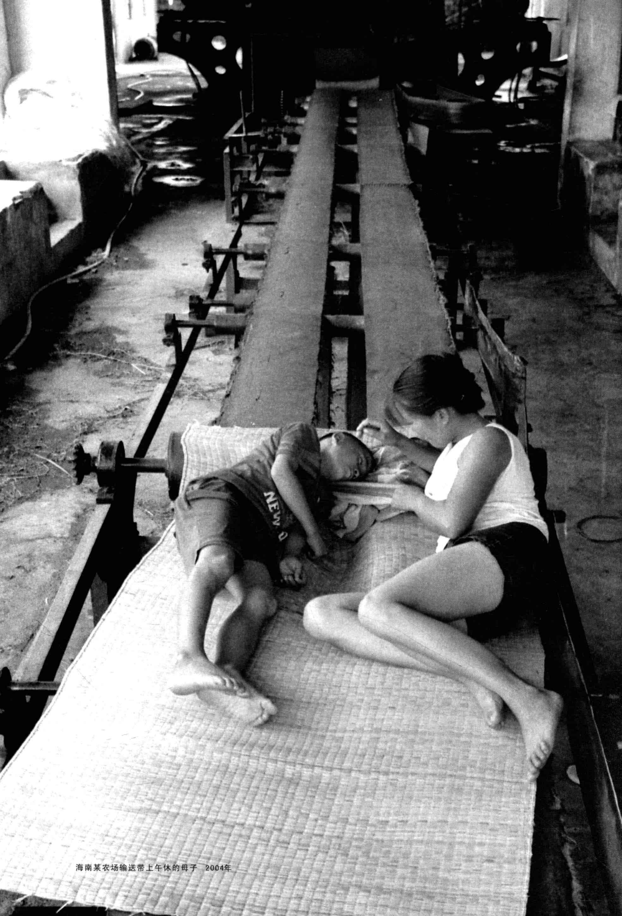
海南某农场输送带上午休的母子 2004年