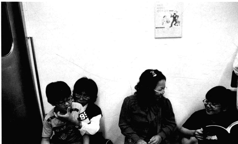
《在地下移动的队伍》之一 2010年首尔