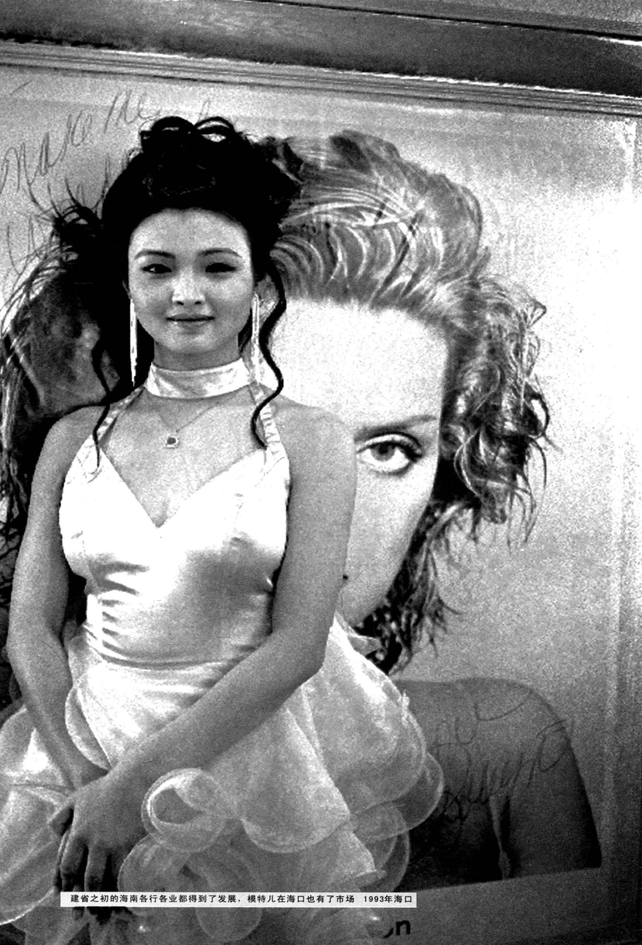
建省之初的海南各行各业都得到了发展，模特儿在海口也有了市场 1993年海口