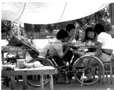
海口东湖三角池的大学生饭店 1988年