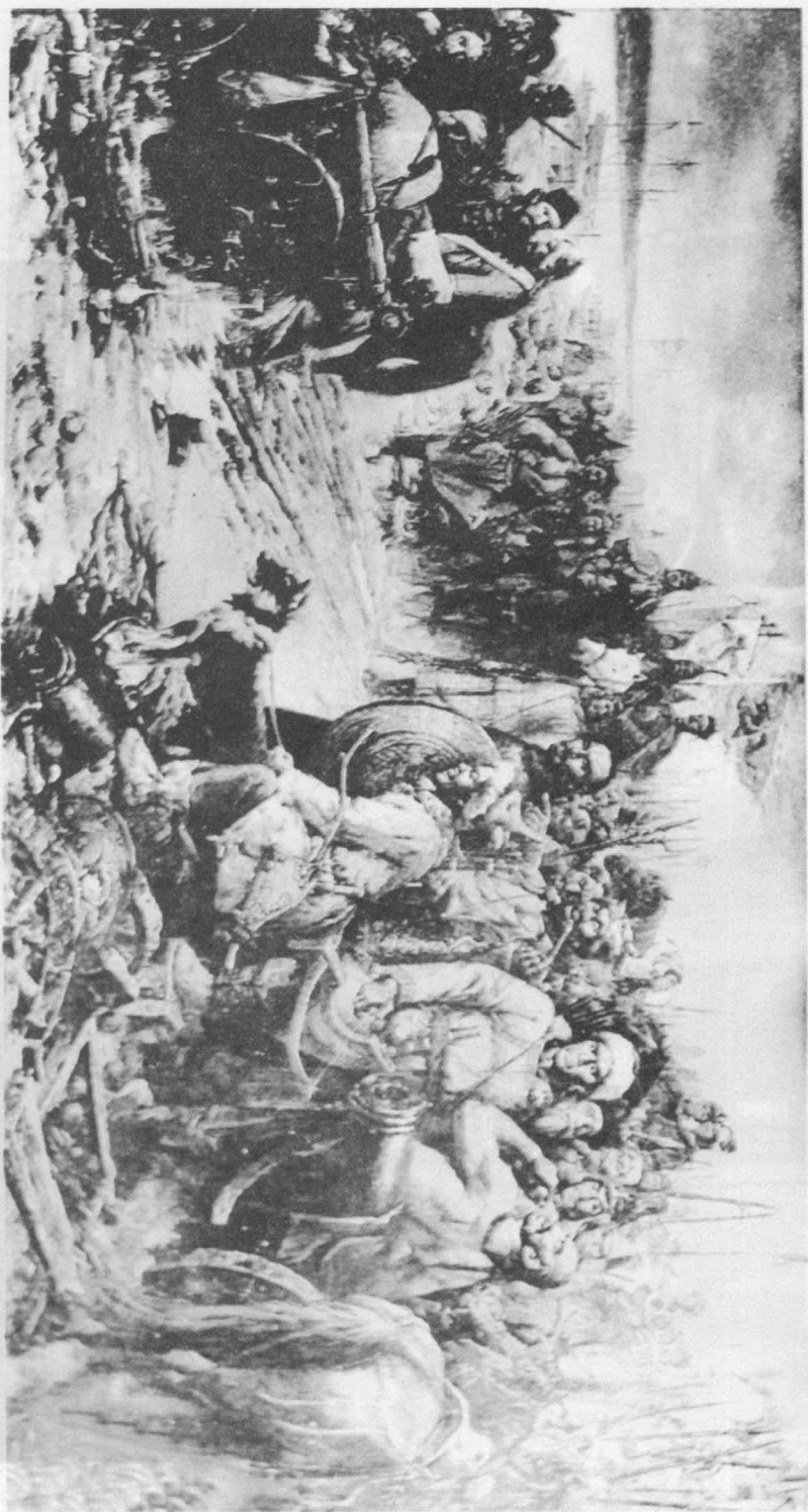
雅克萨之战（转引自乐志德主编《达斡尔资料集·第一集》）