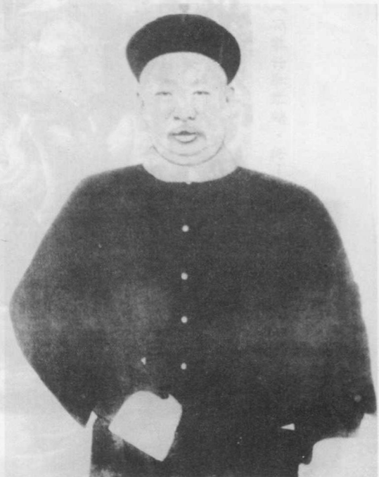
黑龙江将军延茂（转引自皮福生编著《吉林碑刻考录》）