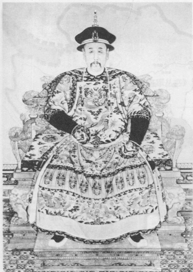
康熙帝画像（转引自《清代帝后像》）