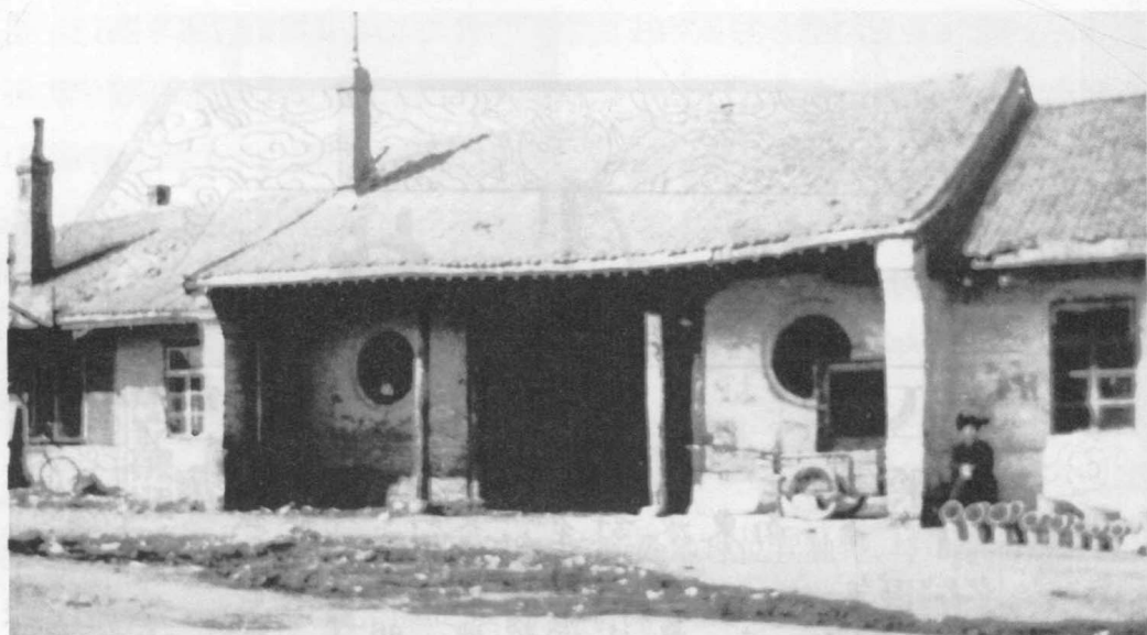
坐落在齐齐哈尔城内的清代黑龙江将军府