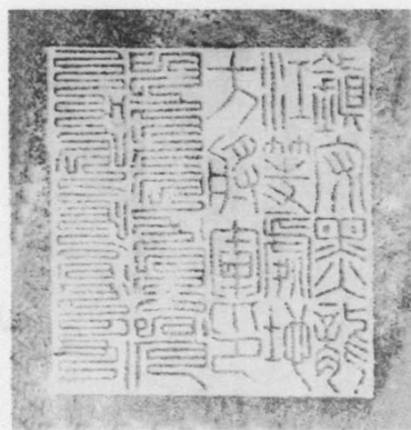
镇守黑龙江等处地方将军印（黑龙江省档案馆供稿）