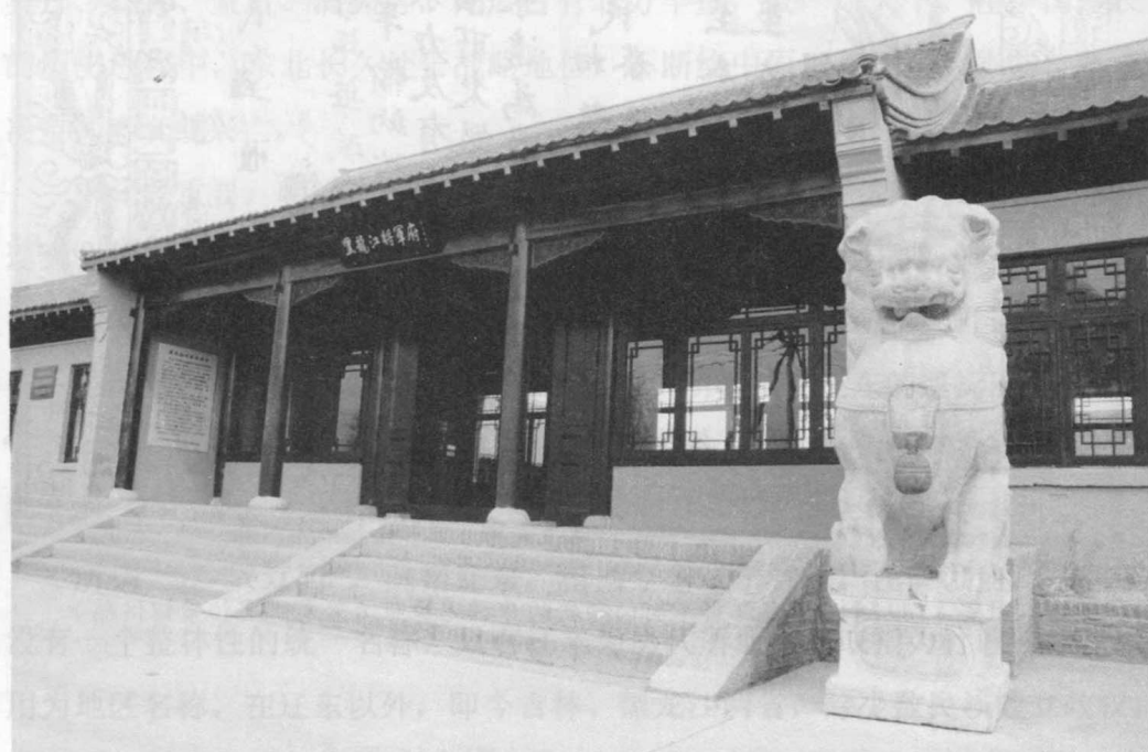
坐落在齐齐哈尔明月岛风景区内的黑龙江将军府陈列馆

有过短暂的“辽”，亦泛指东北。古人洞察东北的战略价值，共识见当不在今人之下。至清，尤重东北，更迭胜历代。东北为清朝的发祥地，还是满洲及其先世的古老故乡。清朝视东北为其“根本之地”，而盛京则是“重中之重”。清