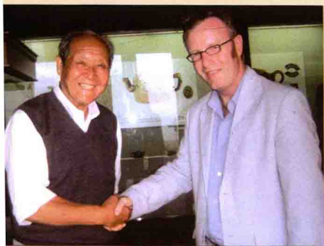
与加拿大紫砂研究者亲切交谈

历史上有许多著名的知识分子参与紫砂壶的设计及制作，使紫砂壶集造型、诗词、书法、绘画、篆刻、雕塑于一体，逐渐发展成为一种独特的紫砂文化，具