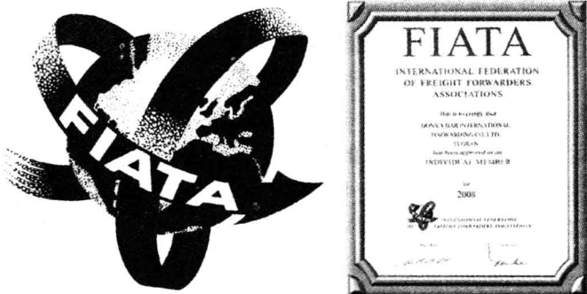
图 1-1 国际货运代理协会联合会图标和授权证书

国际货运代理协会联合会的宗旨是保障和提高国际货运代理在全球的利益。国际货运代理协会联合会的主要贡献有: 提供各国立法参考的《国际货运代理示范法》; 推荐各国国际代理企业采用的《国际货运代理标准交易条件》; 制定了 FIATA 运送指示、FIATA 货运代理运输凭证、FIATA 货运代理收货凭证、FIATA 托运人危险品运输证明、FIATA 仓库收据、FIATA 可转让联运提单和 FIATA 收发货人联运重量证明等单证格式范本。