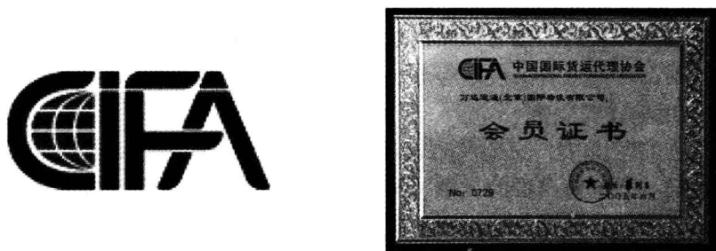
图 1-3 中国国际货运代理协会图标和授权证书

(4) 我国各地区国际货运代理协会。进入 20 世纪 90 年代以后，我国的对外贸易迅速增长，随之而来的是国际货运代理行业迅速发展。货代市场的发展，迫切需要有一个行业组织来协调企业和政府、企业与市场之间的关系。上海在 1992 年率先成立了国际货运代理的行业协会，随后各地区的国际货运代理行业协会在后来的 10 年中也纷纷成立。这些行业协会都是由国际货运代理企业自愿组成的、非营利性的行业组织，接受地区外贸主管部门和民