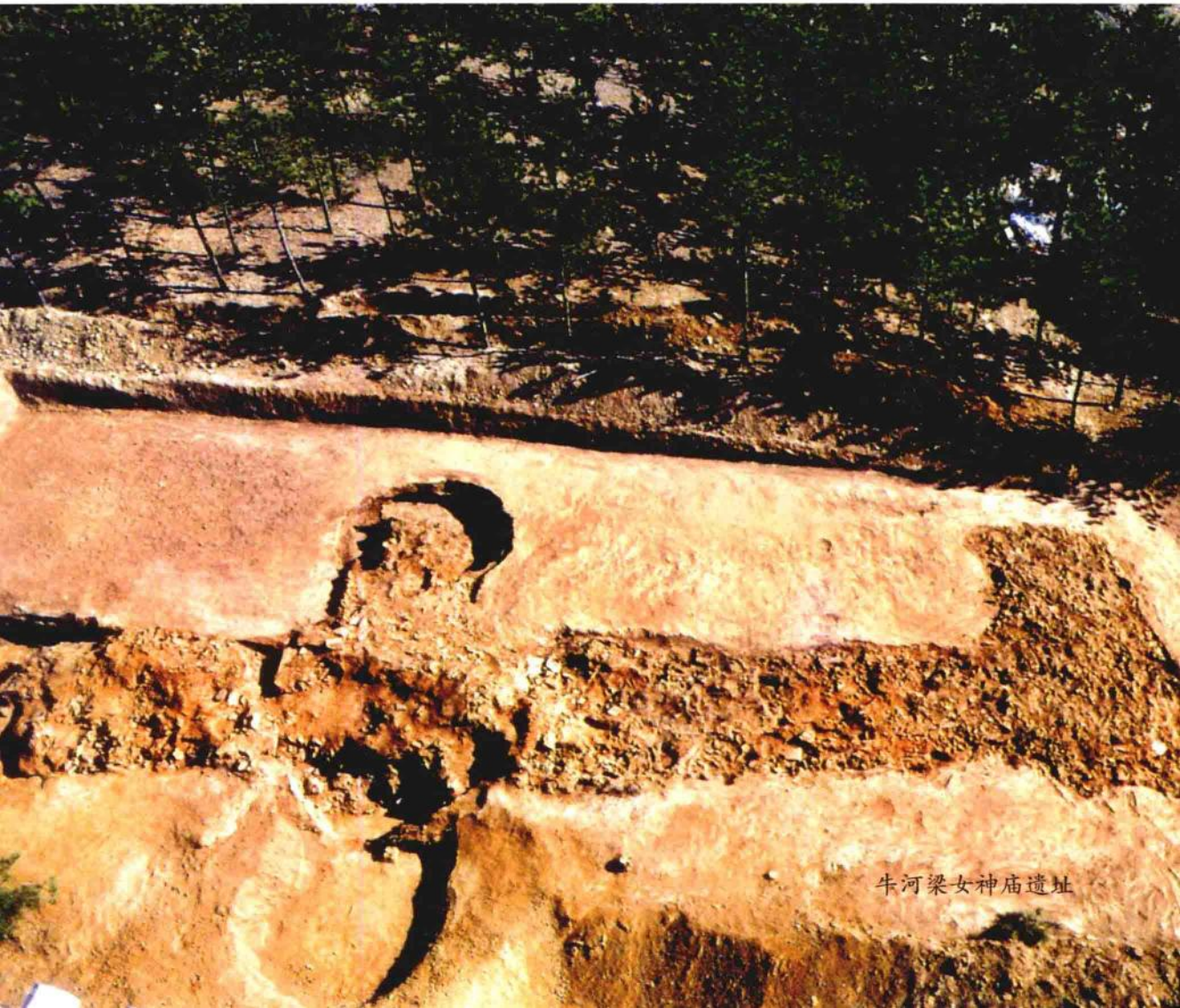
牛河梁女神庙遗址

反对黄帝出于辽宁的学者大有人在，有趣的是，质疑者虽坚持指认炎黄先祖是陕西、河南一带的中原人士，但他们的反证说却无意间带出了一位同样惊天动地的大人物，此人居然也有辽宁血统，他的名字叫颛顼。