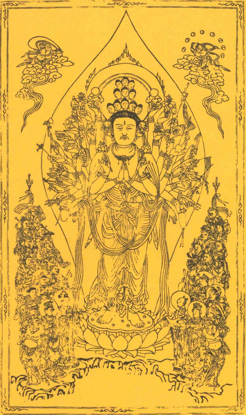
男相千手千眼观世音菩萨图