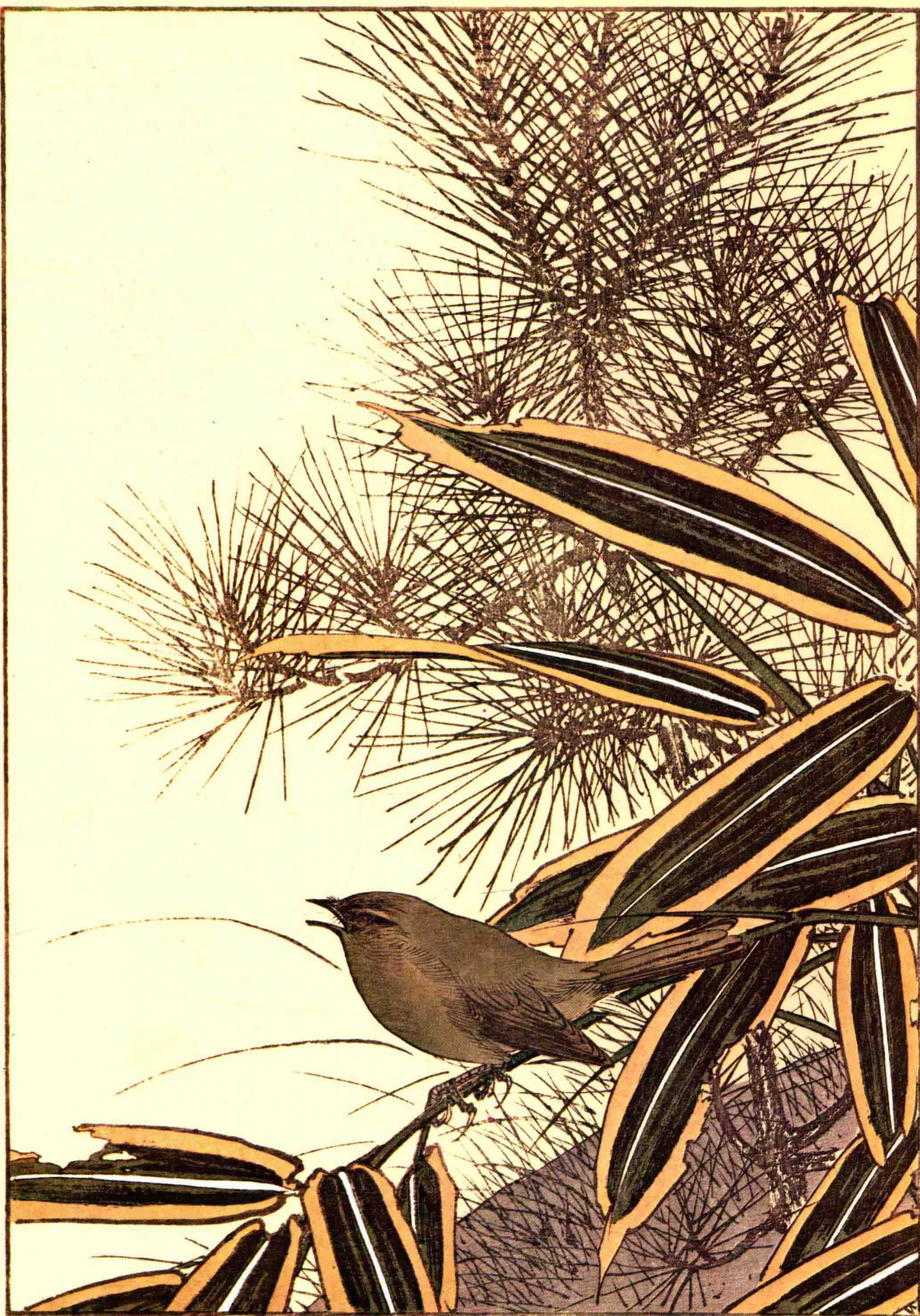
Red Pine, Mountain White Bamboo, Bush Warbler