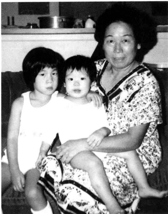
| 林书豪兄弟与奶奶。