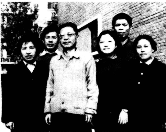
文革中，与女 儿、女婿们在 北京三里屯寓 所合影