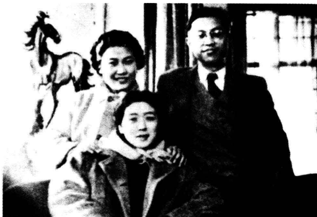
曹禺与万瑞、 张瑞芳合影