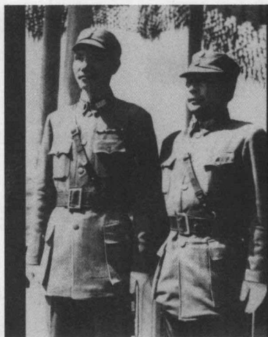
抗战时期，蒋介石与胡宗南在一起。