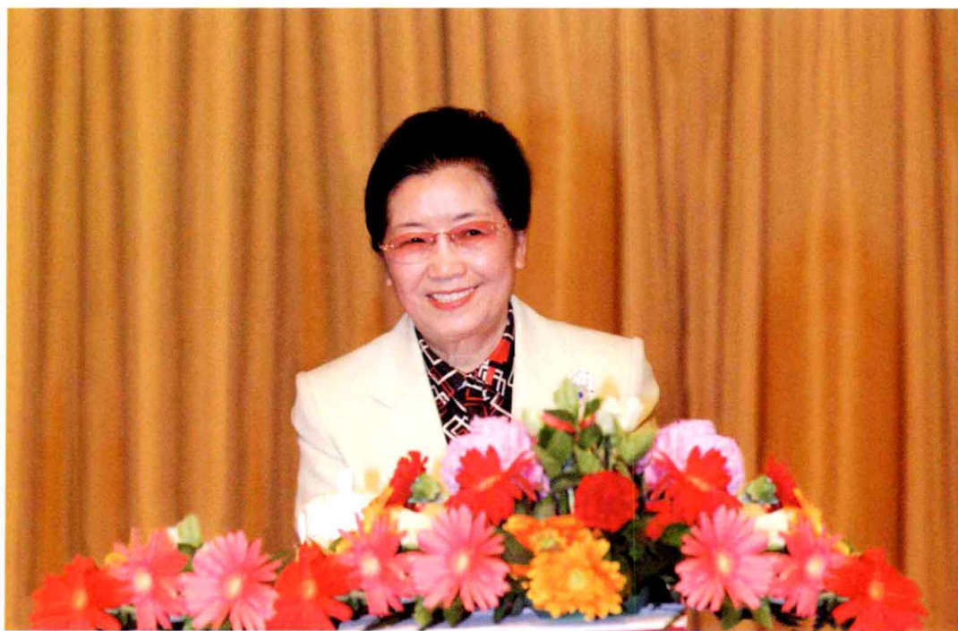
▲ 2011年5月13日，中国轻工业联合会名誉会长潘蓓蕾在中国轻工业联合会第三次会员代表大会上。