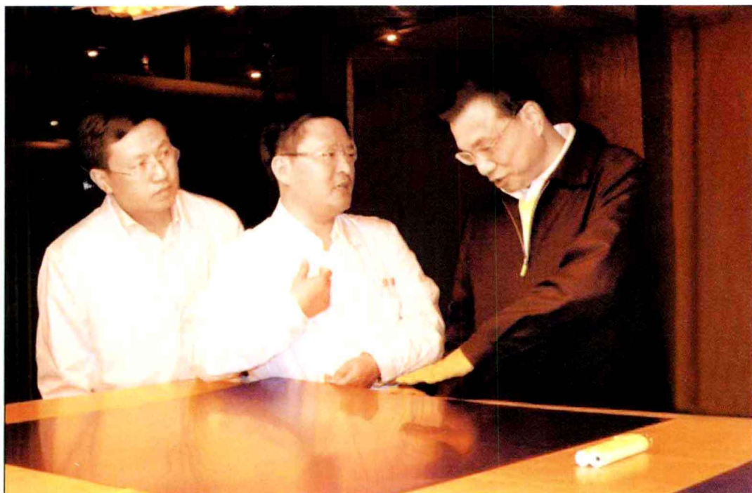
▲ 2010年10月9日，中共中央政治局常委、国务院副总理李克强(右)视察乐凯第二胶片厂。