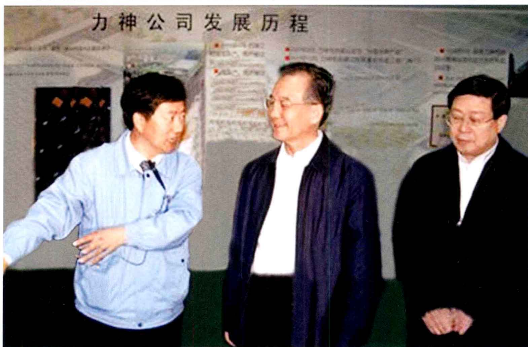
▲ 2010年5月14日，中共中央政治局常委、国务院总理温家宝（中）考察位于滨海高新区的力神电池股份有限公司。