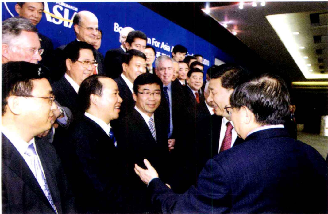
▲ 2010年4月9日，中共中央政治局常委、国家副主席习近平(右二)在“博鳌亚洲论坛2010年年会”上与茅台集团党委书记、总经理袁仁国(前排左二)亲切交谈。