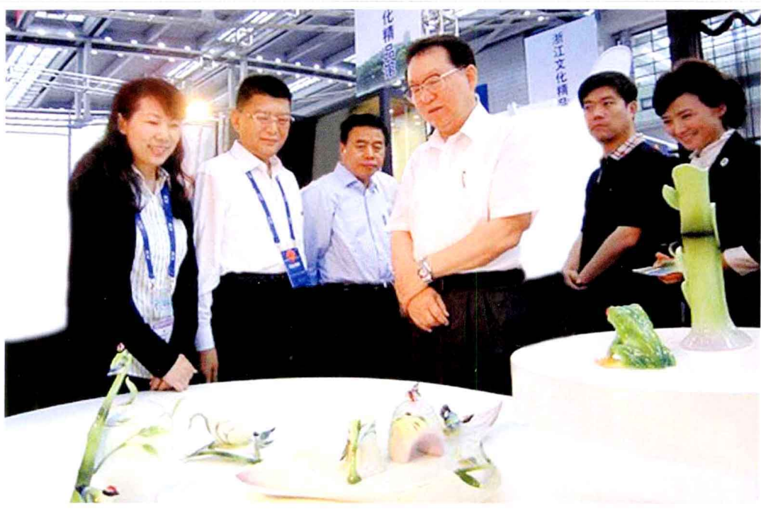
▲ 2010年5月16日，中共中央政治局常委李长春（右三）在第六届中国(深圳)国际文化产业博览交易会上参观台湾文化创意精品法蓝瓷展。