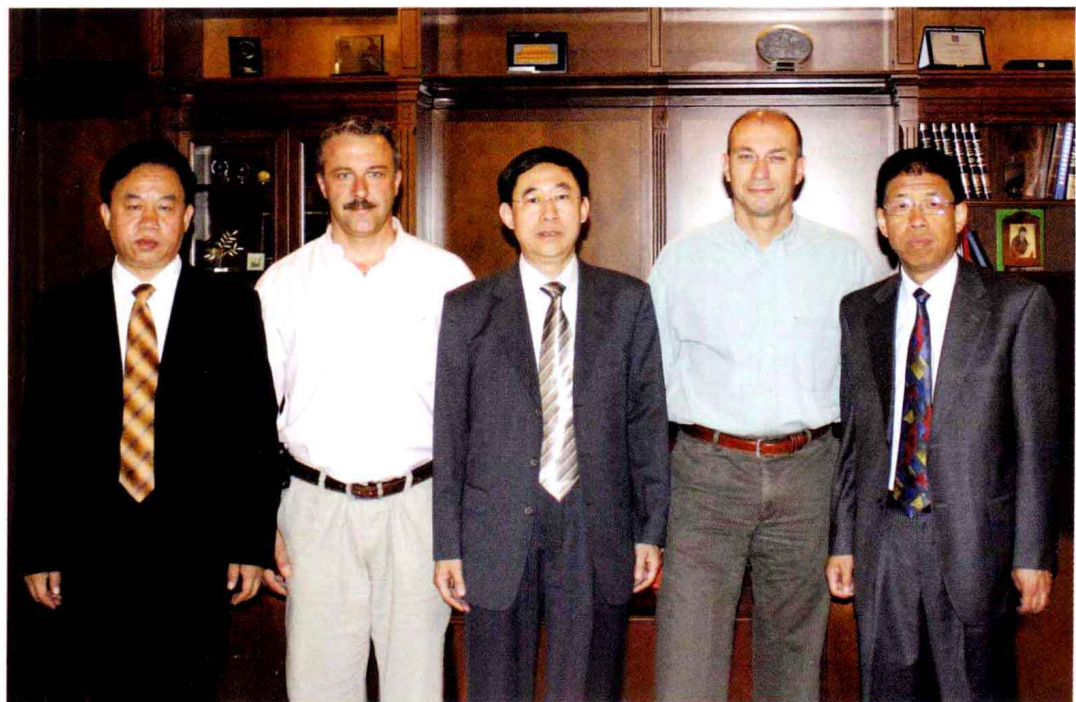
▲ 2010年6月，中国轻工业联合会副会长杜同和（中）在国际合作部主任王本和（右）、中国口腔清洁护理用品工业协会副理事长相建强（左）的陪同下出访塞浦路斯。