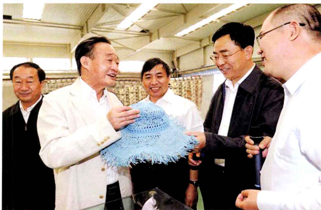
▲ 2010年9月11日，中共中央政治局常委、全国人大常委会委员长吴邦国(左二)考察中冶美利纸业公司。