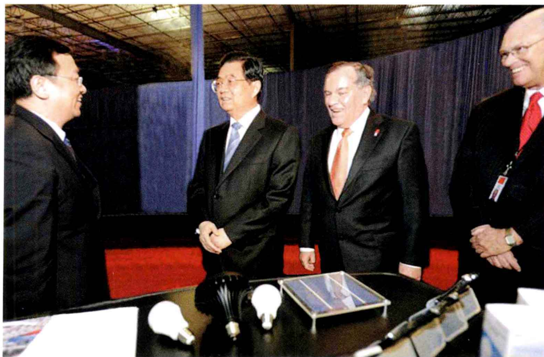
▲ 2011年1月21日，中共中央总书记、国家主席、中央军委主席胡锦涛(左二)在芝加哥参观美国中西部中国企业展。