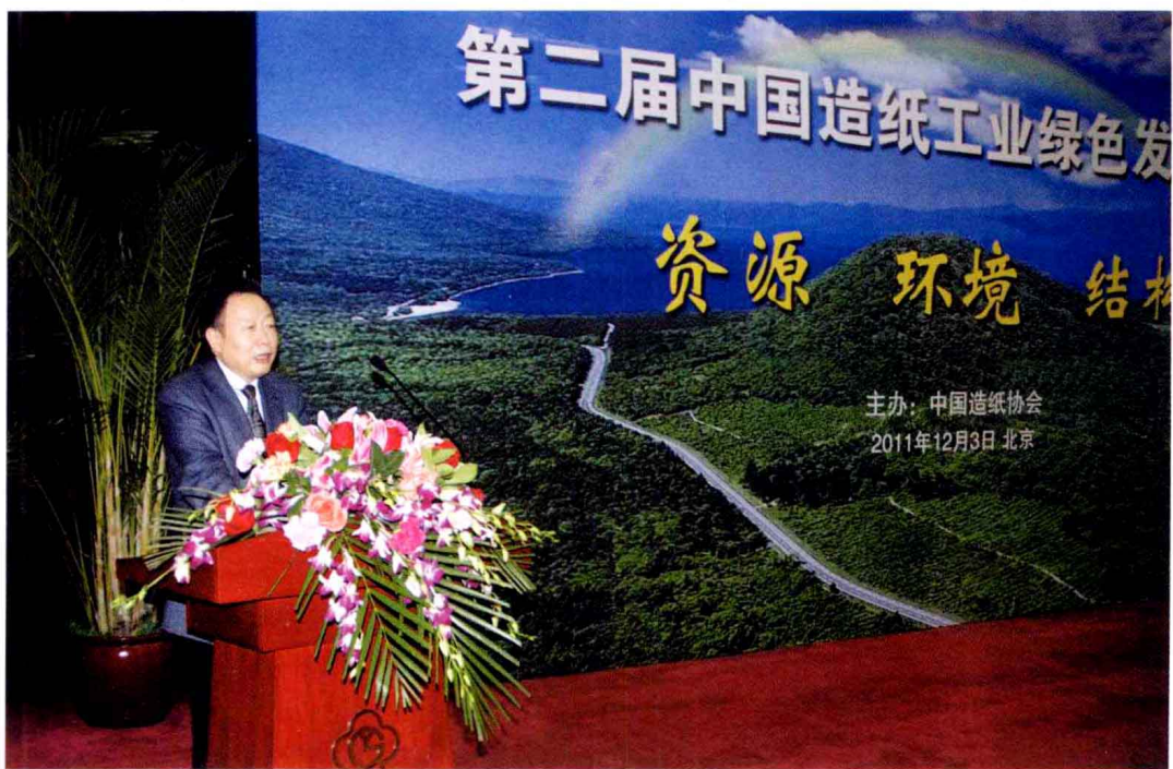
▲ 2011年，中国轻工业联合会副会长钱桂敬在第二届中国造纸工业绿色发展论坛上做“节能减排成绩和绿色纸业展望”主题发言。