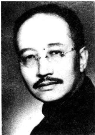
章士钊，湖南长沙人。早年留学日本，积极参加反清、反袁的革命活动。1914年在日本东京创办《甲寅》杂志，陈独秀曾担任《甲寅》的编辑和撰稿。这段生活经历为他后来编辑《新青年》杂志积累了工作经验及人脉资源。

了中国共产党，成了第一任总书记；后来，他又成了共产党内的“反对派”……陈独秀的人生道路，实在不同于那些讲究温良恭俭让、一心科举取仕的传统知识分子。而在崇尚等级尊卑、严守忠孝节义的传统恪守者看来，陈独秀反叛政府、反叛伦理道德、反叛封建宗法秩序，简直是无法无天。所以祖父的话有点道理，陈独秀这一生堪称“大逆不道”，无异于“凶恶强盗”。