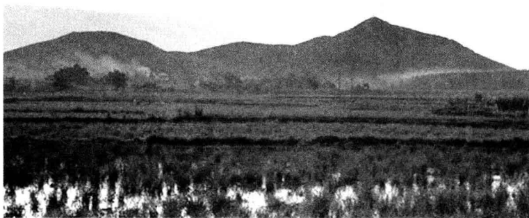
陈独秀家乡安徽怀宁县的独秀山，陈独秀的名字就源于此山。根据《怀宁县志》载：“西望如卓笔，北望如覆釜，为县众山之祖，无所依附，故称独秀。”