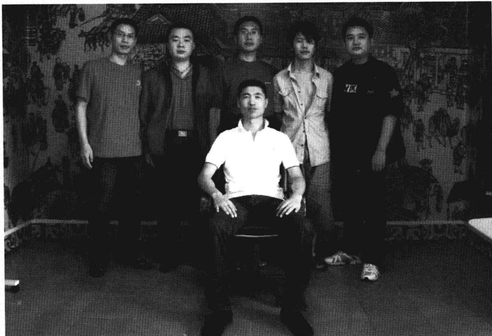
2009年第一期弟子班合影