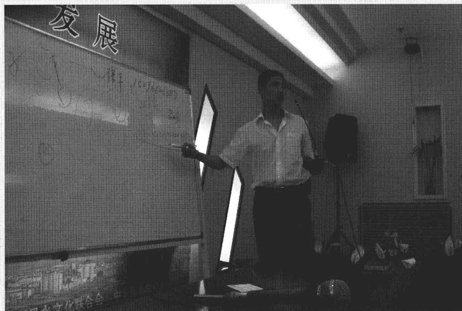
2009易学大会演讲现场