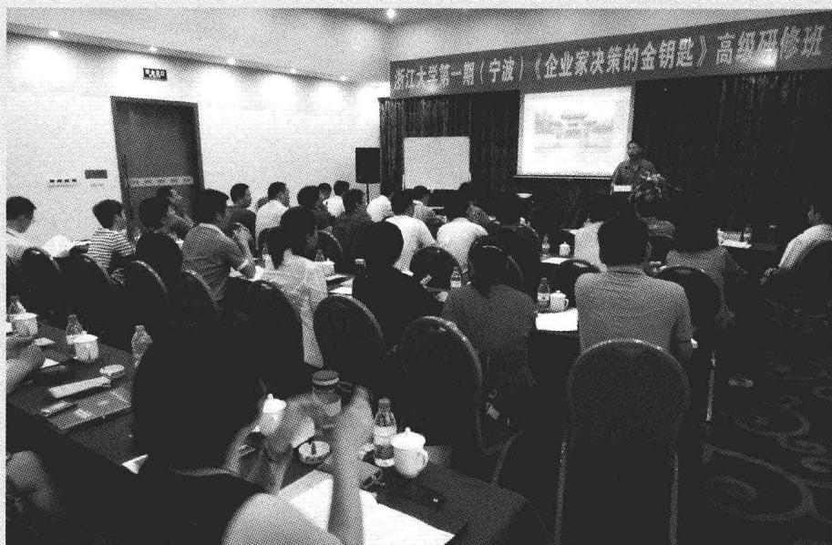
2012浙江大学宁波总裁班演讲现场