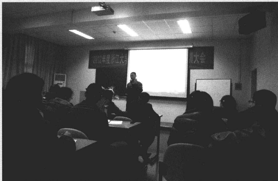
2012浙江大学杭州总裁班演讲现场