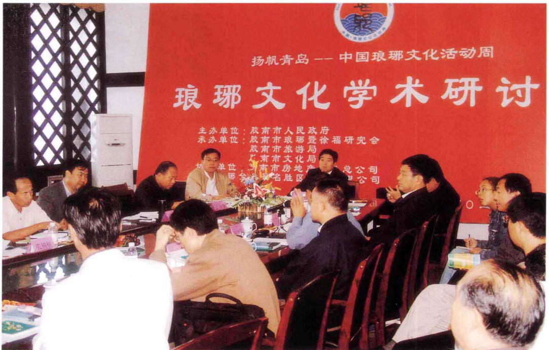
2005年9月琅琊文化学术研讨会