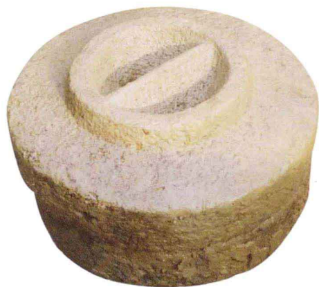
琅琊古城出土的汉代石磨