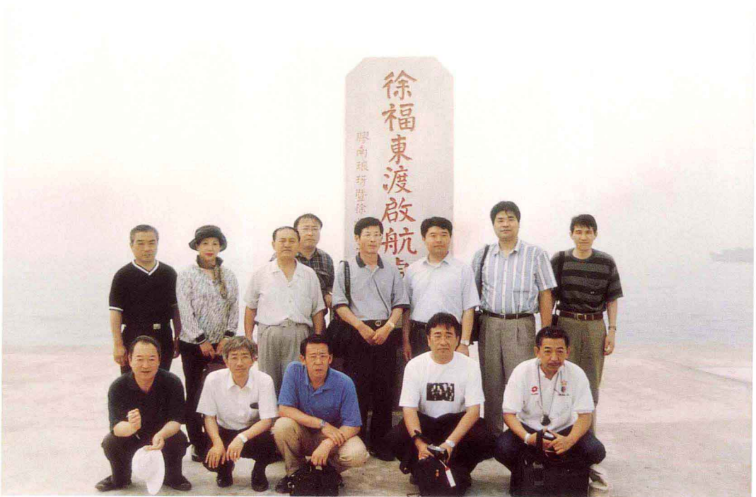
日本新宮市客人在徐福东渡启航处留影