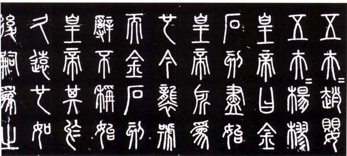
宋代文勛摹琅琊刻石