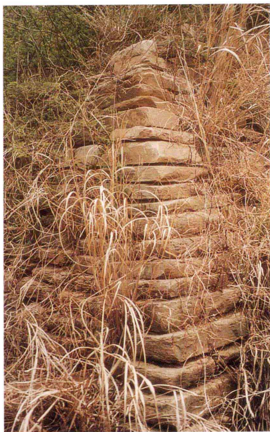
琅琊台御路下的「金字塔」形建筑物