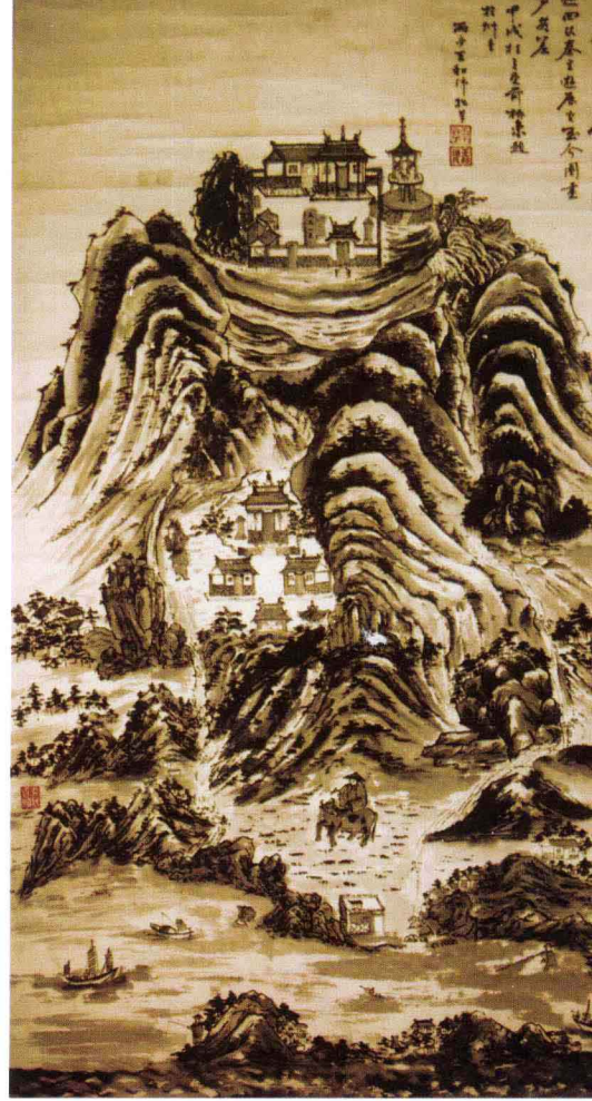
民国年间王和沛绘的《琅琊台图》