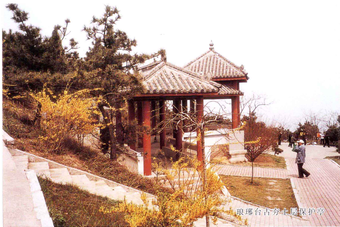
琅琊台古夯土层保护亭