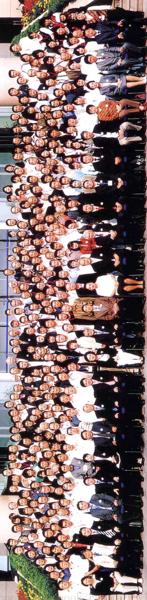
2006年青岛中日徐福文化交流会合影