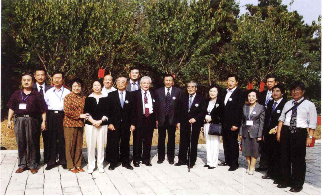
2006年青岛中日徐福文化交流活动在琅琊台栽植纪念树后代表合影