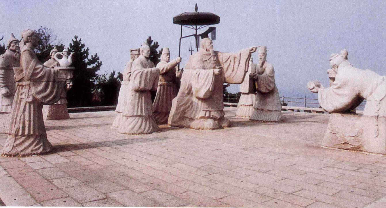
秦始皇遣徐福入海求仙群雕