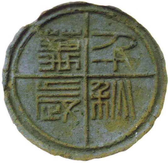
琅琊出土的“千秋万岁”秦瓦当