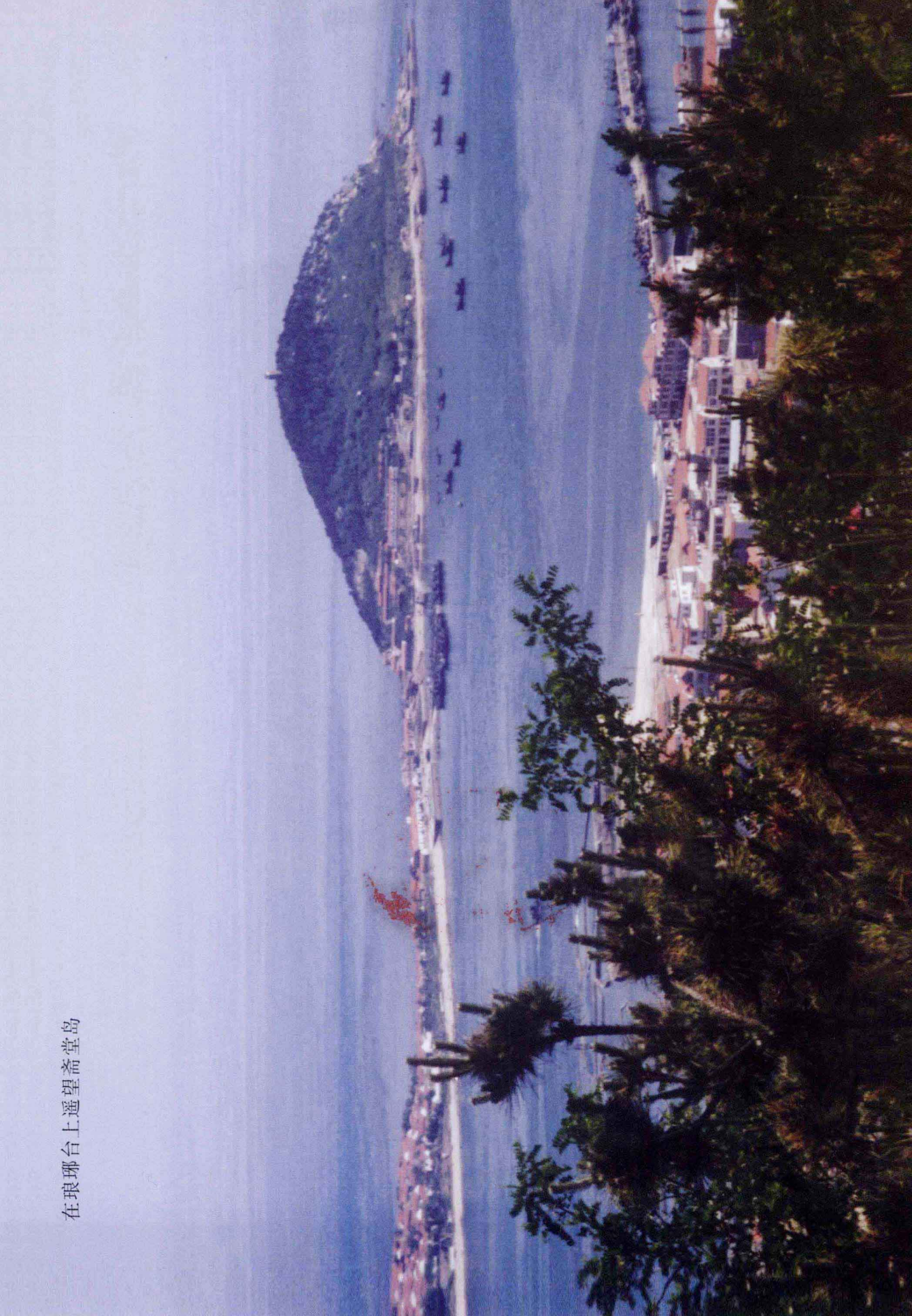
在琅琊台上遥望斋堂岛