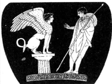
俄狄浦斯在解答斯芬克斯的谜语

了俄狄浦斯的坚强意志和对国家的责任感，并对当时流行的命运观提出了怀疑。在艺术上，索福克勒斯的悲剧结构比较复杂，布局非常巧妙，被文学史家们誉为“戏剧艺术的荷马”。