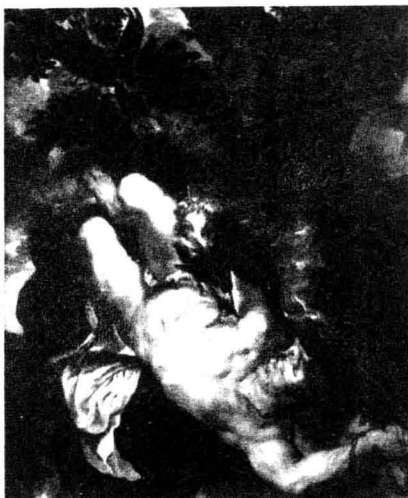
油画《被缚的普罗米修斯》

索福克勒斯的创作标志着希腊悲剧进入了成熟的阶段，是雅典民主制盛极而衰时期社会生活的反映。《俄狄浦斯王》是他的代表作，取材于古老的传说。俄狄浦斯王杀父娶母，自己却毫无所知。为了平息忒拜国内流行的瘟疫，按照神的指示，俄狄浦斯寻找杀害前王拉伊俄斯的凶手，结果发现要找的凶手就是自己。王后伊俄卡斯忒在悲痛中自尽，俄狄浦斯自己在百感交集中刺瞎了双眼，一步步把戏剧冲突推向高潮。剧本热烈歌颂