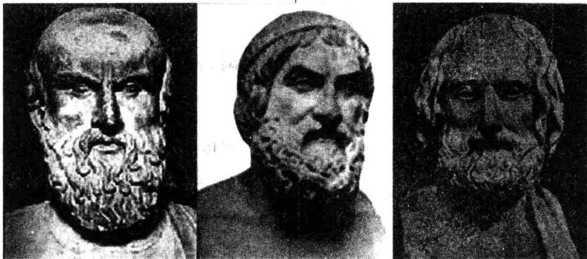
埃斯库罗斯 索福克勒斯 欧里庇得斯

公元前5世纪,是希腊悲剧的繁荣时期,涌现出大批悲剧作家,上演了许多悲剧作品。其中最著名的三大悲剧作家是埃斯库罗斯(公元前525?~前456)、索福克勒斯(公元前496?~前406)和欧里庇得斯(公元前485?~406)。他们的创作,反映了奴隶主民主制不同阶段