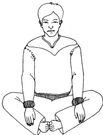
图 2 - 15

合掌功在起式后直到收式前双掌始终不分离。起式后，静止不动调息练功一定的时间，或收式结束，或加入图 2 - 14 式一遍至三遍，又静止调息。或作或息，多少不拘，随心所欲。如果坚持每天早上练习十分钟，晚上练习二十分钟，两周下来，就会感觉到效果。